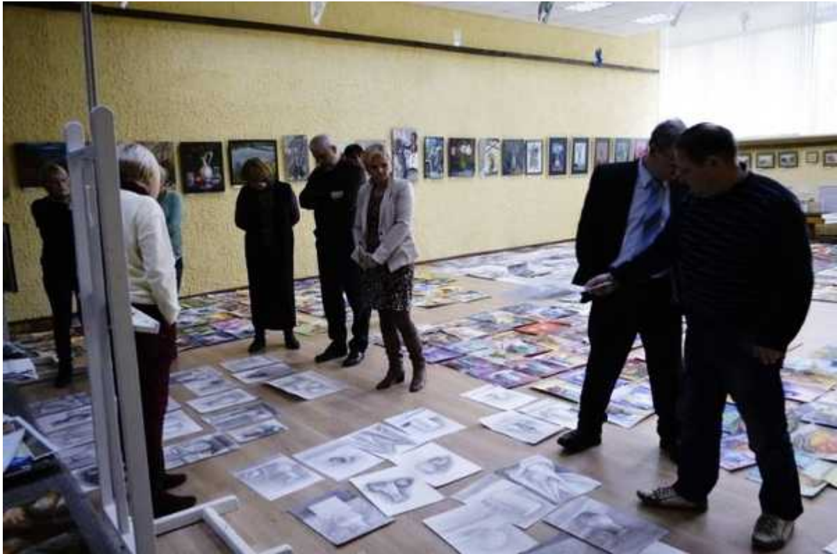
Просмотр присланных работ

конкурс состоялся уже в четвёртый раз. Посылки с рисунками надо получить на почте, проверить по списку, разложить по классам обучения. Всё делается в три дня, и это при том, что школа работает в обычном учебном режиме! Хорошо, что у нас имеется свой выставочный зал, где можно выложить и просмотреть все рисунки. Но и этого помещения не хватает, и мы задействуем учебные мастерские.