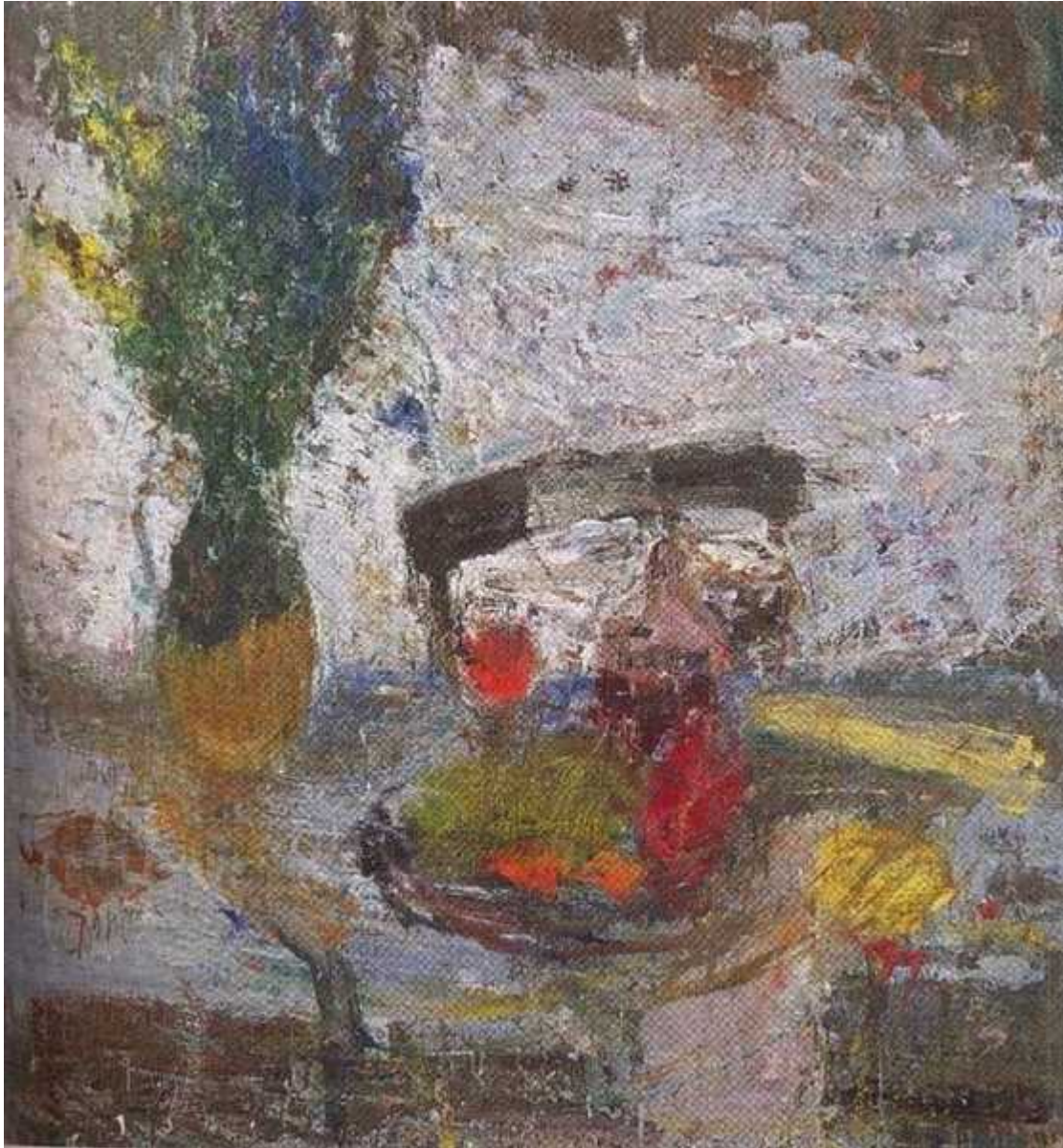
В. С. Сорокин, Натюрморт с букетом, 1995

Александр Сорочкин рисует умом, чётко прорабатывает линии. Его натюрморты — это самые правильные формы, разложенные в самом правильном порядке. Упругие груши, круглые яблоки и угловатые подсолнухи, а в пейзажах: тонкие волевые линии деревьев, правильные прямые горизонты, в которых танцуют кривые ветки. Кажется, если убрать цвета и оставить лишь линии, ты также зачарованно будешь смотреть на изгибы и пересечения.