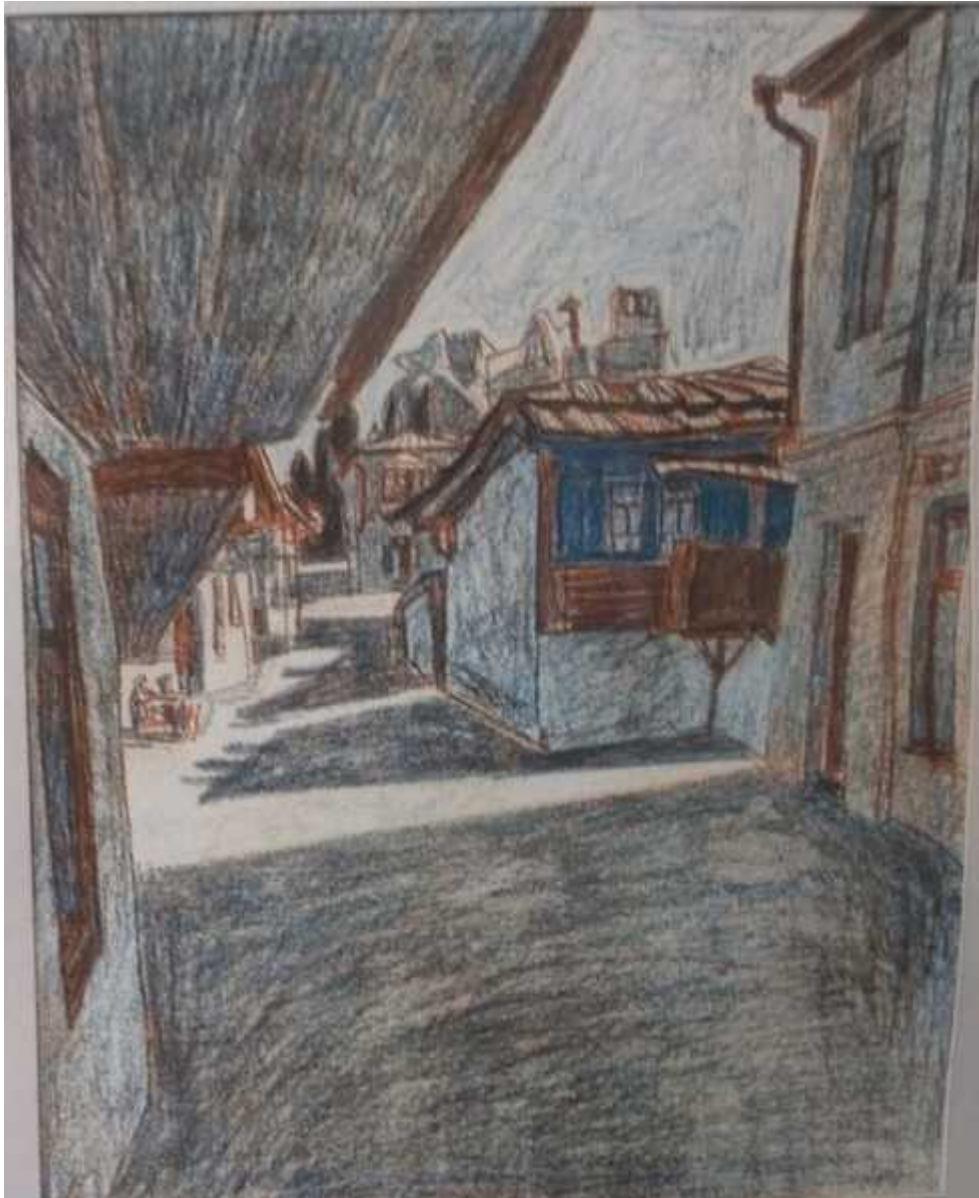
А.М. Сорочкин, Цветной графический лист «Гурзуф» 1985, бумага, графический карандаш

На выставке экспозиция кажется не выстроенной. Восемнадцать живописных и графических работ юбиляра из фондов краеведческого музея, развешенные по двум залам, разряжаются работами друзей, учителей и учеников в довольно-таки хаотичном порядке. И неудивительно, что человек, случайно попавший на выставку и окинувший её неопытным взглядом, стремительно уходит прочь разглядывать какие-нибудь экспозиции военных лет и русские народные костюмы.