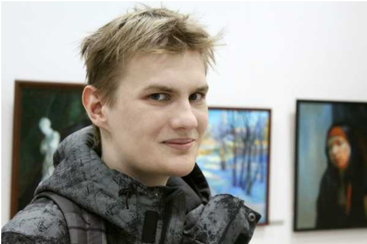
Фотография 8 из 12. Для просмотра галереи нажмите на фото.