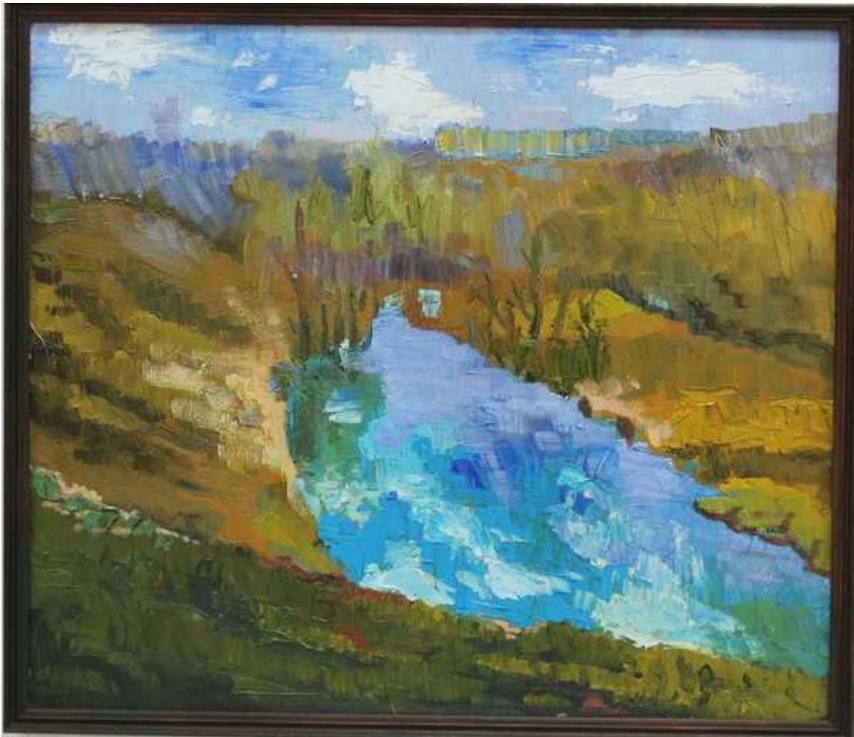
Фотография 2 из 12. Для просмотра галереи нажмите на фото.