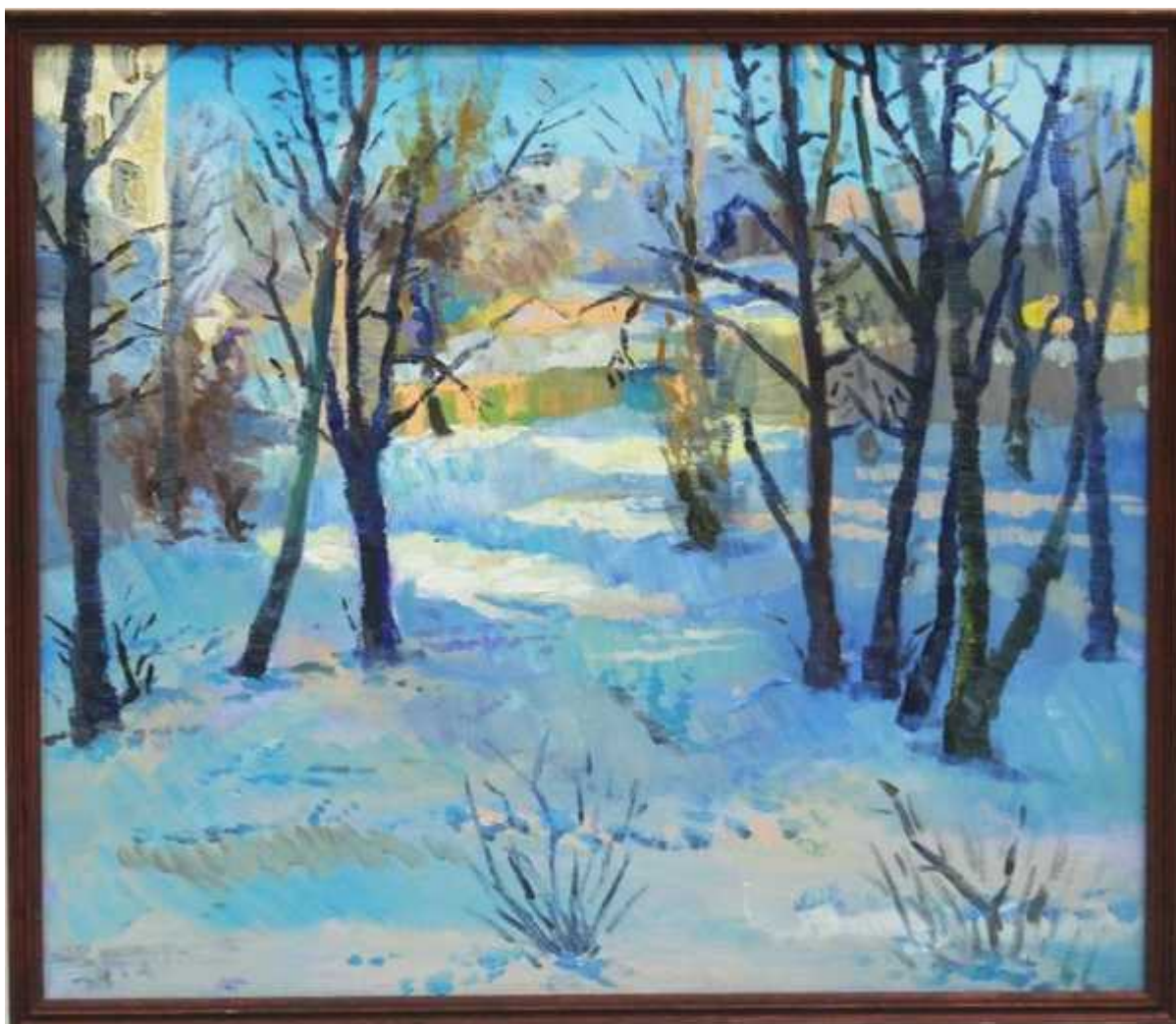
Фотография 7 из 12. Для просмотра галереи нажмите на фото.