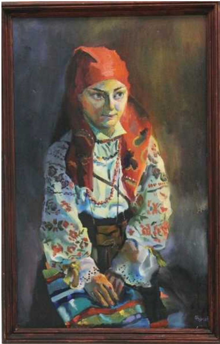
Фотография 3 из 12. Для просмотра галереи нажмите на фото.