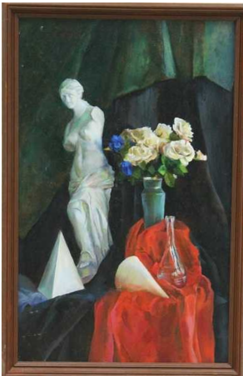
Фотография 10 из 12. Для просмотра галереи нажмите на фото.