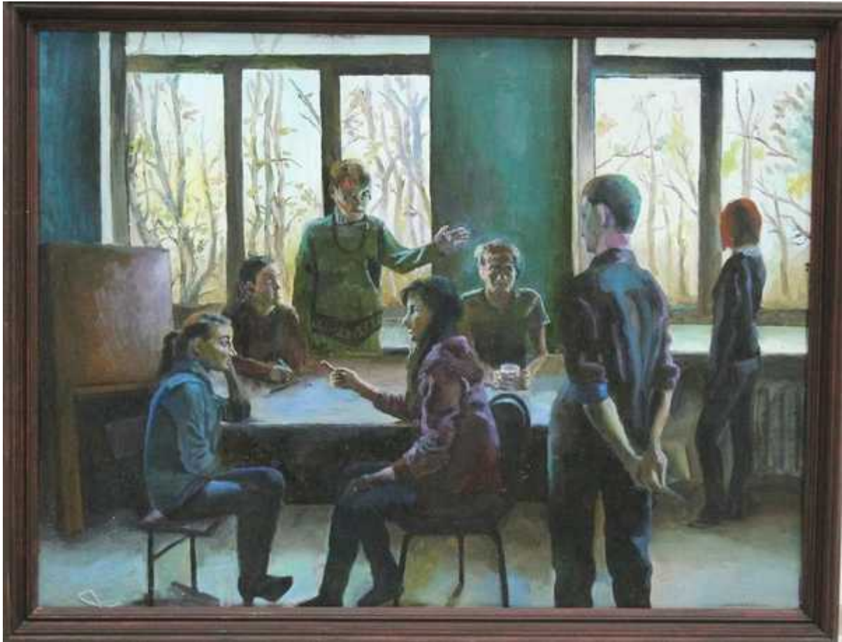
"День в колледже" 2013г.

— У нас очень тёплая обстановка, «неформальная». В какой-то момент поймал себя на мысли, что в колледже чувствую себя так же свободно, как дома, в собственной мастерской. Там тоже рабочая атмосфера: ковры в масле, вокруг холсты, кисти и прочий материал. Родственники моё увлечение разделяют и не против того, чтобы я стал художником.