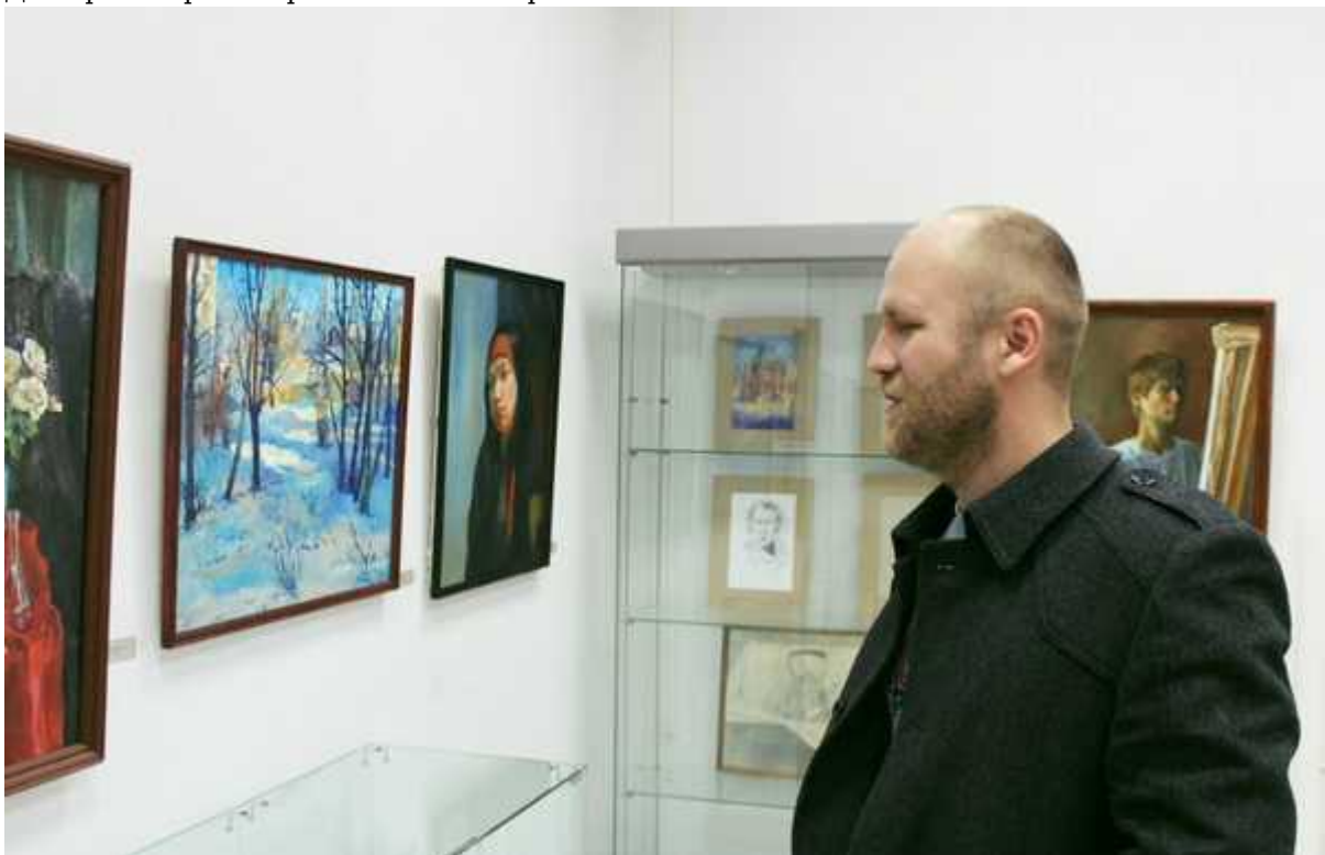
Фотография 9 из 12. Для просмотра галереи нажмите на фото.