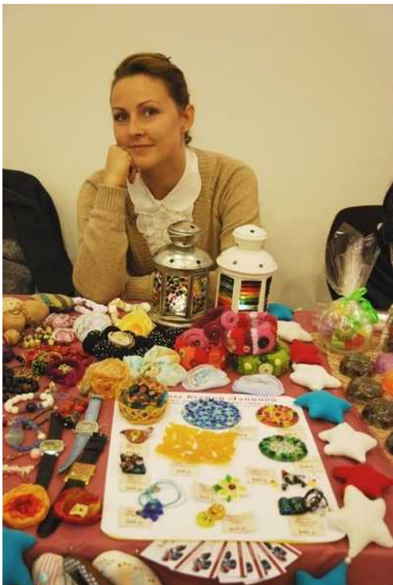
Арт-маркет "VINTAGE" Выставка-продажа Handmade 28-29 сентября 2013г.