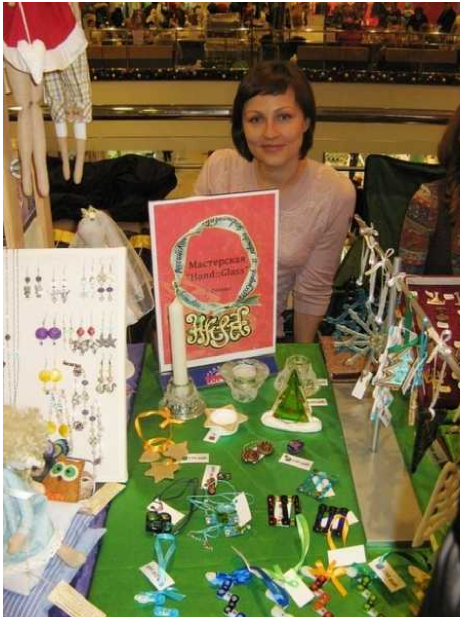
Выставка-ярмарка в рамках Фестиваля российских дизайнеров ?И?К?Р?А?! 2012г.