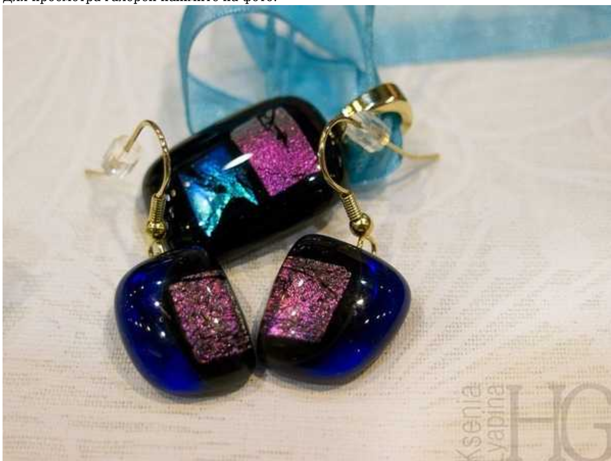
Фотография 2 из 11.