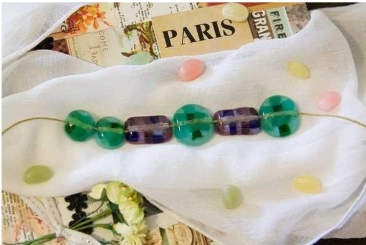
Фотография 5 из 11.