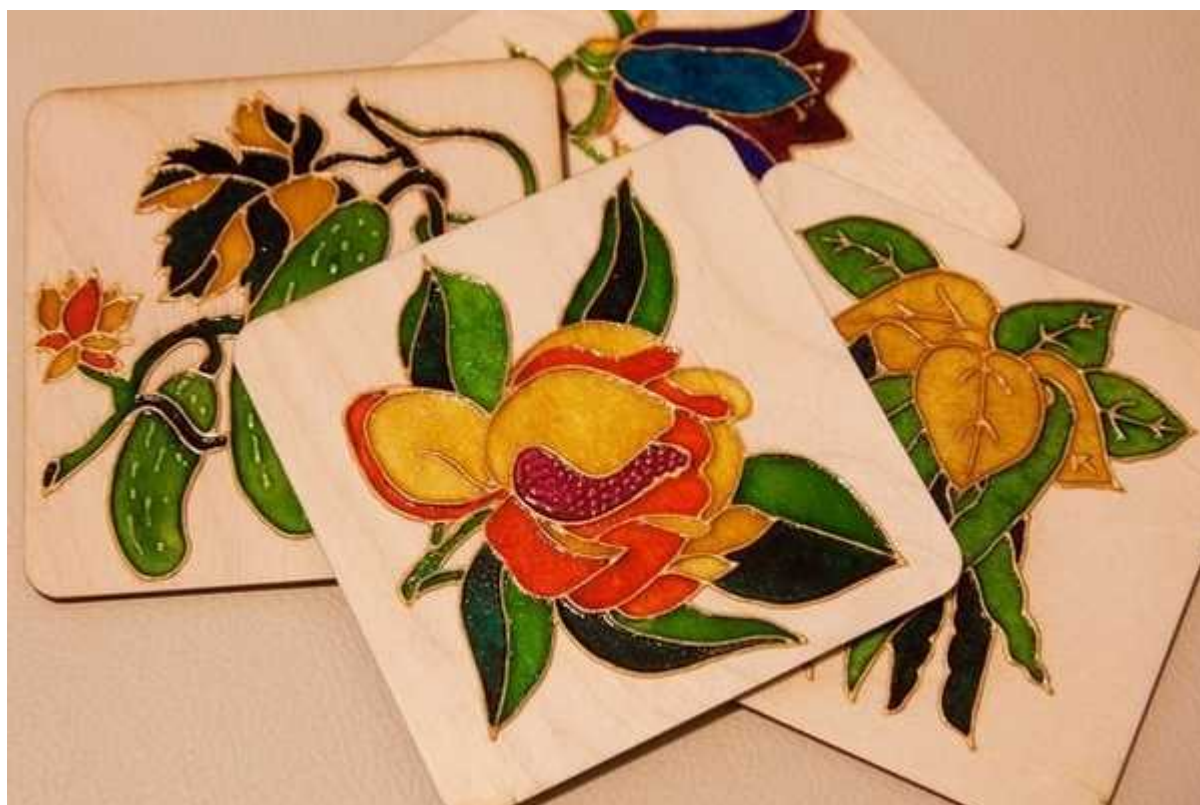
Подставки под бокалы