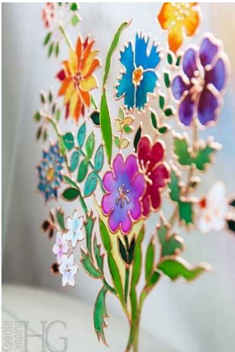
Витражное панно "Цветы весны" Стекло, витражный лак, рельефный контур