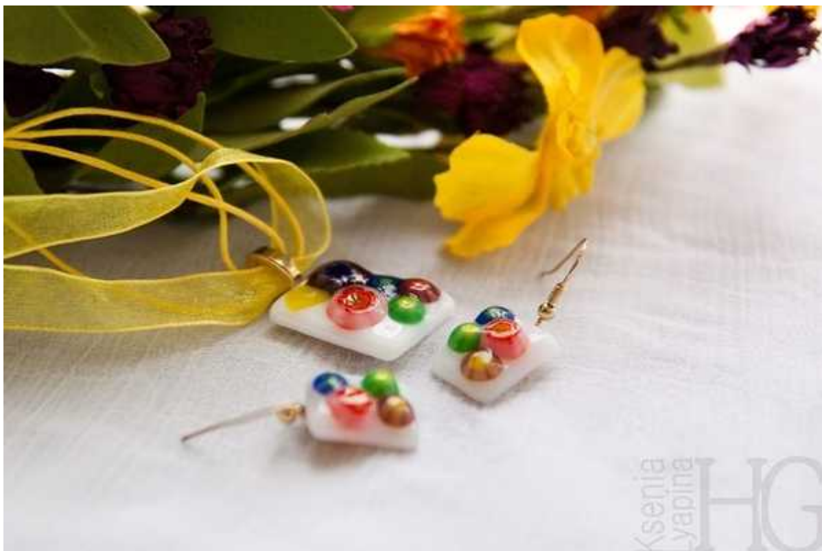
Фотография 3 из 11. Для просмотра галереи нажмите на фото.