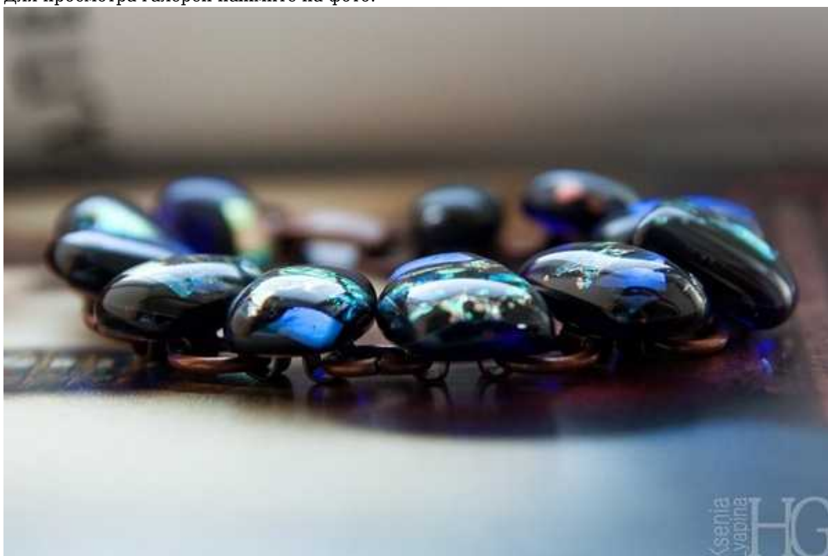
Фотография 4 из 11. Для просмотра галереи нажмите на фото.