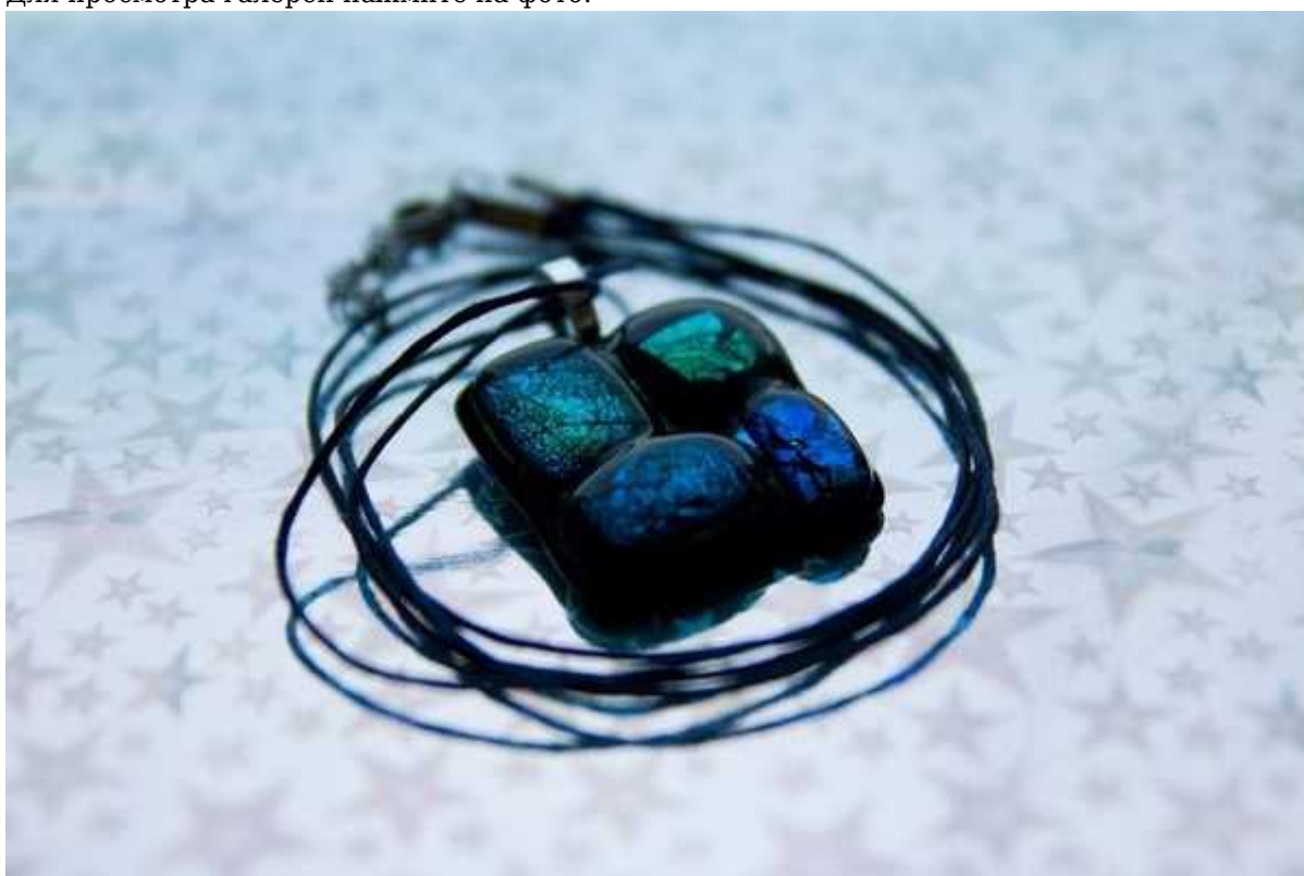
Фотография 8 из 11. Для просмотра галереи нажмите на фото.