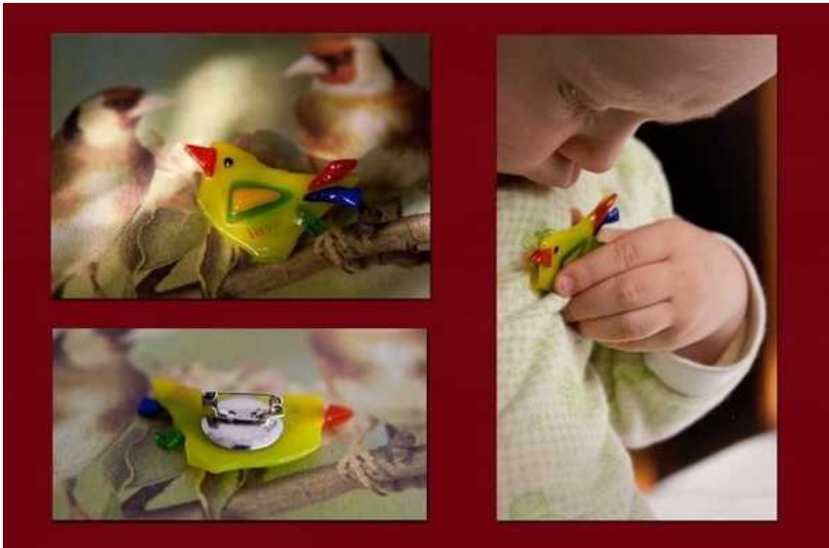
Брошь "Птица-любовь" Стекло, металлическая фурнитура