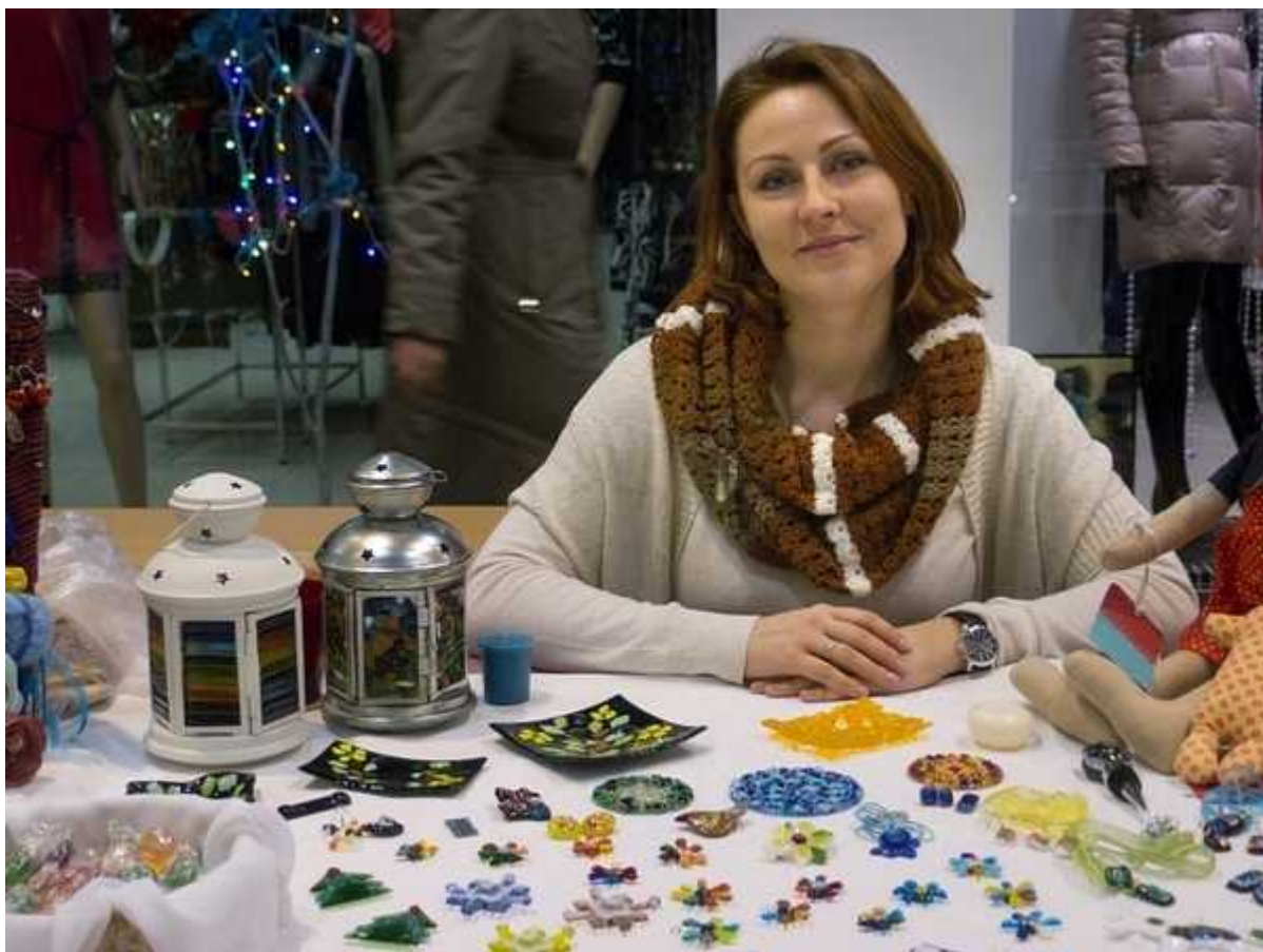
Арт-маркет "VINTAGE" Выставка-продажа Handmade 21 декабря 2013г.