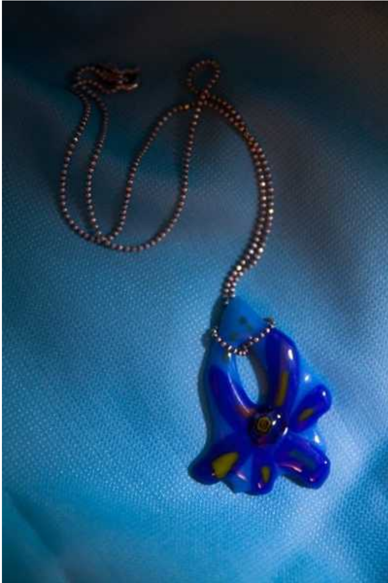
Фотография 10 из 11. Для просмотра галереи нажмите на фото.