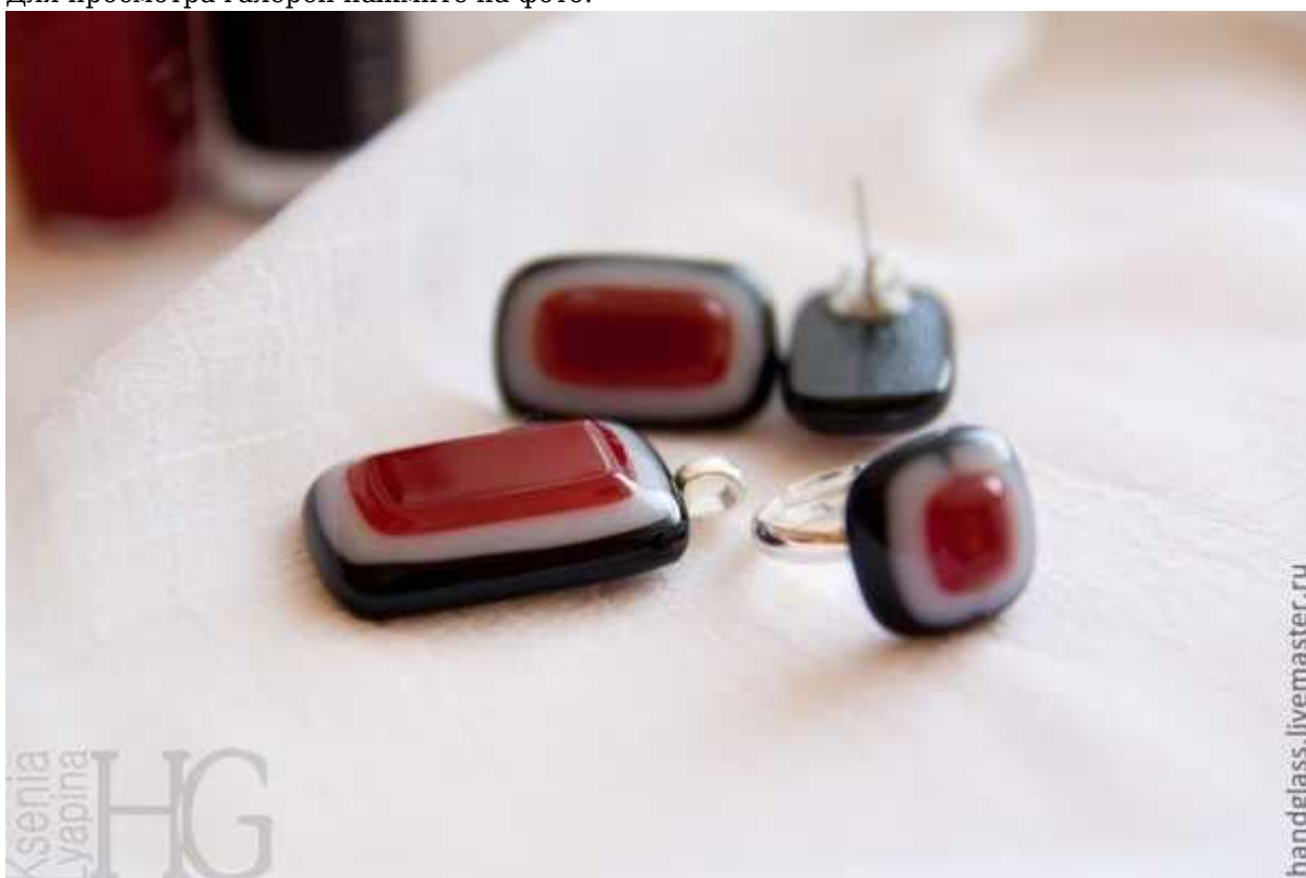
Фотография 6 из 11.