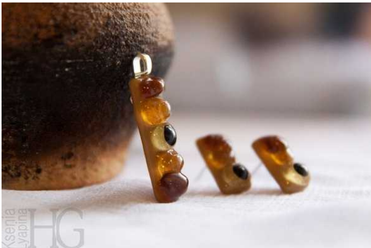
Фотография 1 из 11.