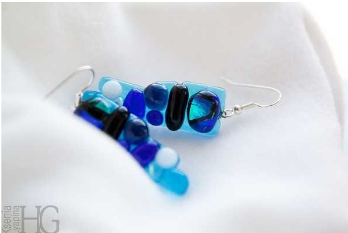
Фотография 7 из 11. Для просмотра галереи нажмите на фото.