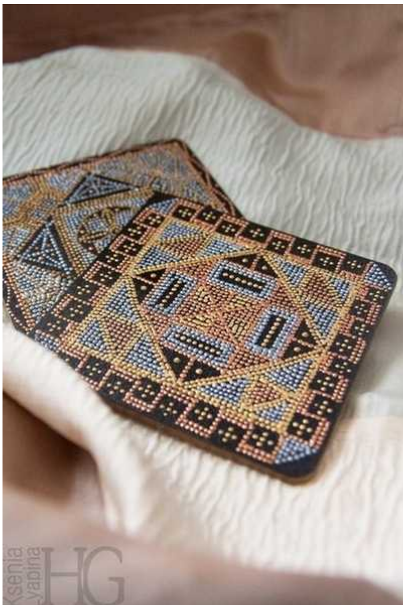
Подставка под бокал

Точечная роспись пришла к нам от аборигенов Австралии и Индонезии, которые использовали её как наскальную сакральную роспись. Благодаря современным материалам и техникам, эта роспись стала широко применяться для украшения посуды, кожаных изделий, а также для создания декоративных панно. Точечная роспись интересна тем, что ее можно применять практически на любых поверхностях, будь то древесина, керамика, стекло или металл. Поскольку в этой технике я использую контуры, предназначенные для стекла, главное — правильно загрунтовать и покрыть заготовку лаком, чтобы сцепление материалов было наиболее крепким. То есть как бы создать иллюзию стеклянной поверхности. Орнаменты в таком стиле я использую для дополнительного декора в витражной росписи и для украшения изделий из древесины и керамики. Но вообще точечной росписью и росписью керамики я занимаюсь не так углубленно, как витражной росписью и фьюзингом.