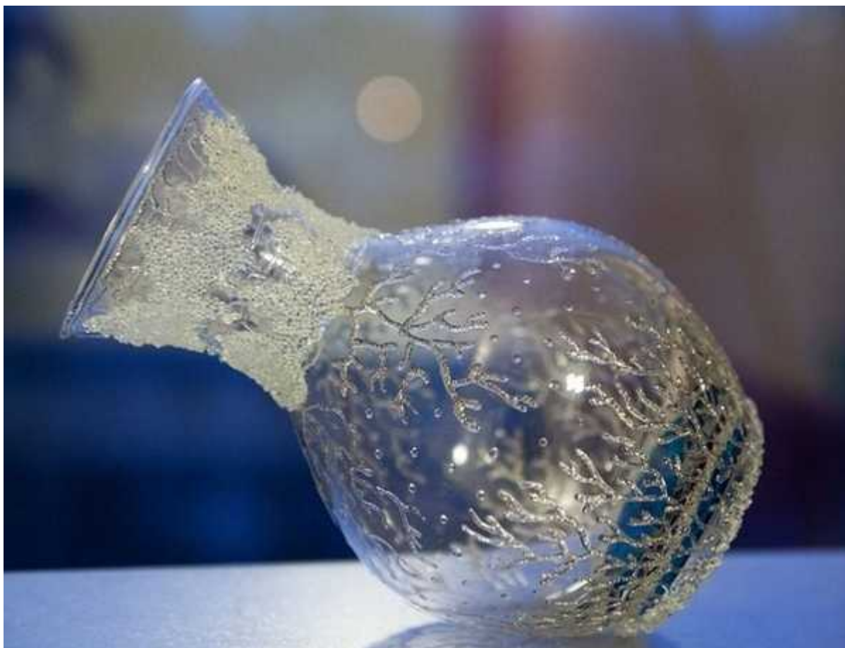
Ваза "Зима" Хрустальная паста, объемный контур, глиттер