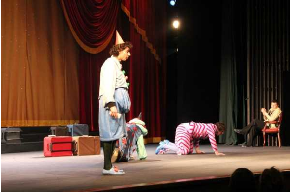
Фотография 4 из 4.