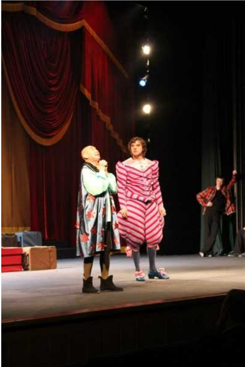
Фотография 3 из 4. Для просмотра галереи нажмите на фото.