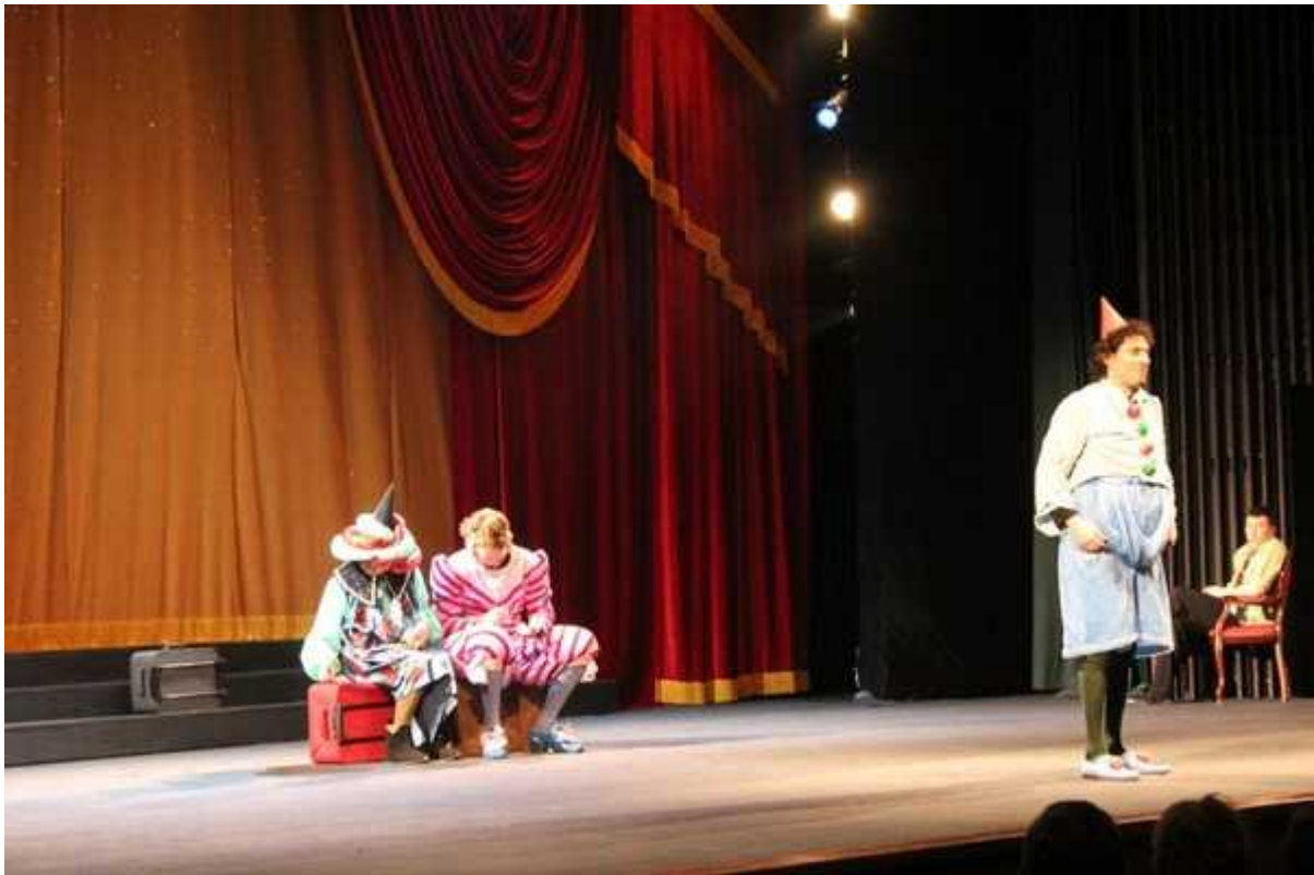
Фотография 1 из 4.

То перед вами три друга-актёра, в жизни которых с появлением денег всё меняется и разыгрывается библейский сюжет предательства Каином Авеля.