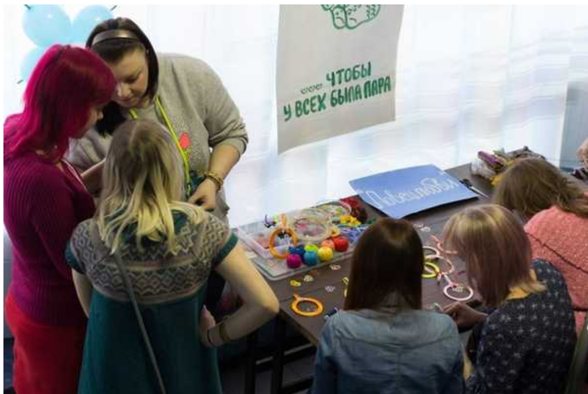
Фотография 1 из 5.

В назначенные три часа ККЗ «Октябрь» был уже полон любопытствующими, волонтерами и, конечно, журналистами. Люди всё прибывали и несли с собой различные вещи: одежду, книги, игрушки, диски, бижутерию и ещё множество приятных мелочей. Их сразу рассортировывали и добавляли на прилавки: ребята, ставшие волонтерами на этом мероприятии, отлично выполнили свою задачу; каждый из них был искренне готов помочь с распределением или подсказать с выбором книги, например.