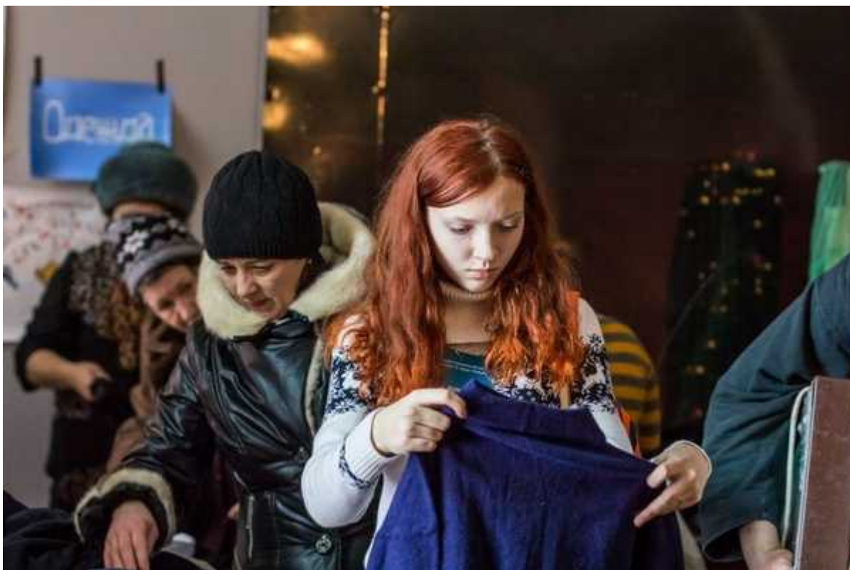
Фотография 4 из 5.