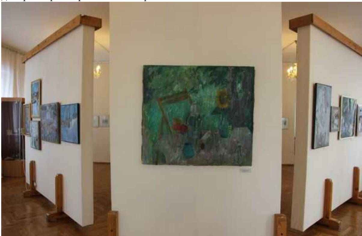
Фотография 8 из 12.