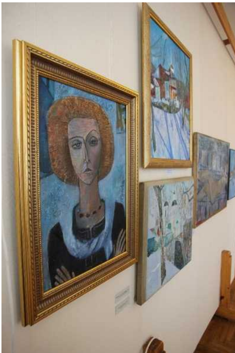
Фотография 11 из 12. Для просмотра галереи нажмите на фото.