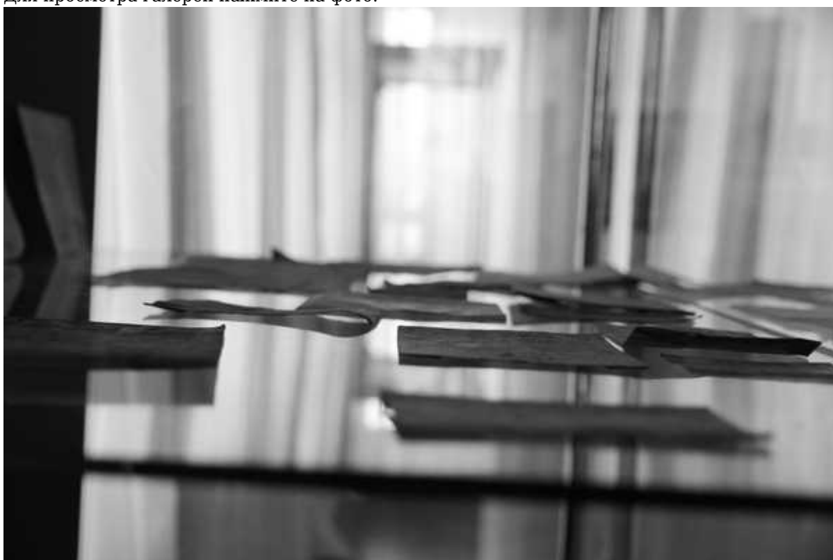
Фотография 4 из 12.