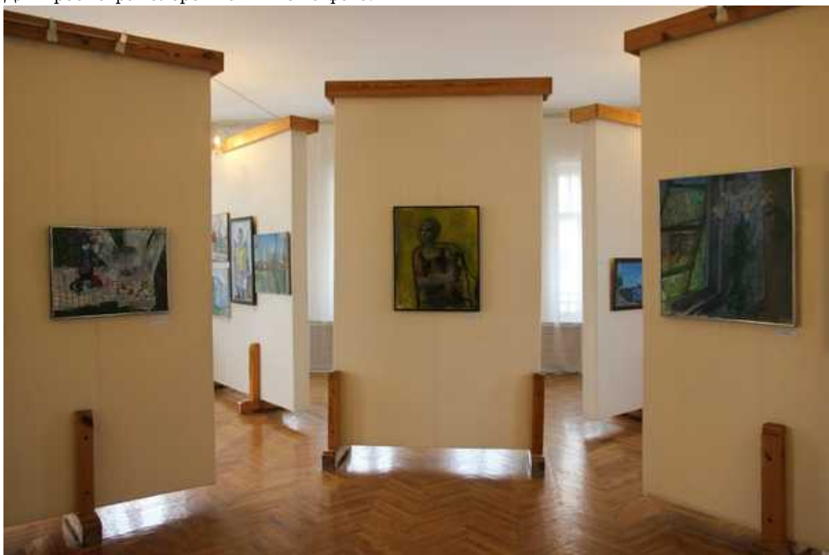
Фотография 10 из 12.