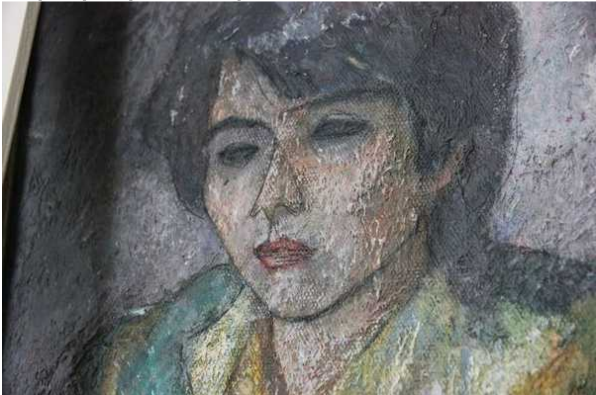
Фотография 6 из 12. Для просмотра галереи нажмите на фото.