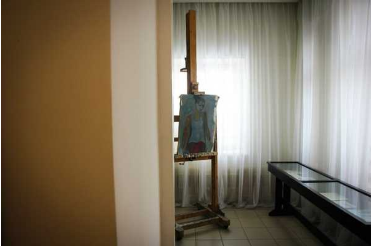
Фотография 5 из 12. Для просмотра галереи нажмите на фото.