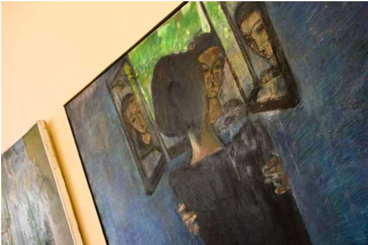
Фотография 7 из 12.