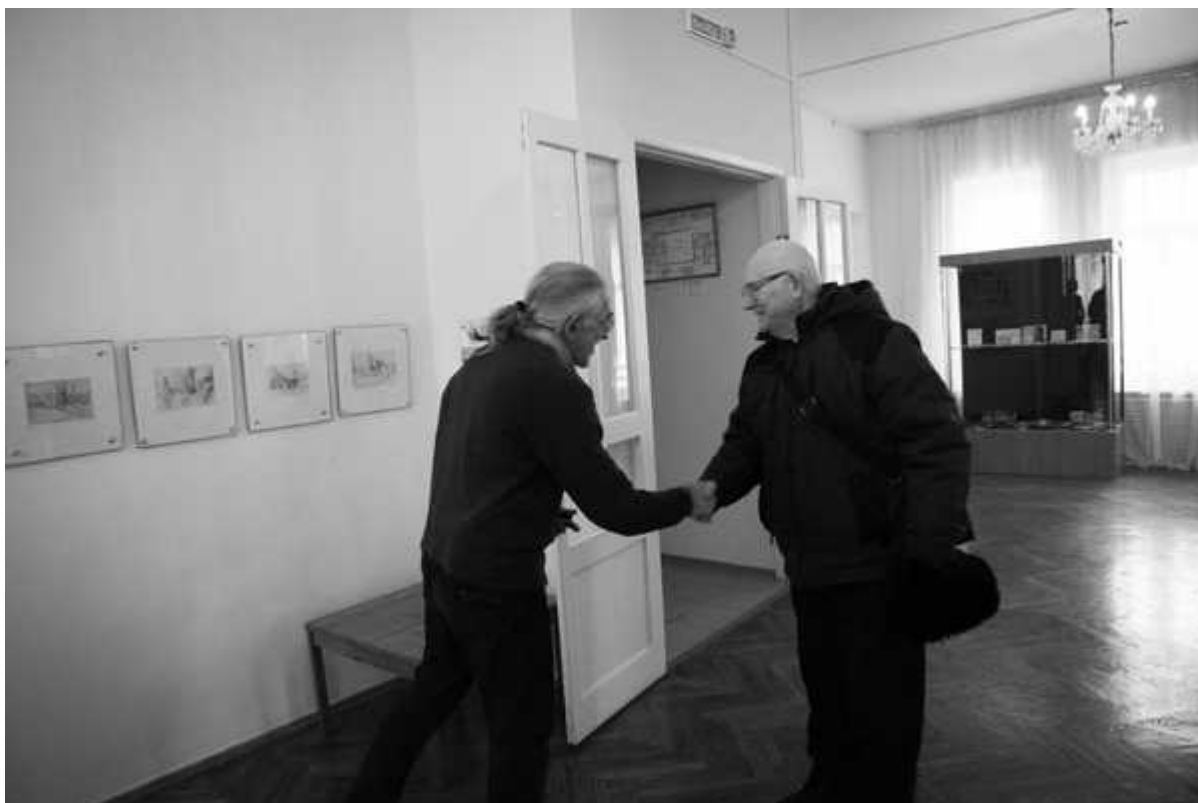
Фотография 3 из 12.