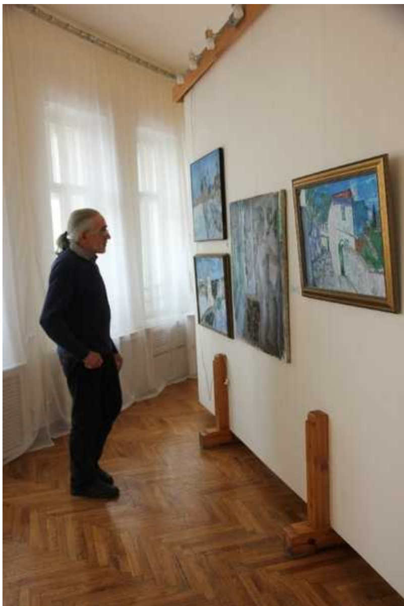
Фотография 2 из 12. Для просмотра галереи нажмите на фото.