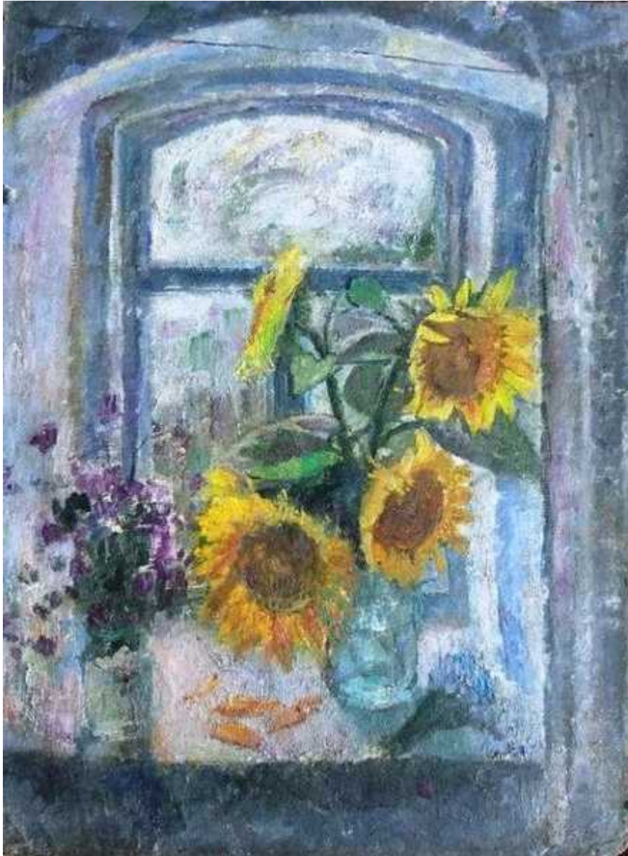
Окно детства. 1974