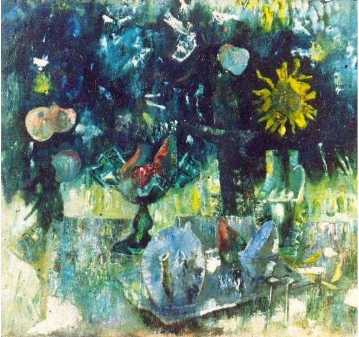
Чайный натюрморт с зелёной вазой и подсолнухом. 1987