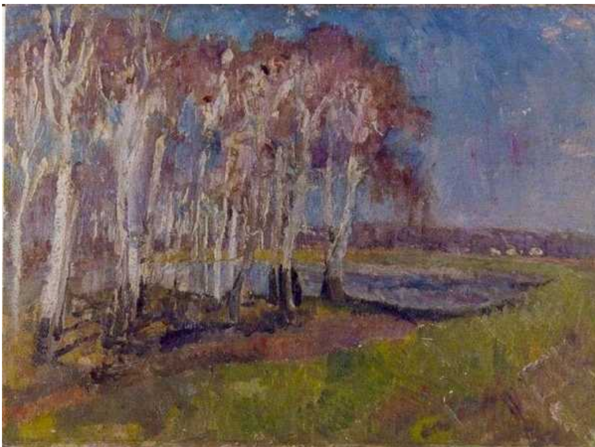
Берёзовая роща в Петровке. 1975