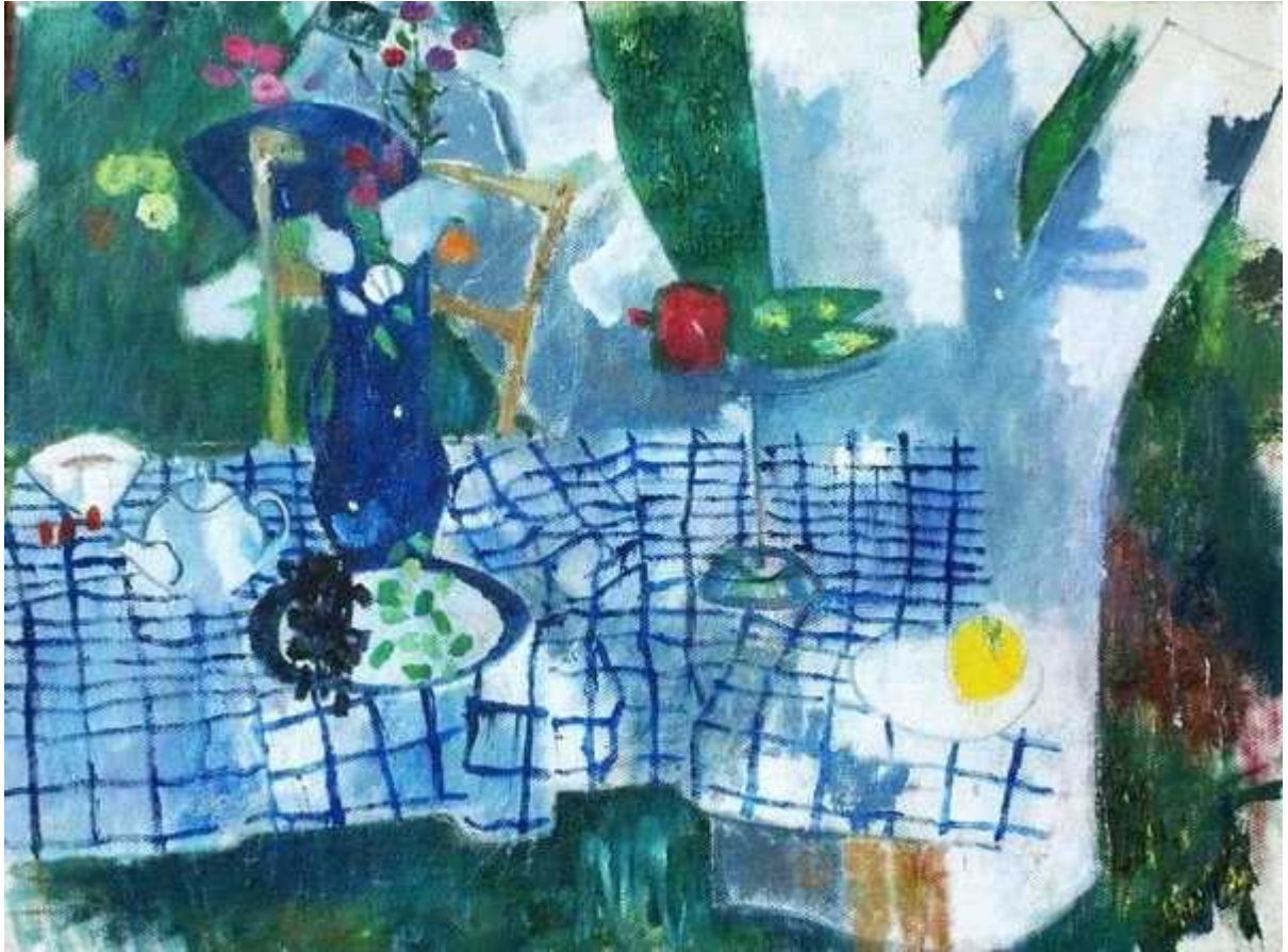
В саду. 2002