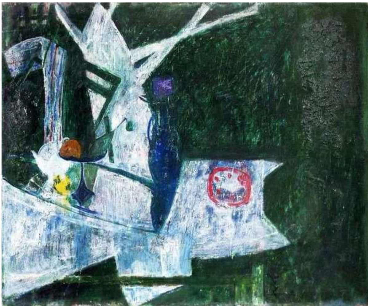
Зелёный натюрморт. 1997