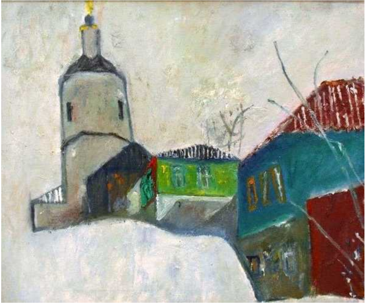
Елец. Первый снег. 2009