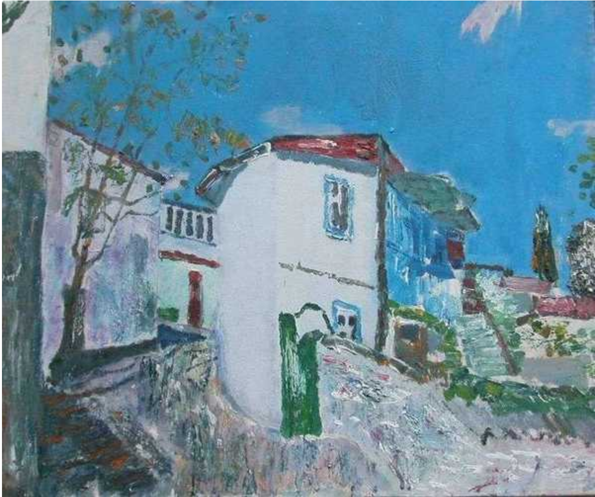
Белый дом в Гурзуфе. 2004