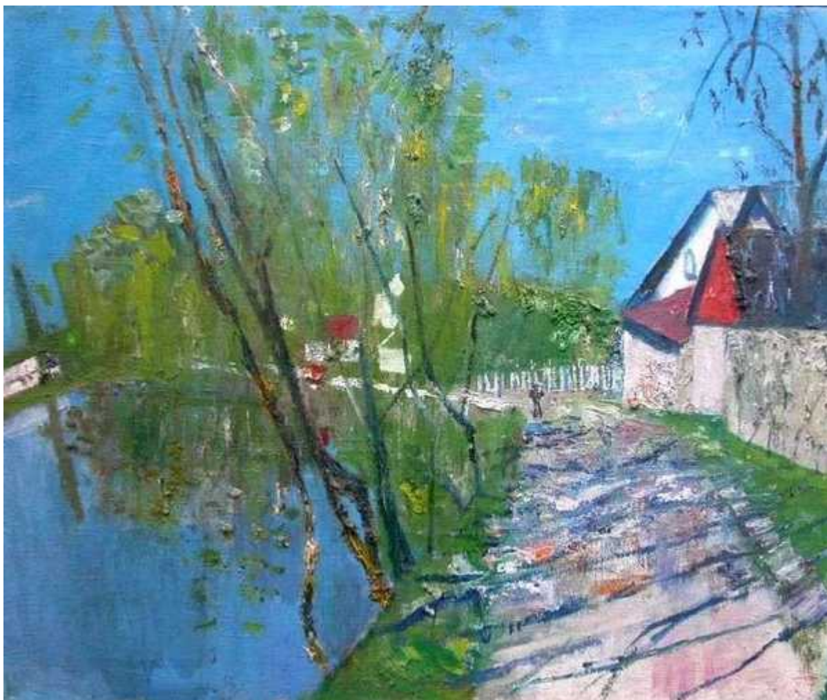
Первая зелень. 2002