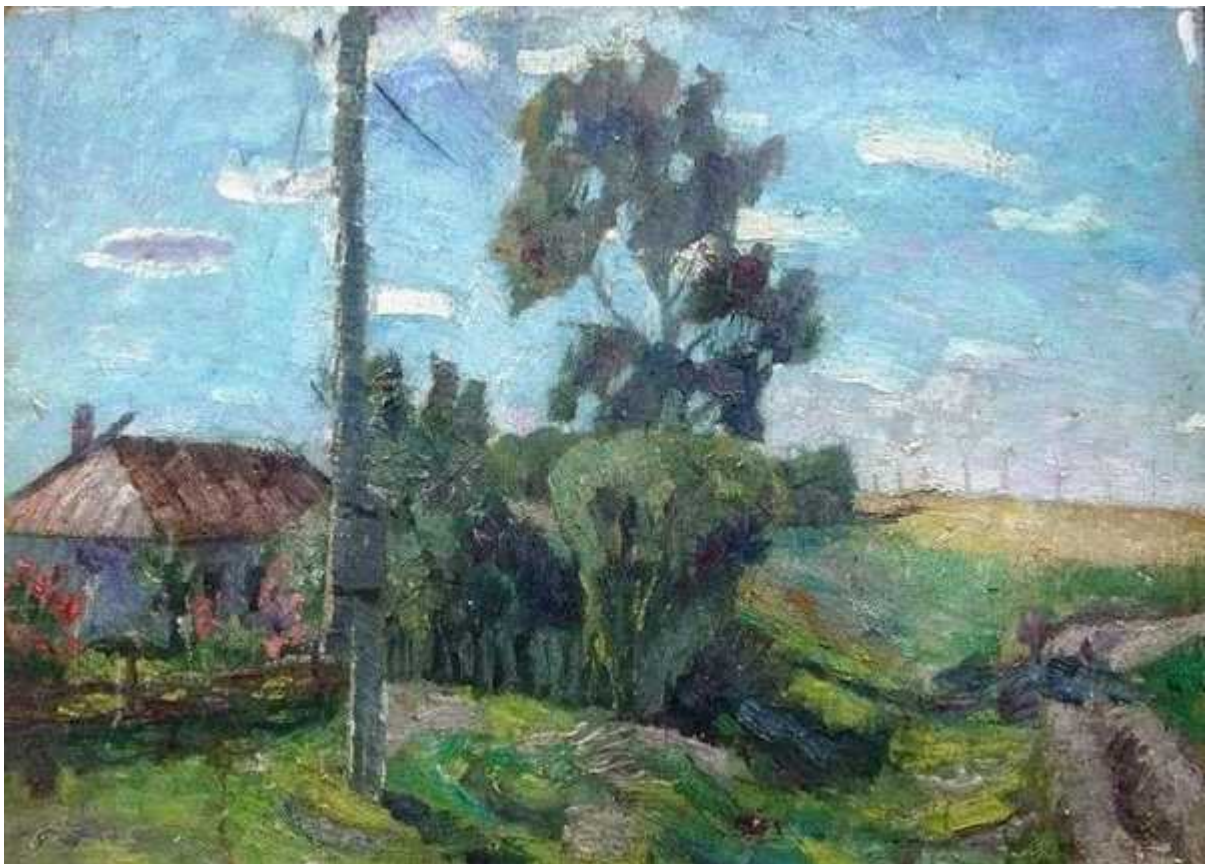
Дом детства. 1974

Продвинутые однокурсники меня называли сезаннистом, когда я ещё не знал Сезанна. Даже скорее это был не сезаннизм, а отрицание бесструктурной мазистой живописи. Так и писал с оглядкой на Сезанна, пока не зашёл в тупик. Но хорошо, что осознал это. Я получил новые ощущения в новой ситуации от пленэрного натюрморта, что помогло мне выбраться из тупика.