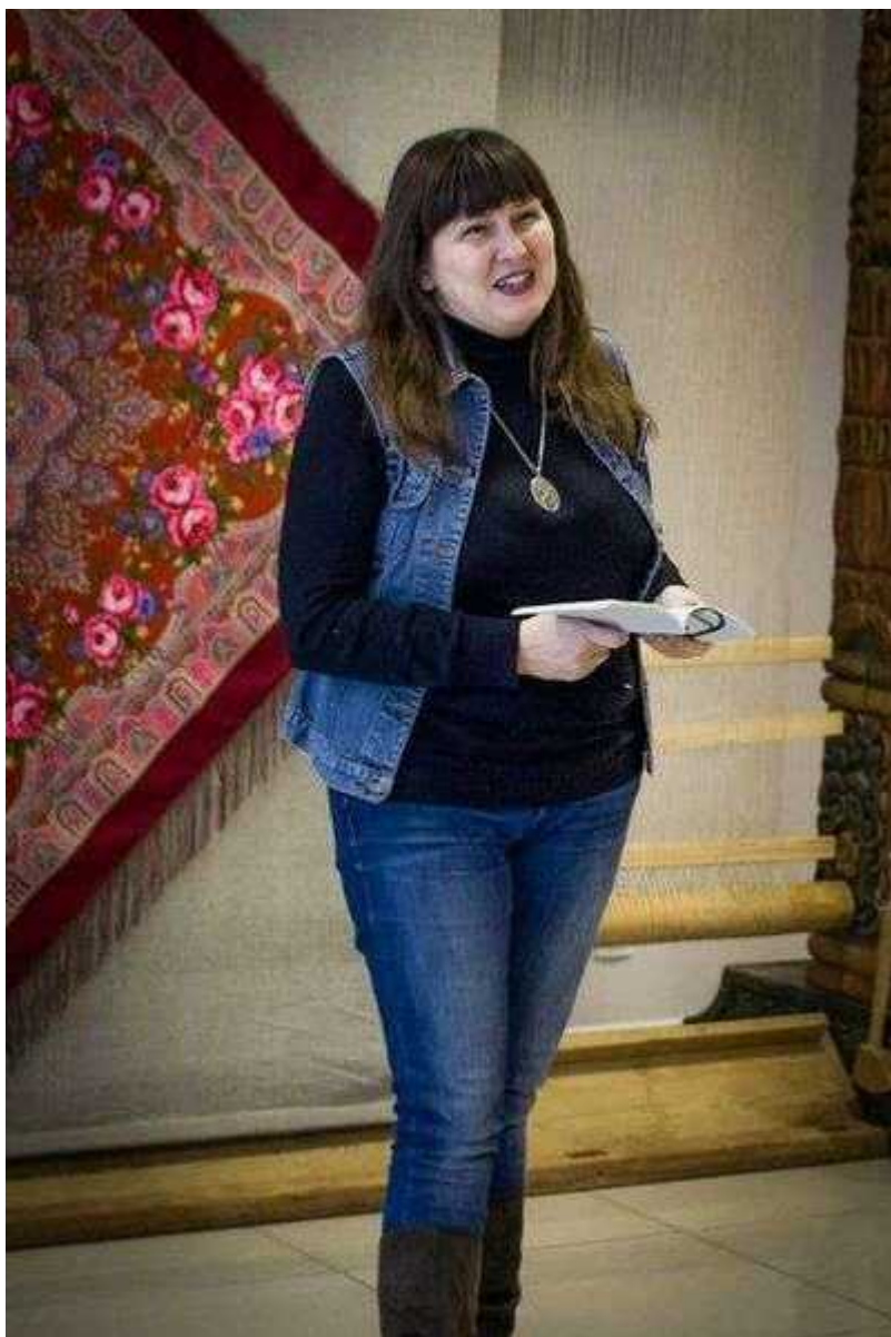
Фотография 3 из 11. Для просмотра галереи нажмите на фото.