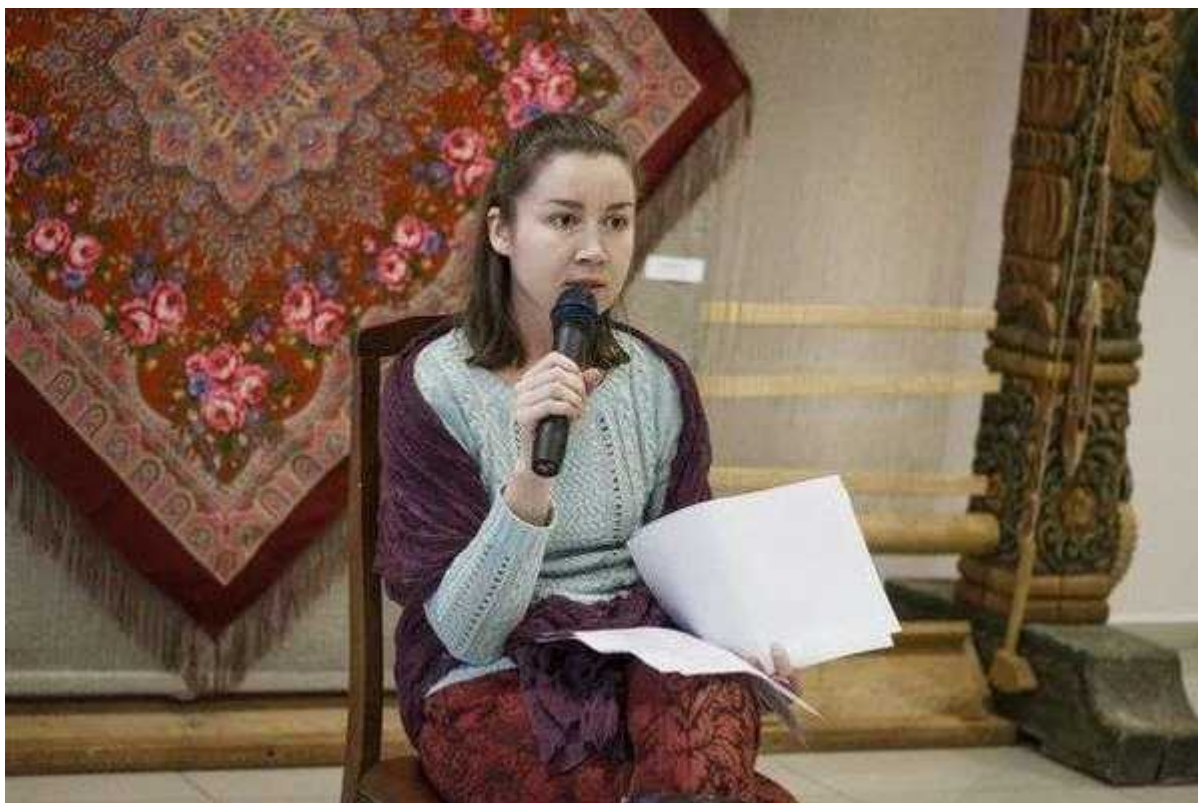
Фотография 10 из 11.