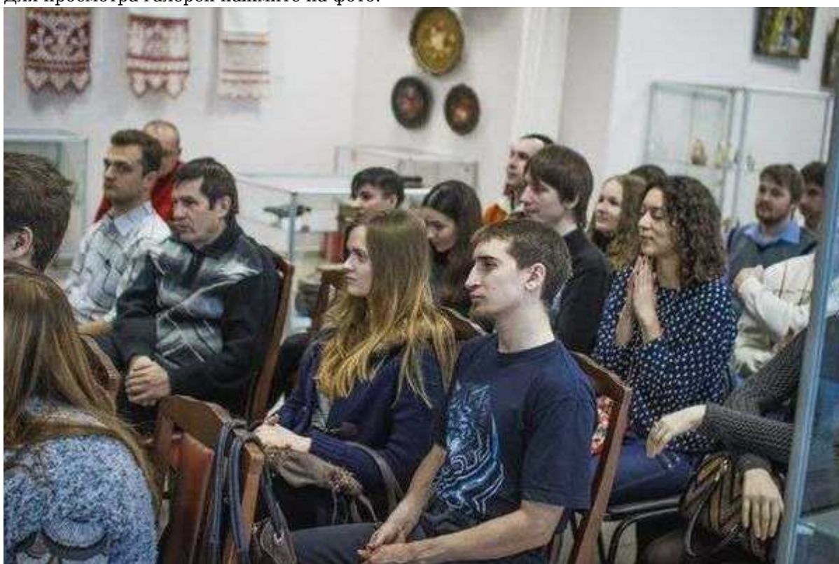
Фотография 7 из 11. Для просмотра галереи нажмите на фото.