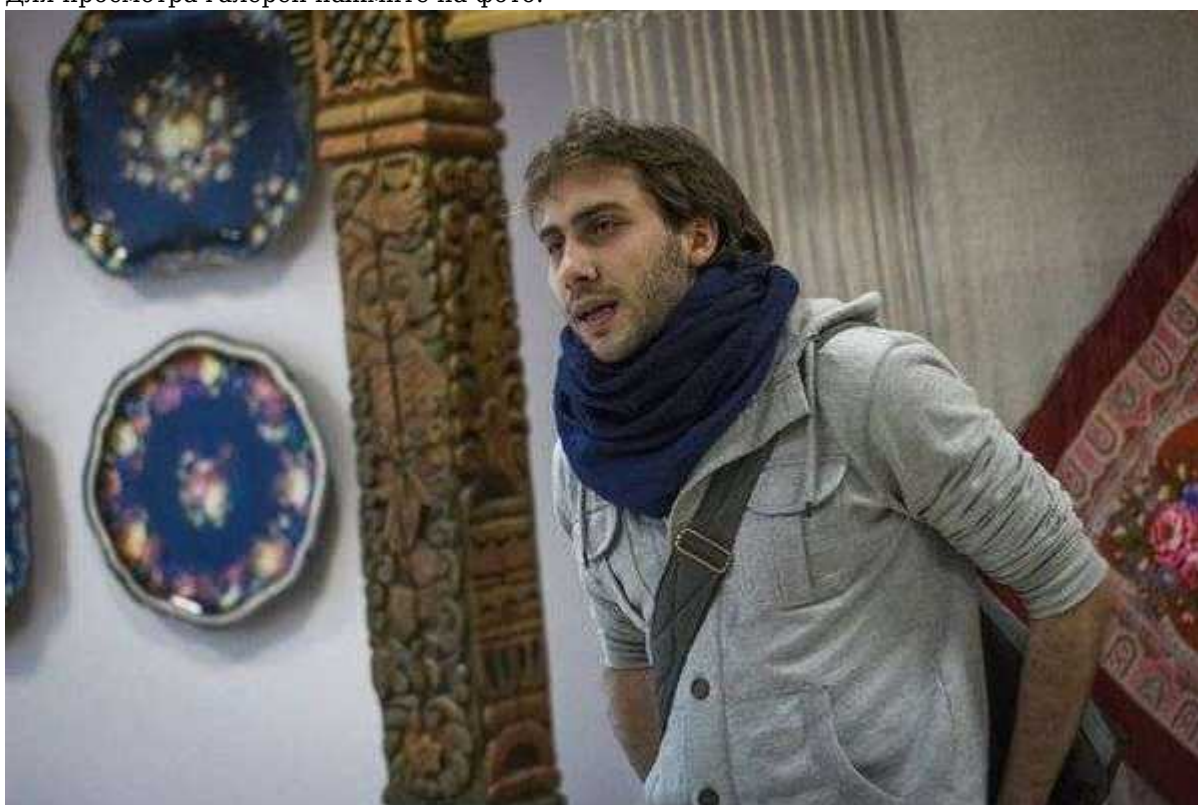
Фотография 11 из 11.