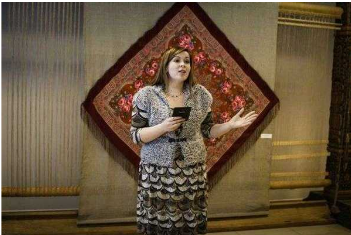
Фотография 8 из 11. Для просмотра галереи нажмите на фото.