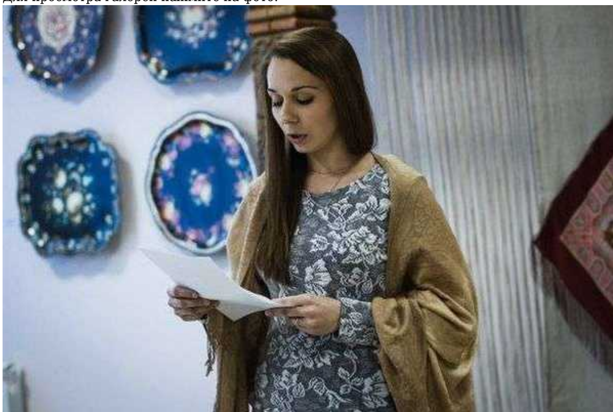
Фотография 9 из 11. Для просмотра галереи нажмите на фото.