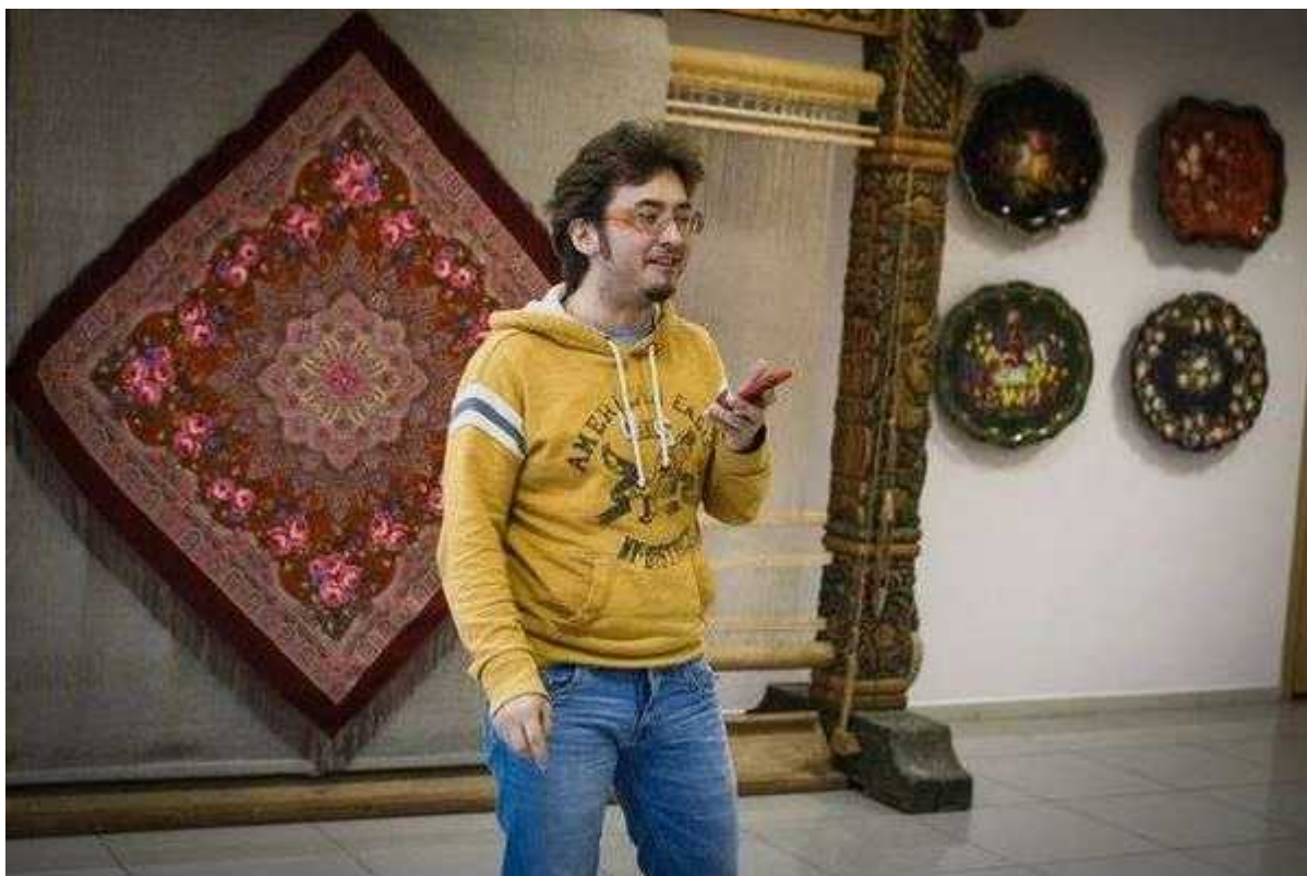
Фотография 6 из 11. Для просмотра галереи нажмите на фото.