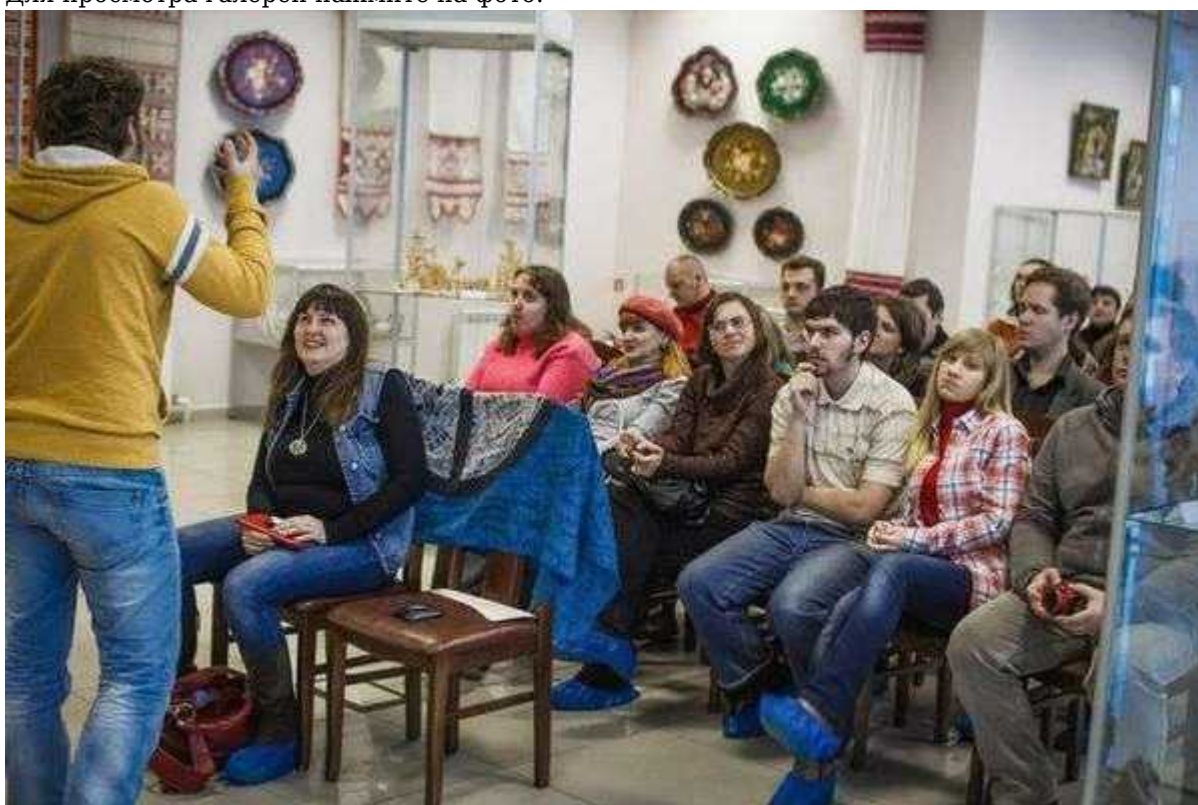
Фотография 5 из 11. Для просмотра галереи нажмите на фото.