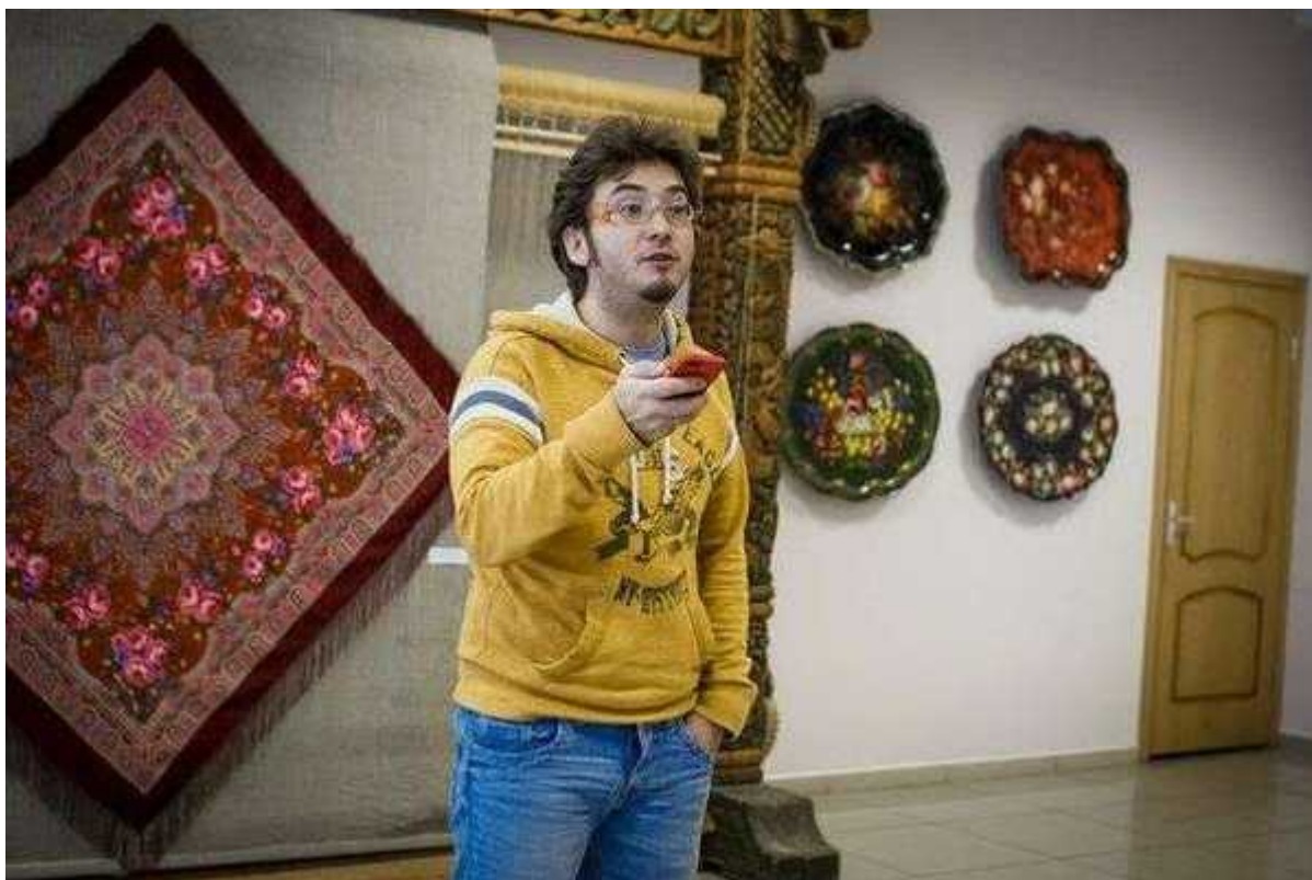
Фотография 4 из 11. Для просмотра галереи нажмите на фото.