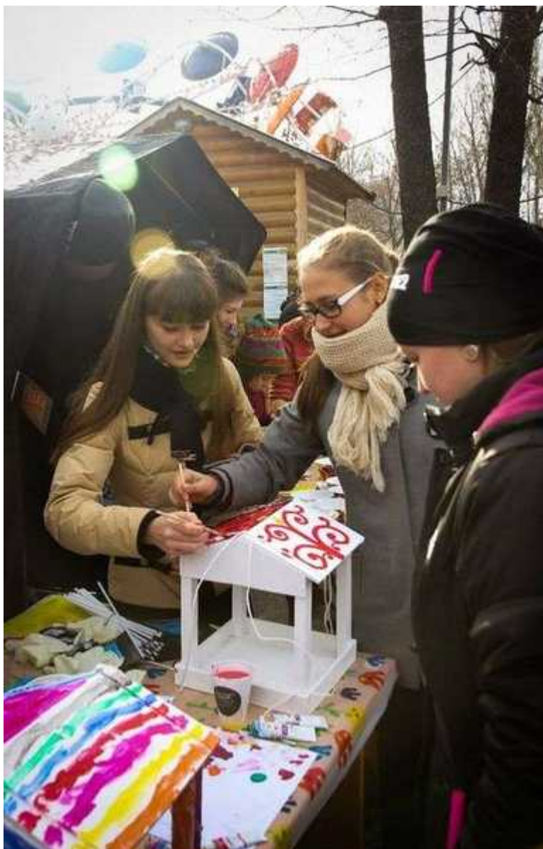
Фотография 5 из 11.