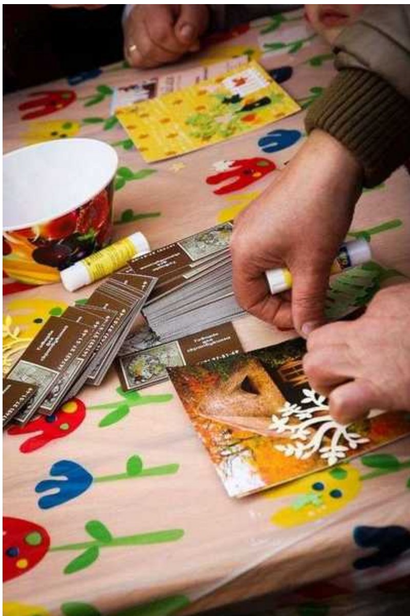
Фотография 4 из 11. Для просмотра галереи нажмите на фото.