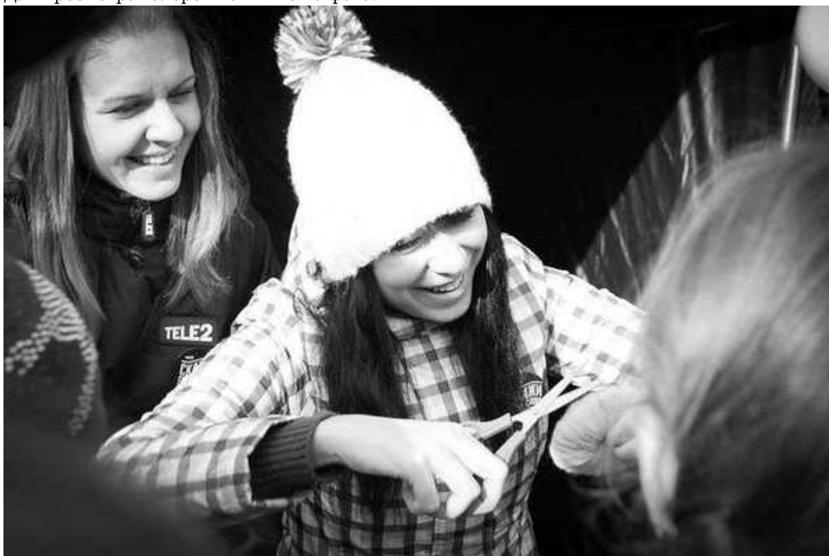
Фотография 3 из 11.