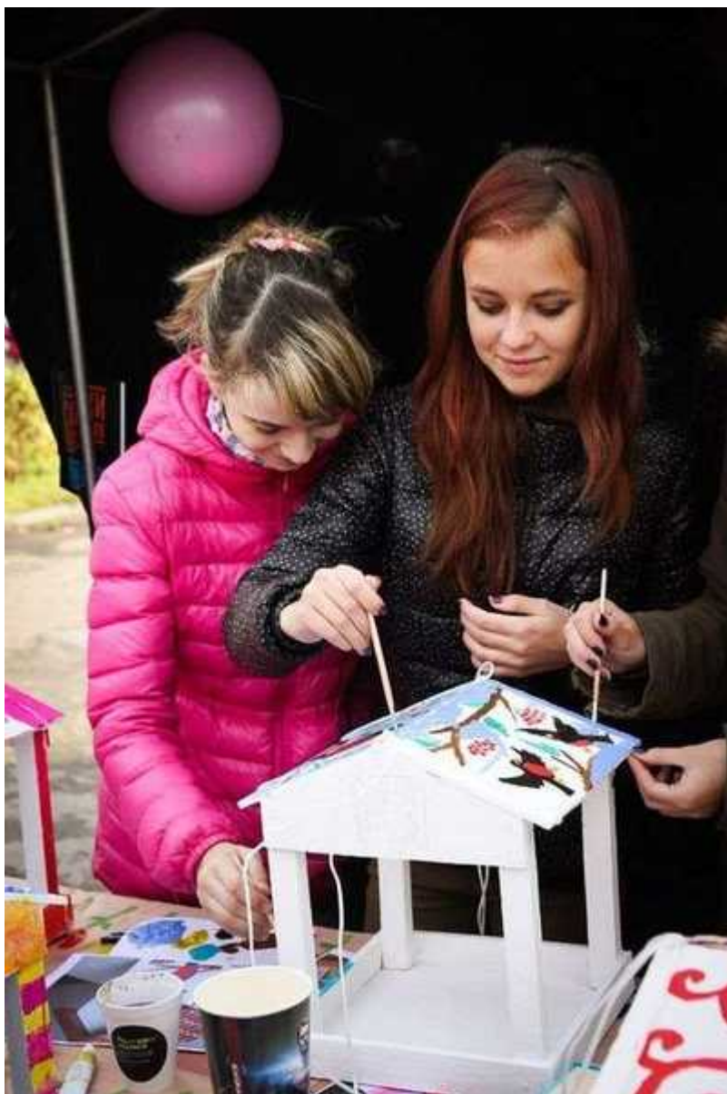
Фотография 6 из 11. Для просмотра галереи нажмите на фото.