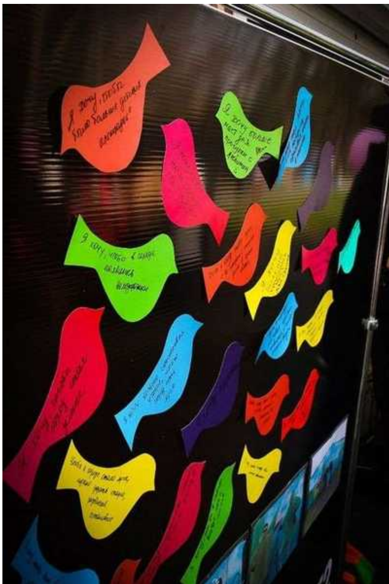
Фотография 7 из 11.