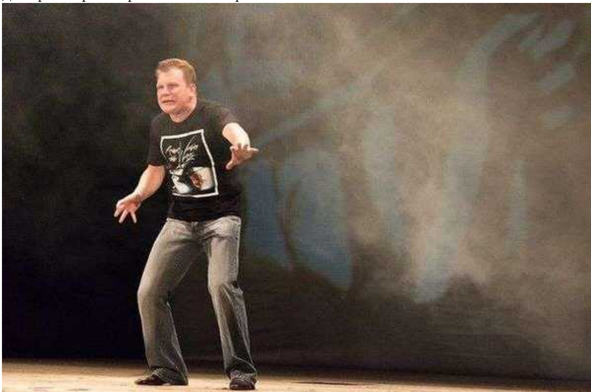
Фотография 2 из 5.