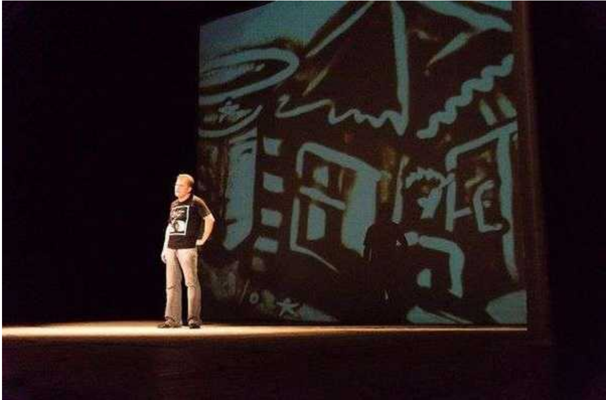
Фотография 3 из 5.