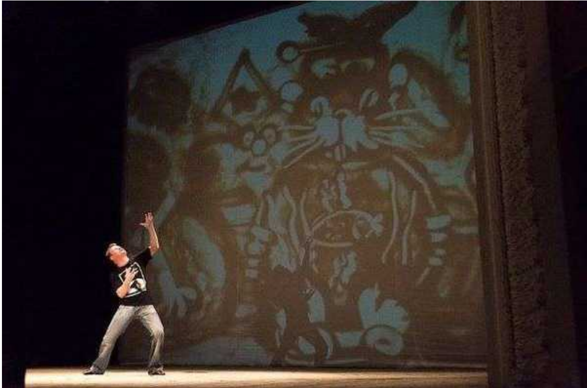
Фотография 1 из 5.