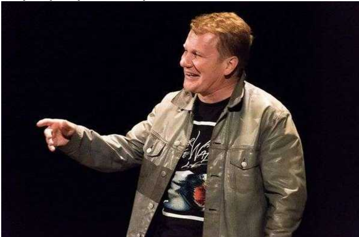
Фотография 4 из 5.