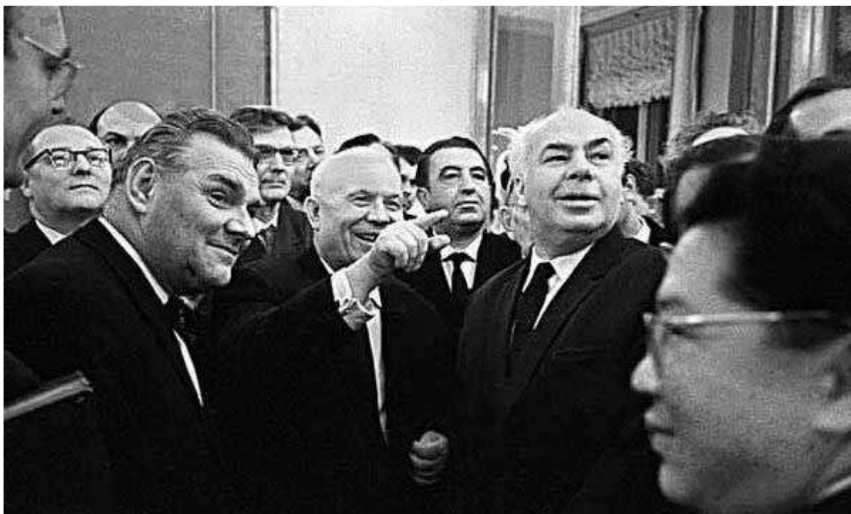
Хрущёв в Манеже

Так вот, к чему я всё это рассказываю. Эта Ленинская премия, вручённая Пикассо, по мнению Эренбурга и других деятелей искусства, могла бы хоть как-то облегчить нелёгкую жизнь советских авангардистов. Но Пикассо как назло отказывался от неё и только после долгих уговоров, когда к нему во Францию приехал Эренбург, объяснив всю ситуацию, художник согласился помочь. А так как обстановка при вручении премии была неформальной (кухня художника), то и место её расположения была нетрадиционной (зад художника).