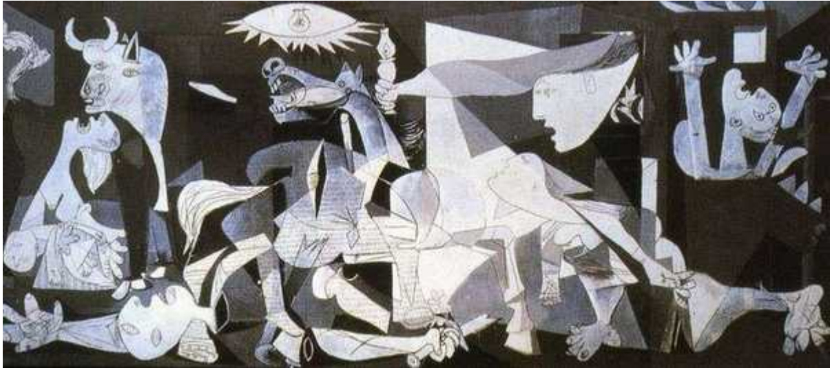
Пабло Пикассо, Герника