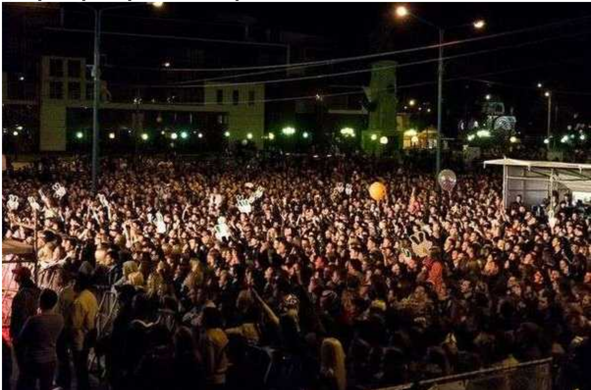
Фотография 3 из 19.