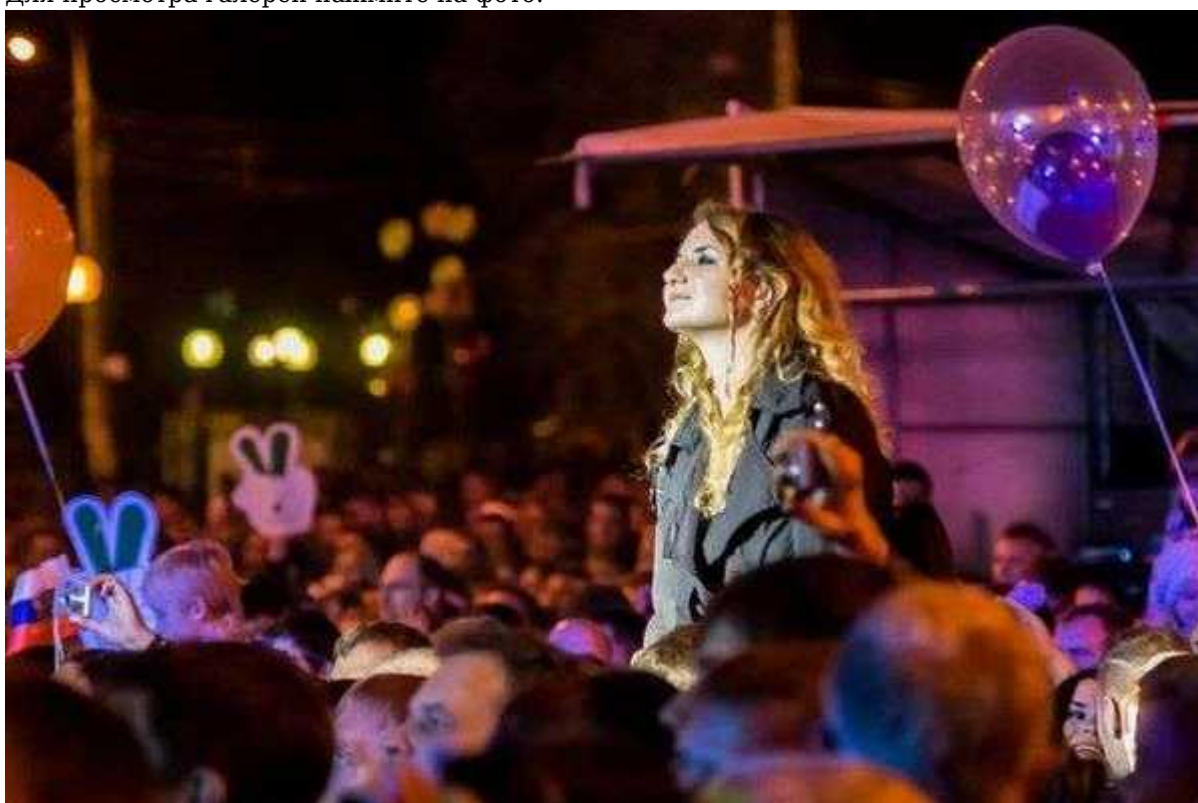
Фотография 16 из 19.