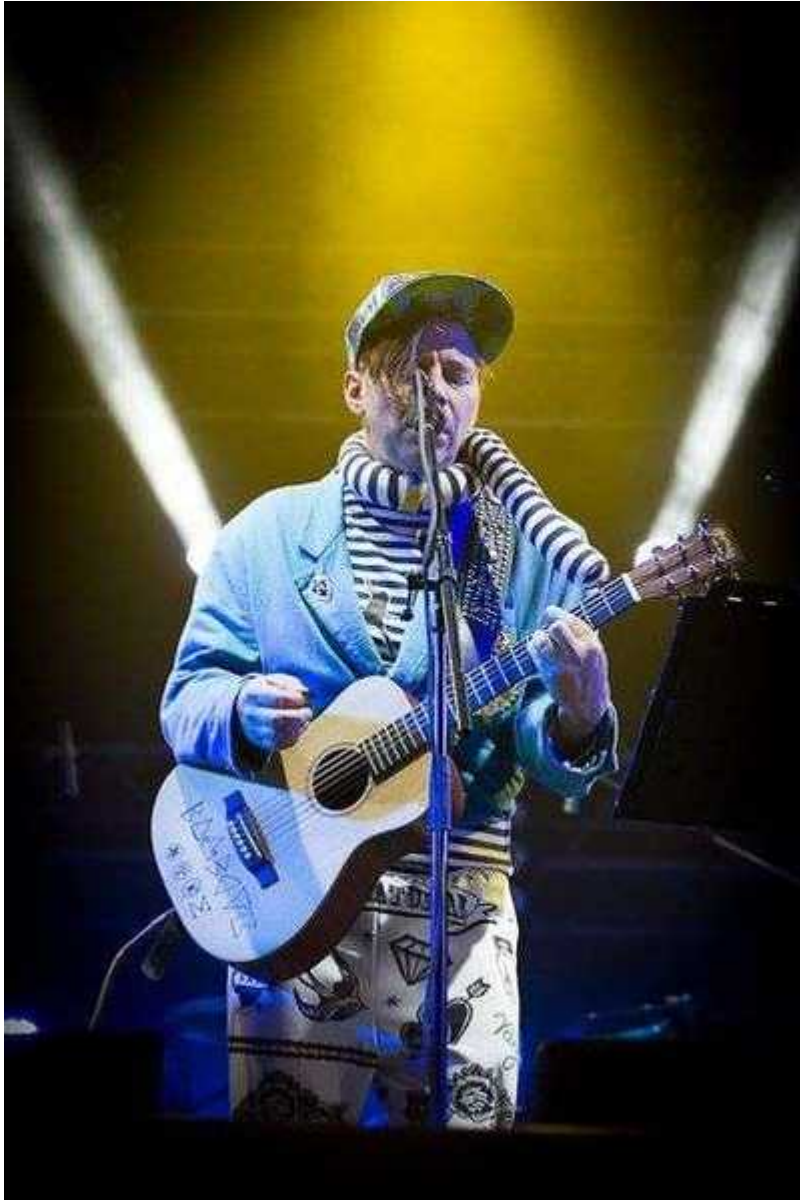
Фотография 13 из 19. Для просмотра галереи нажмите на фото.