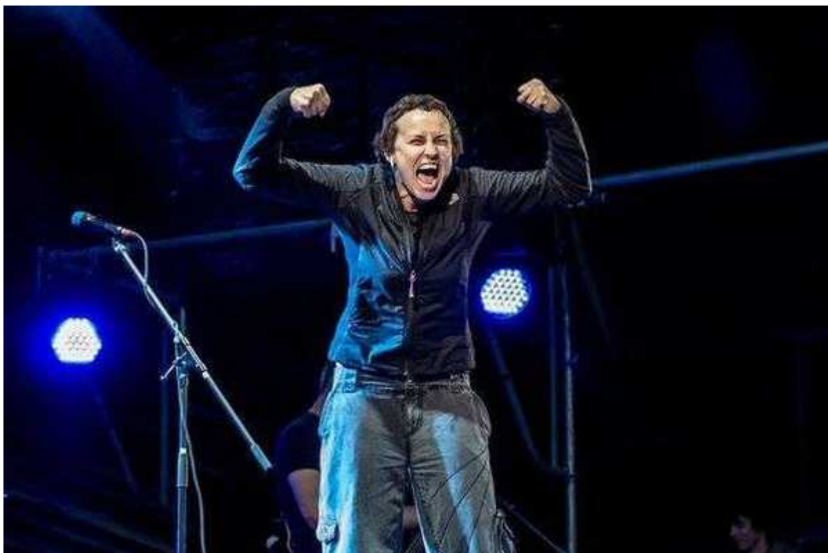
Фотография 6 из 7.