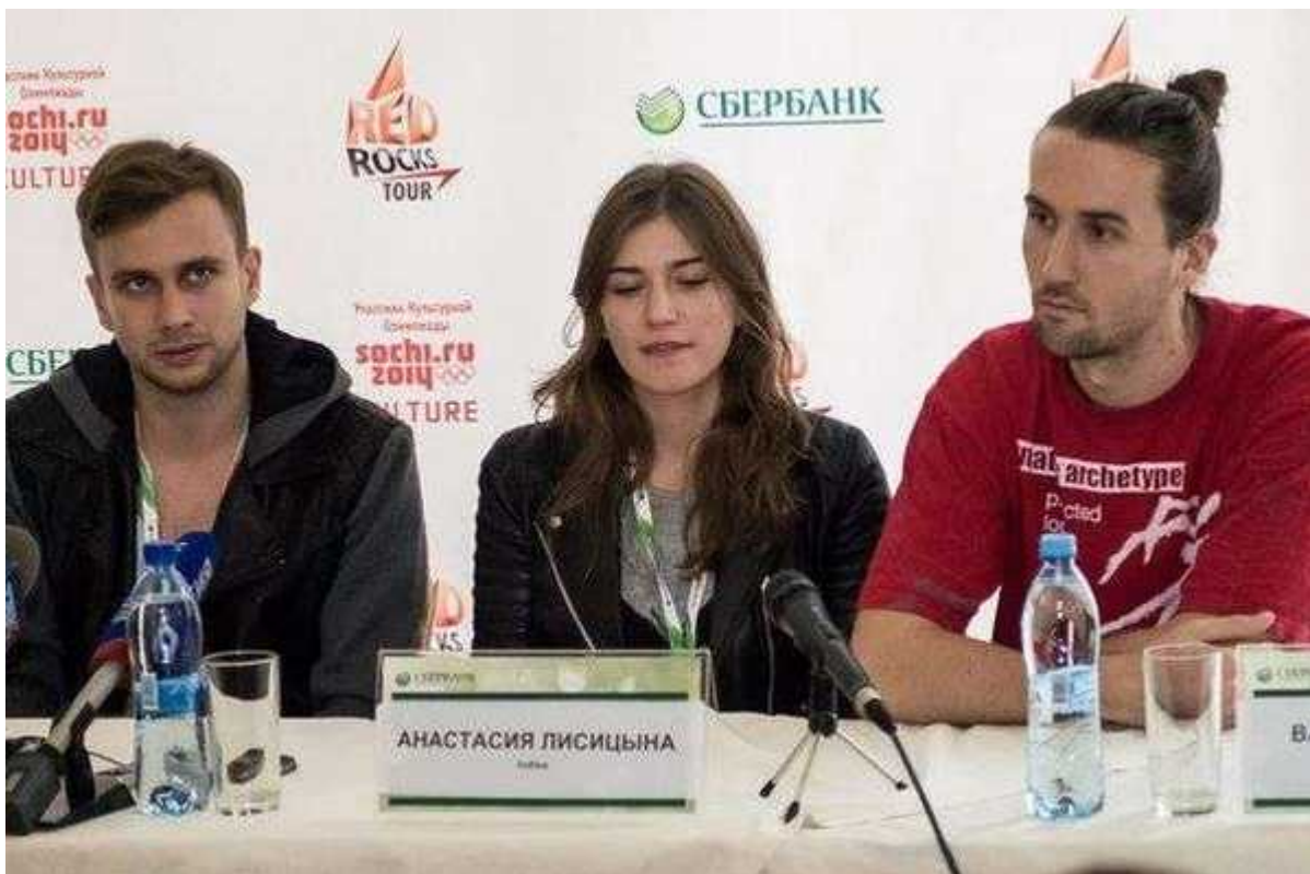
Фотография 3 из 4.