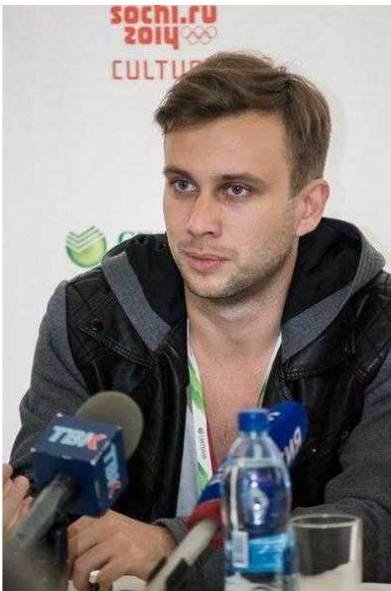
Фотография 2 из 4. Для просмотра галереи нажмите на фото.