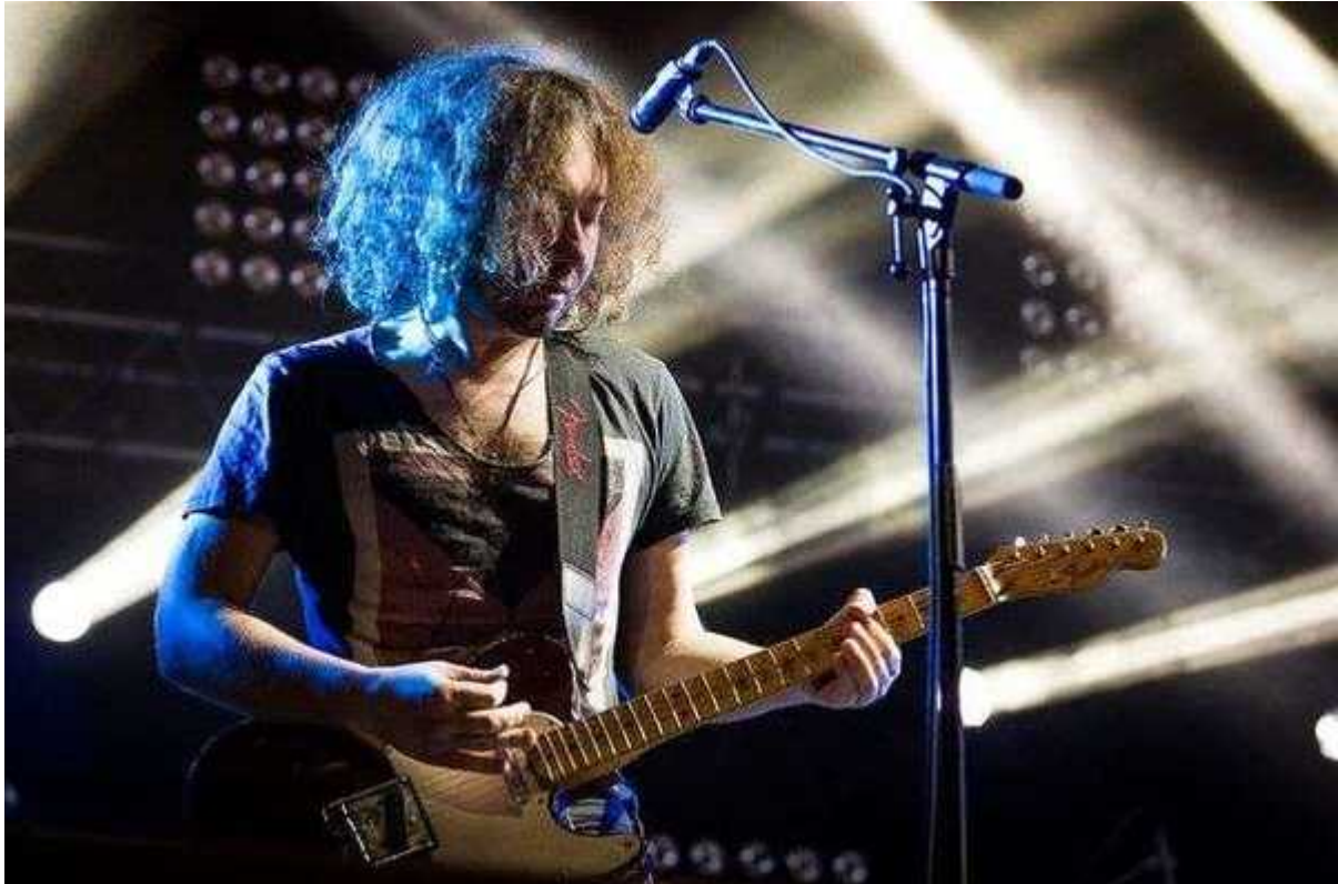
Фотография 8 из 19. Для просмотра галереи нажмите на фото.