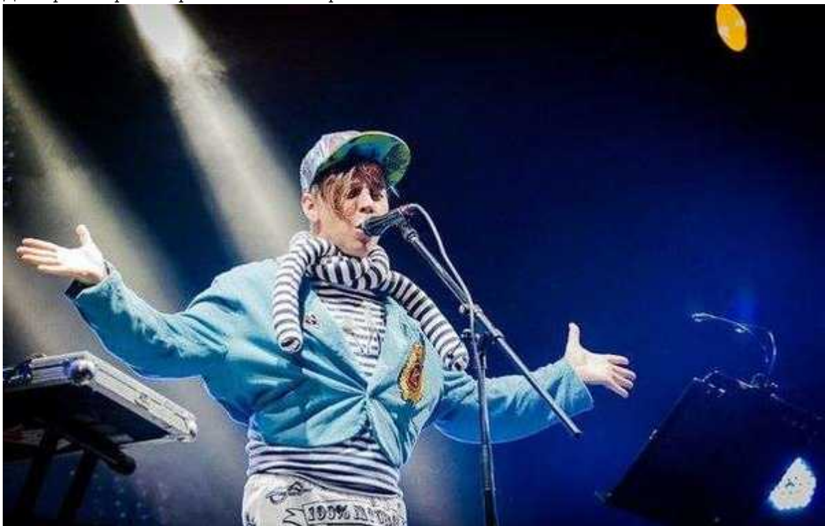
Фотография 9 из 19. Для просмотра галереи нажмите на фото.