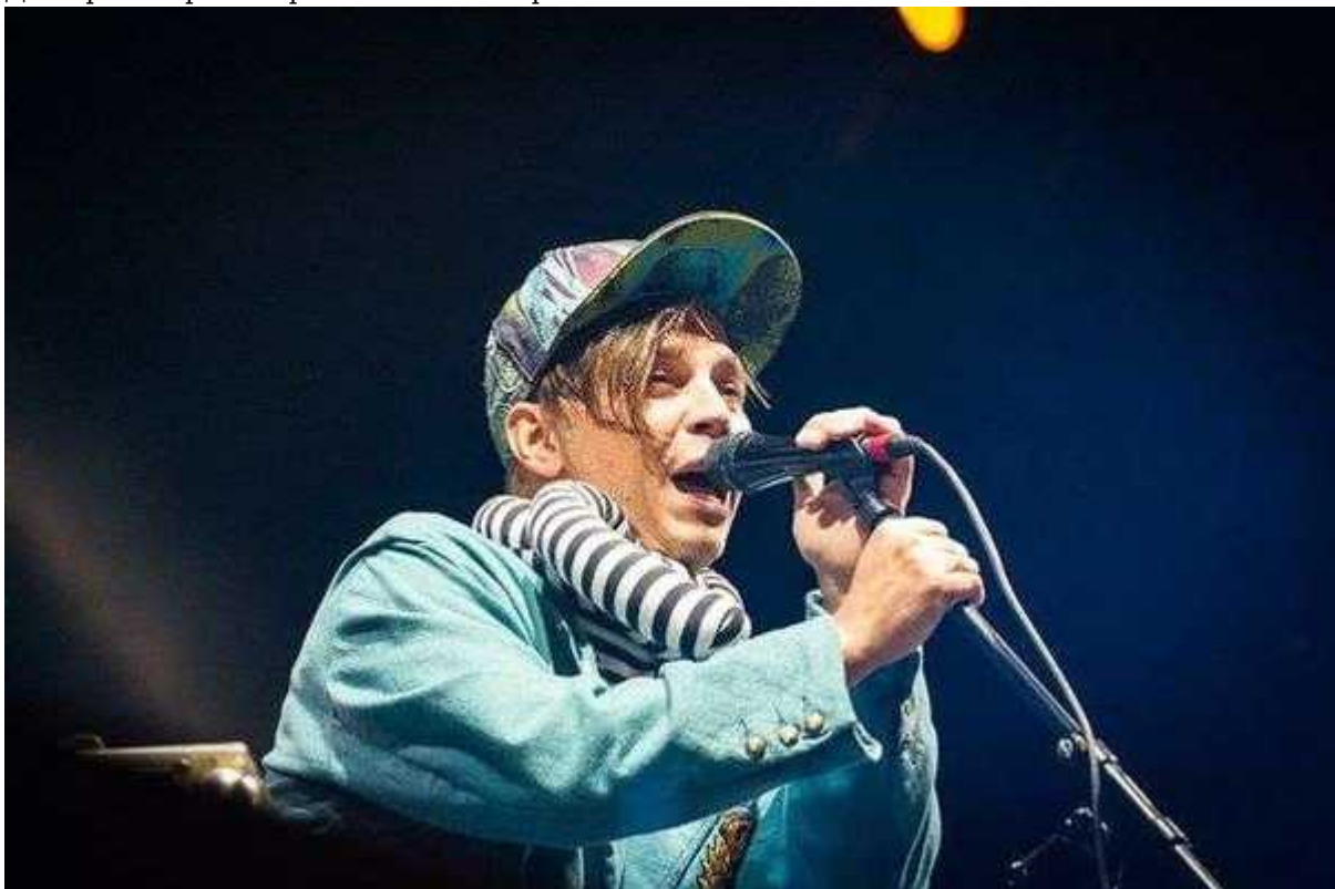
Фотография 7 из 19.