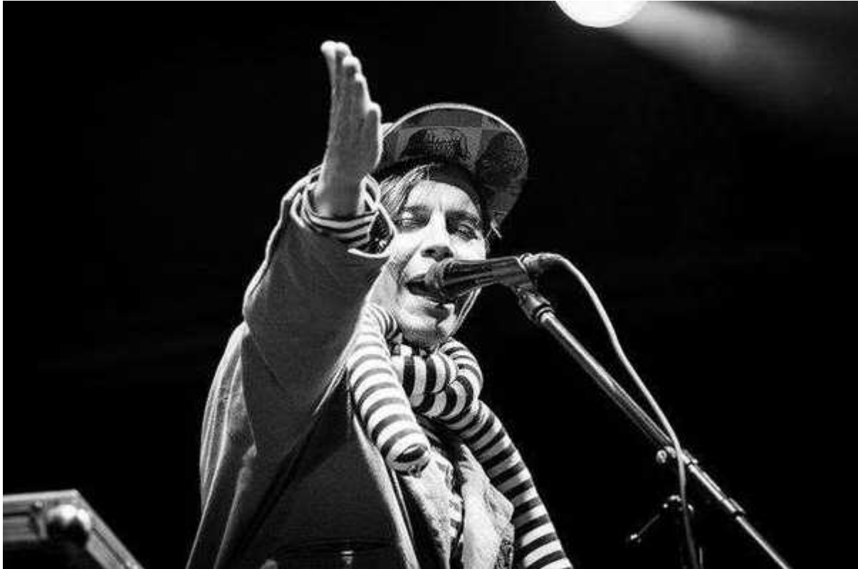
Фотография 6 из 19.