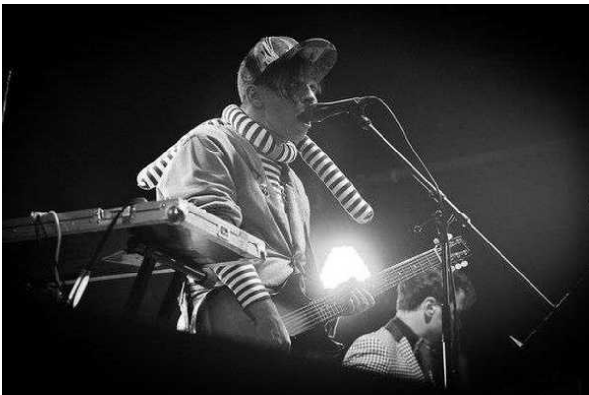
Фотография 15 из 19.