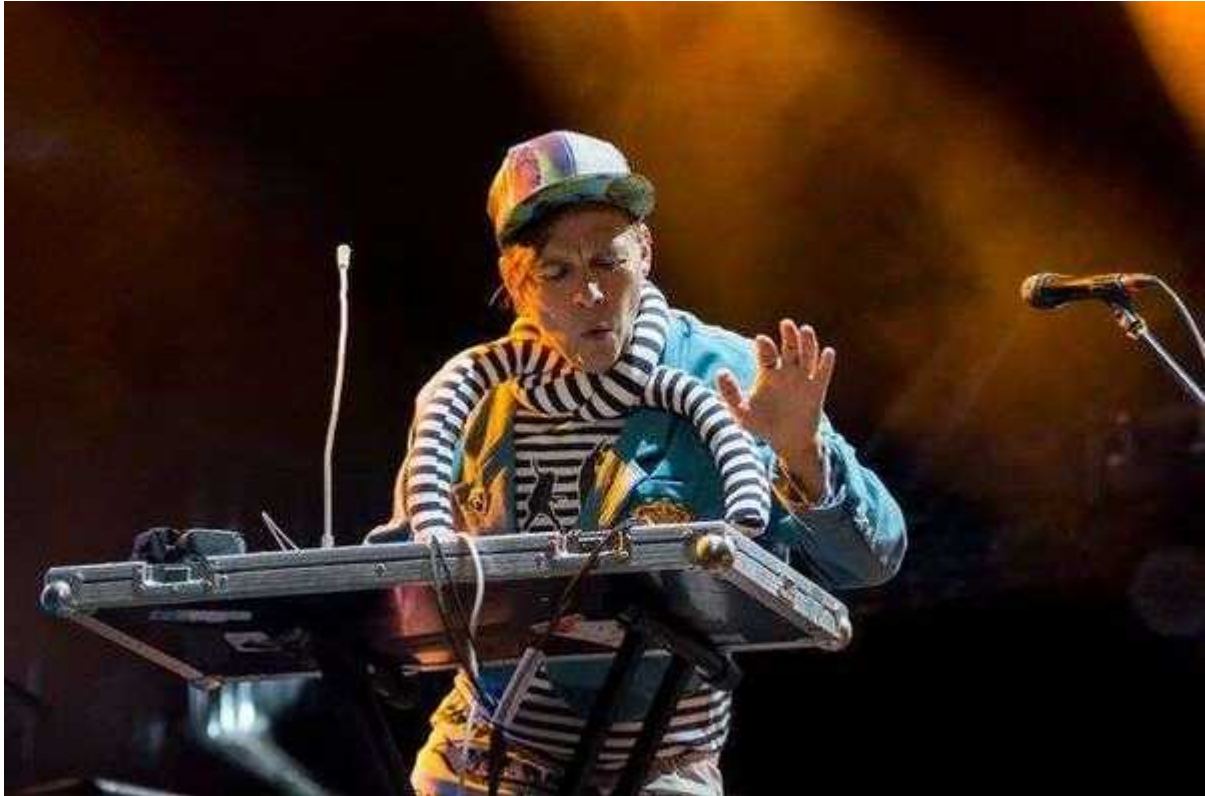
Фотография 2 из 19.