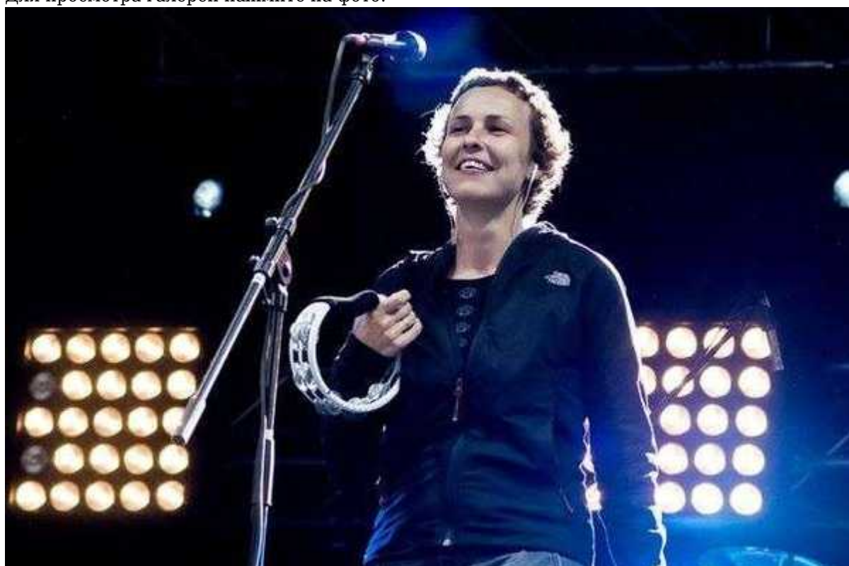
Фотография 3 из 7. Для просмотра галереи нажмите на фото.