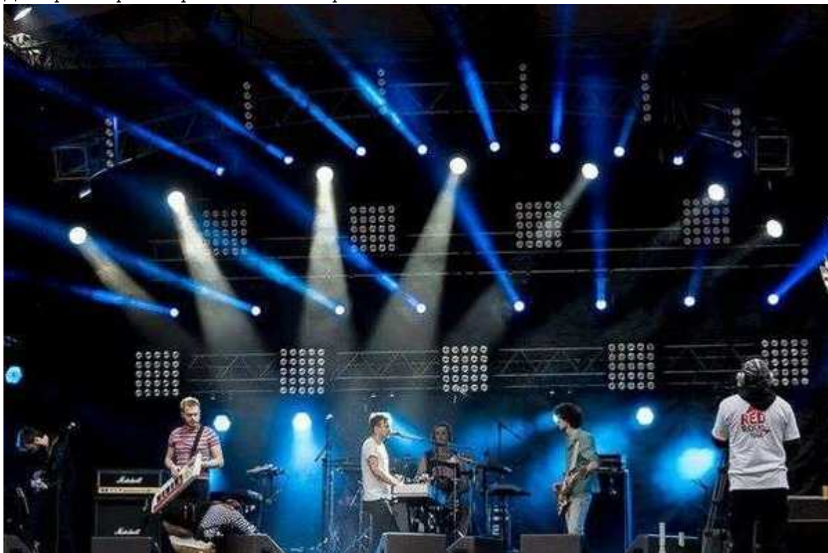
Фотография 4 из 4.