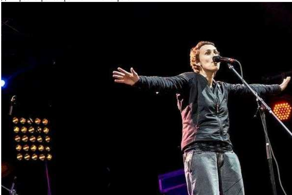
Фотография 7 из 7.