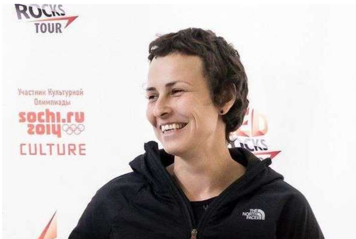
Фотография 2 из 7. Для просмотра галереи нажмите на фото.