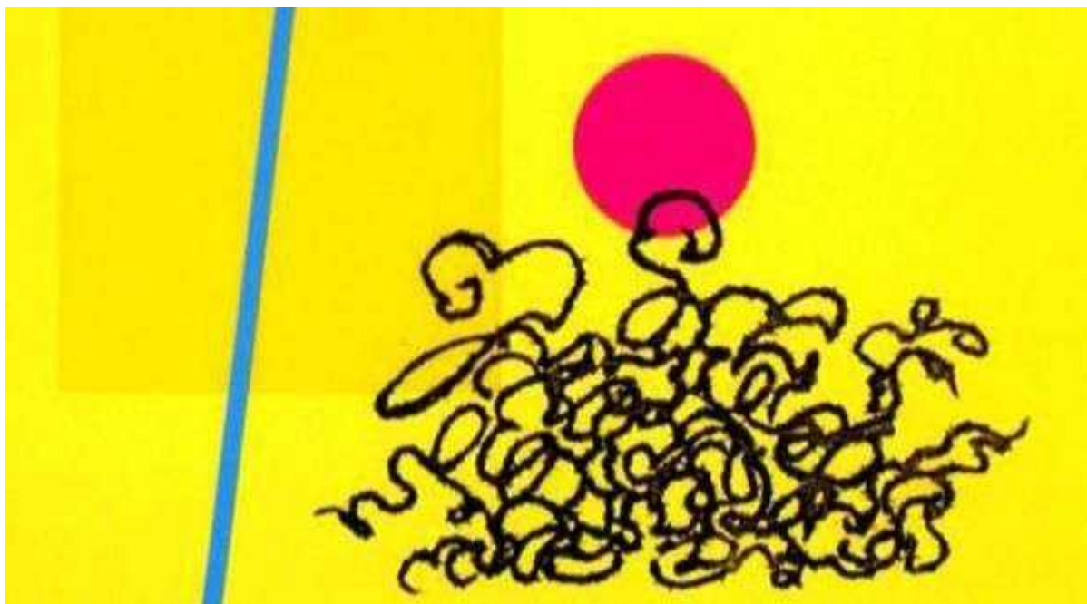
«The Dot and the Line»

Несмотря на то, что разница между анимационными фильмами Норштейна и Джонса огромна, объединяющий момент всё-таки существует – данные мультики желательно смотреть уже во взрослом возрасте. Норштейновские — потому что только с годами понимаешь всю глубину этих произведений, а Джонсовские — чтобы не сильно задеть психику в юности.