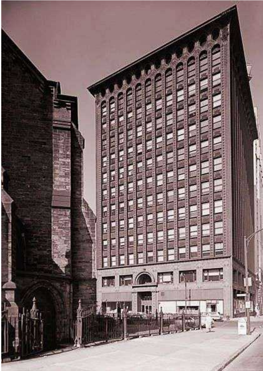
Фотография 1 из 4. Для просмотра галереи нажмите на фото.