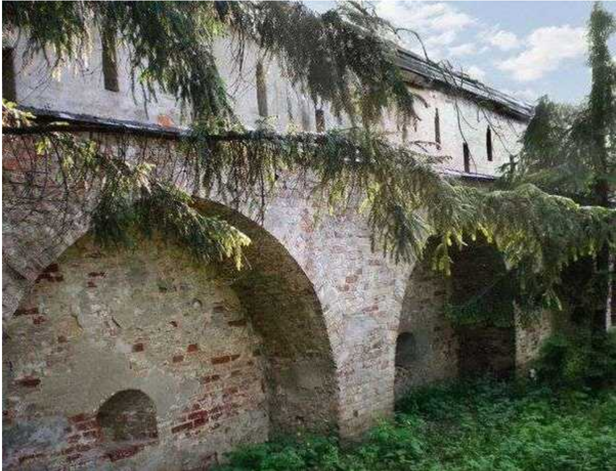
Стена Свято-Троицкого монастыря

В стенах его веет спокойствием и прохладой, здесь уютно и чисто.