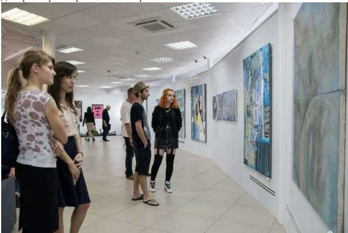
Фотография 4 из 6. Для просмотра галереи нажмите на фото.