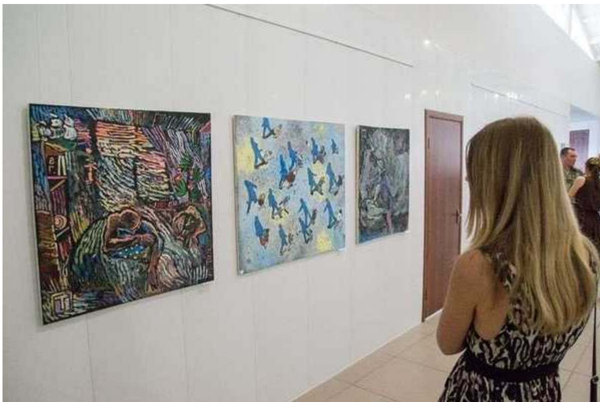
Фотография 5 из 6. Для просмотра галереи нажмите на фото.