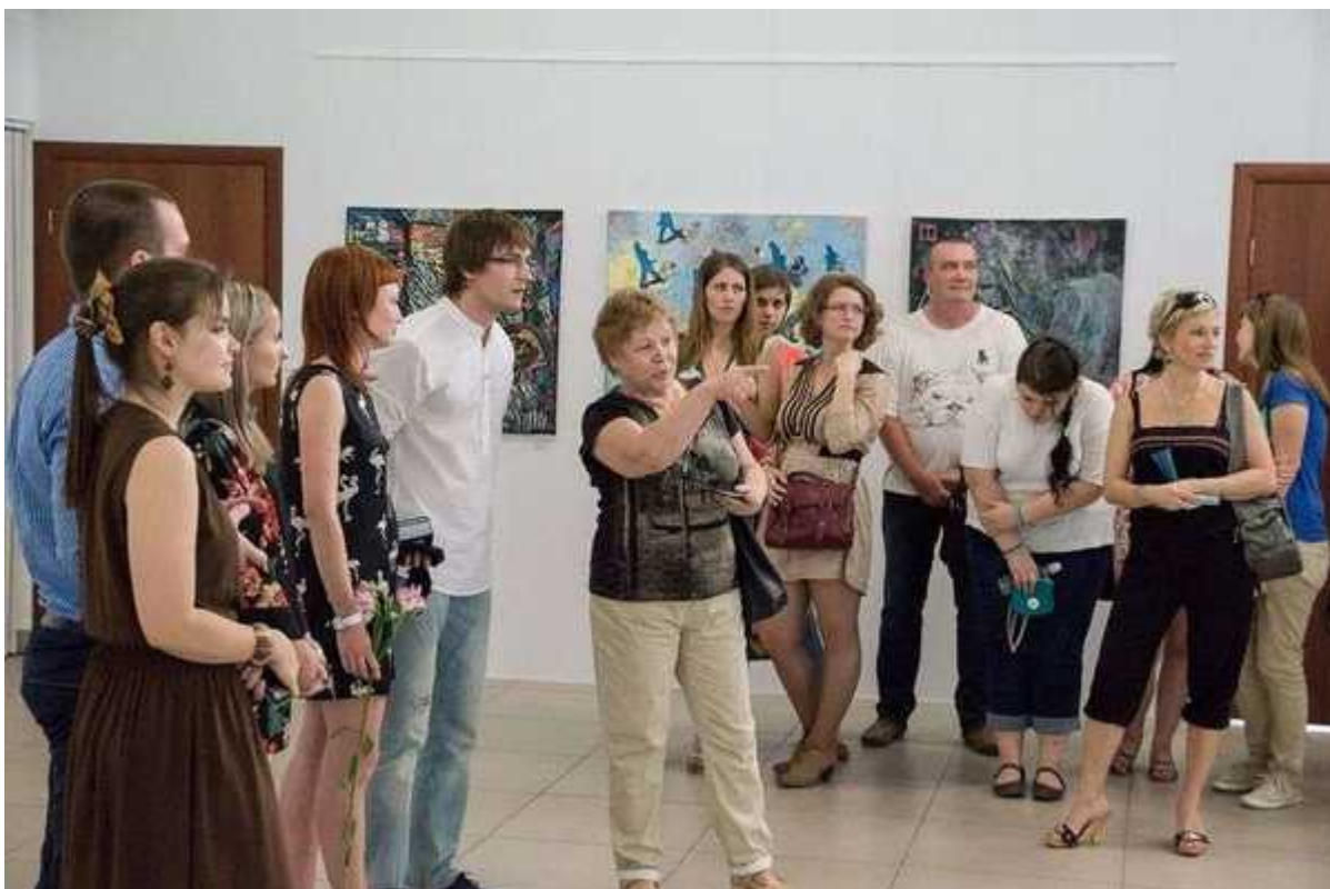
Фотография 3 из 6. Для просмотра галереи нажмите на фото.