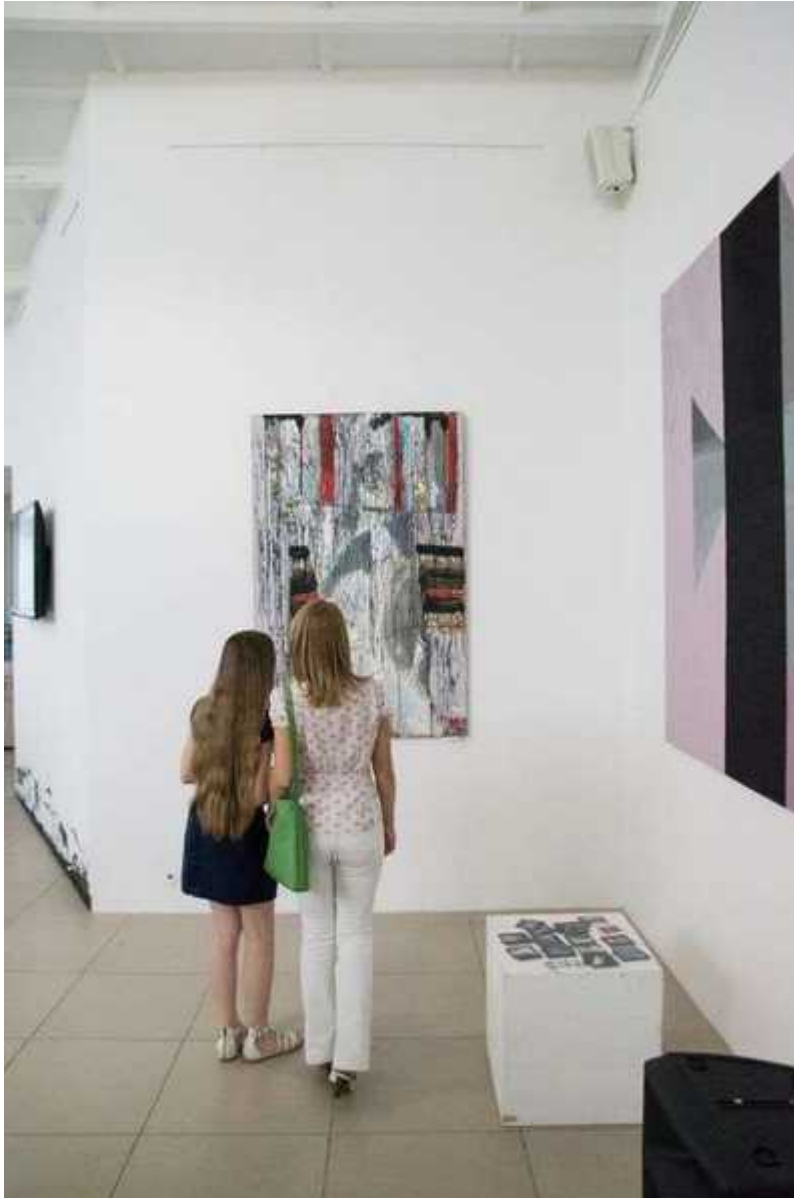
Фотография 2 из 6. Для просмотра галереи нажмите на фото.