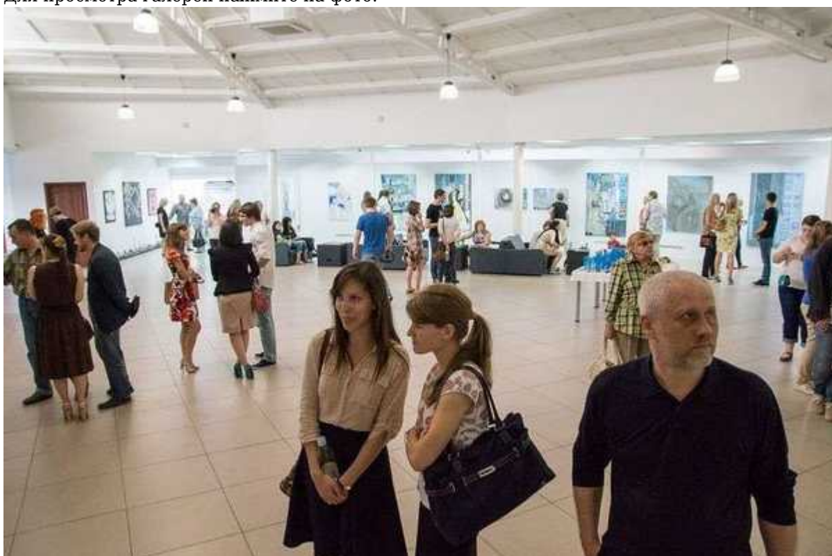
Фотография 6 из 6. Для просмотра галереи нажмите на фото.

Атмосфера напомнила выставки 80-х годов, скажем, в Ленинграде. «Нонконформизм», «авангард» и другие щекочущие нёбо слова. Тогда тоже старались сделать всё максимально