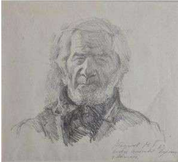
М.Г.Абакумов. Народный художник России В.С.Сорокин. 1989

Сорокин был довольно закрытым человеком, и, видимо, поэтому не всем портретистам удалось “прочитать” его. Наверное, лучшие портреты Мастера принадлежат кисти самого Виктора Семёновича, и на выставке есть один его автопортрет.