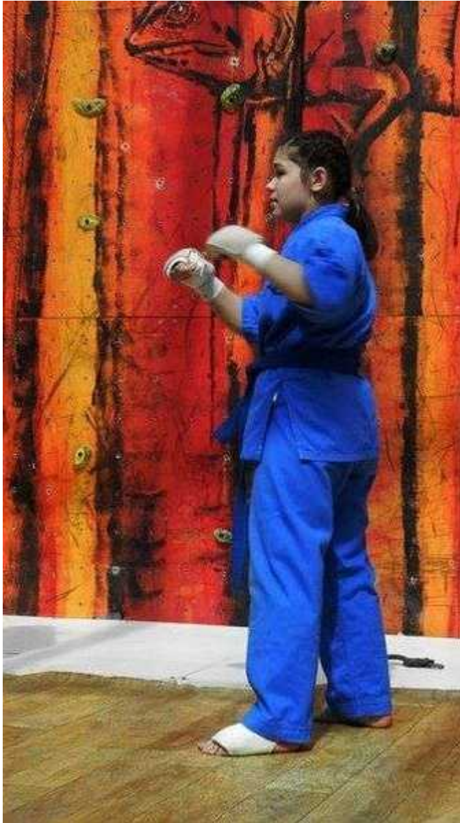
Фотография 7 из 7.