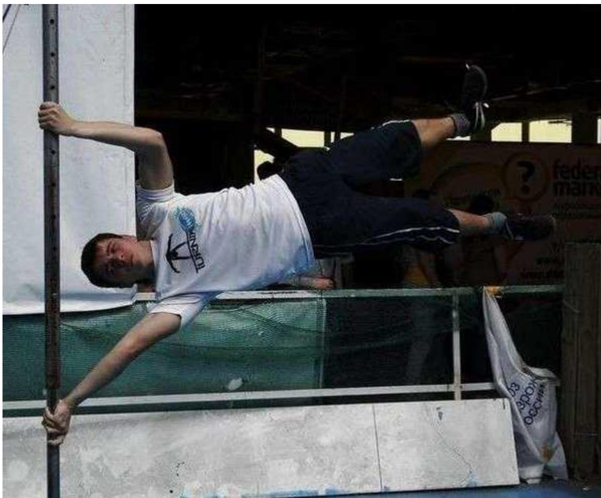
Фотография 5 из 7. Для просмотра галереи нажмите на фото.