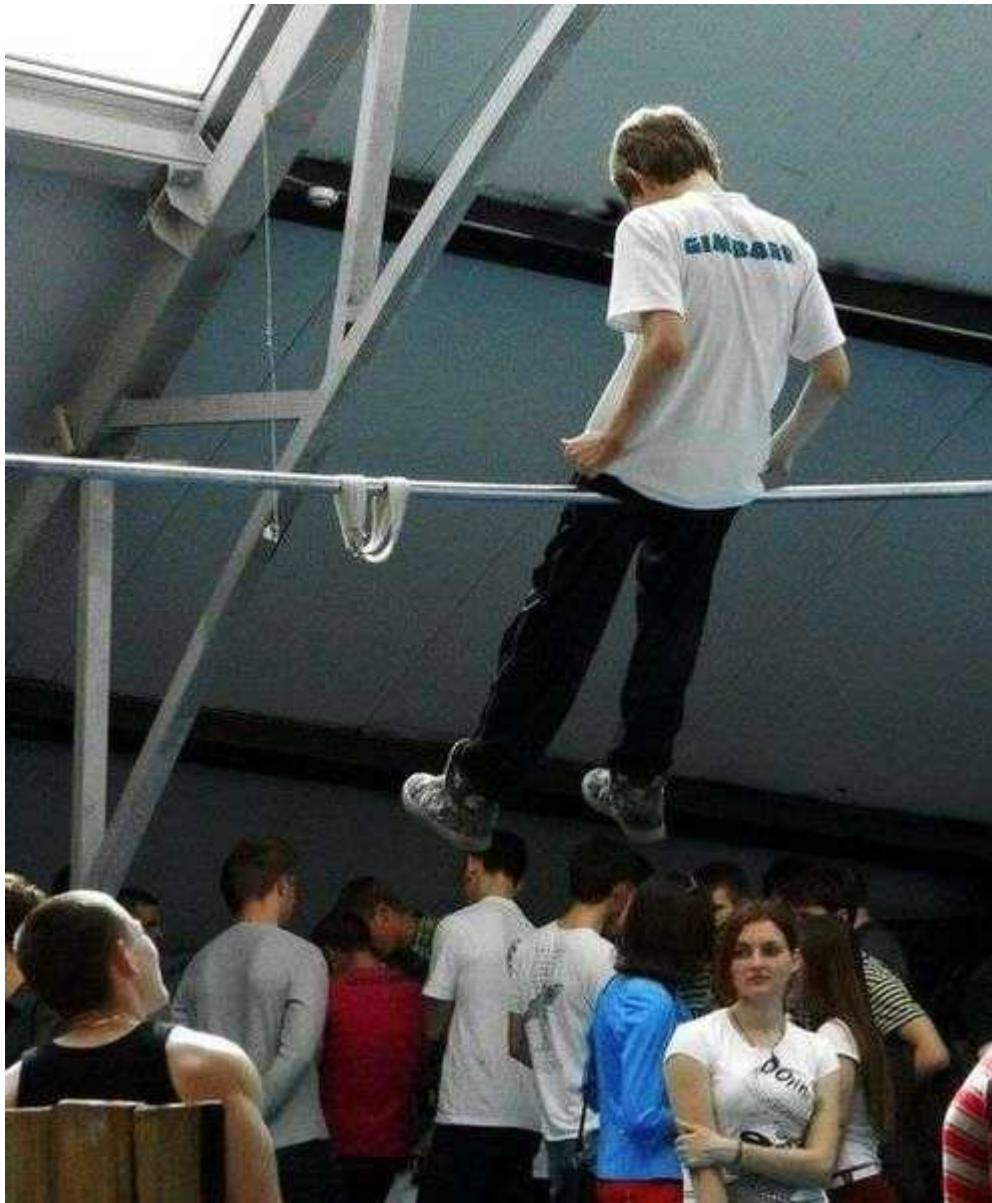
Фотография 3 из 7. Для просмотра галереи нажмите на фото.