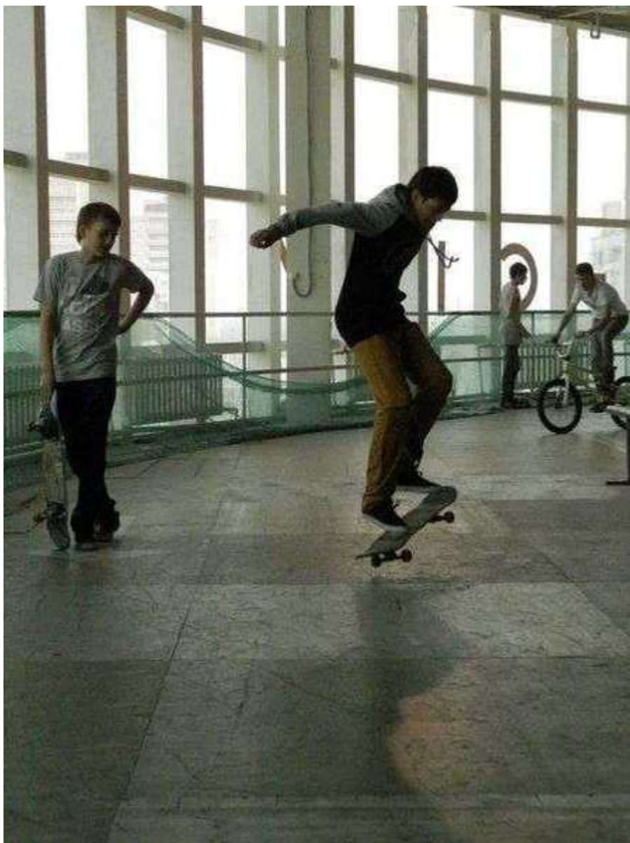
Фотография 2 из 7. Для просмотра галереи нажмите на фото.