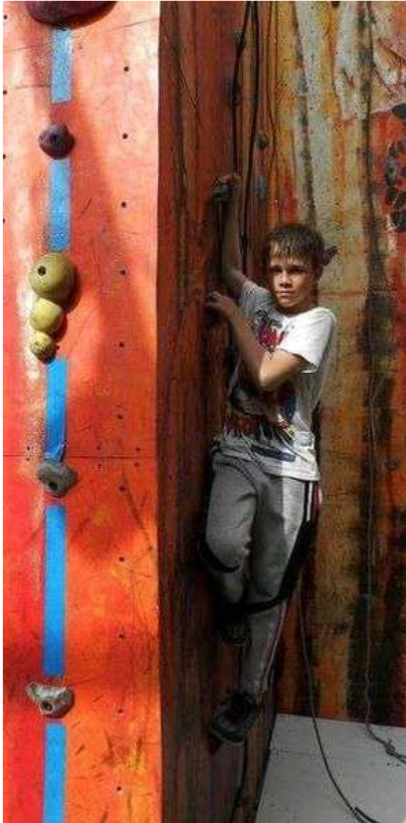
Фотография 6 из 7. Для просмотра галереи нажмите на фото.