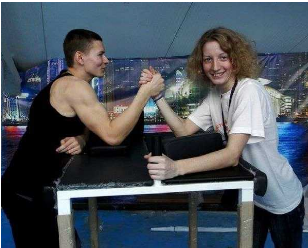
Фотография 4 из 7. Для просмотра галереи нажмите на фото.