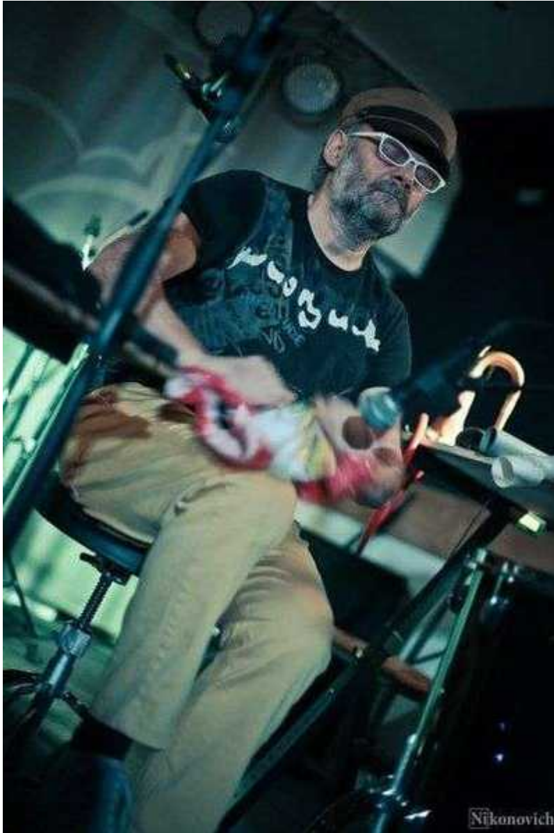
Фотография 2 из 5. Для просмотра галереи нажмите на фото.