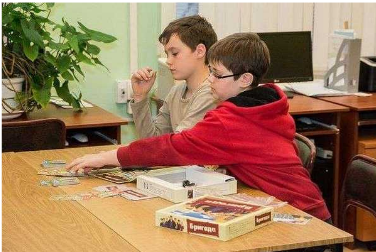
Фотография 3 из 9. Для просмотра галереи нажмите на фото.