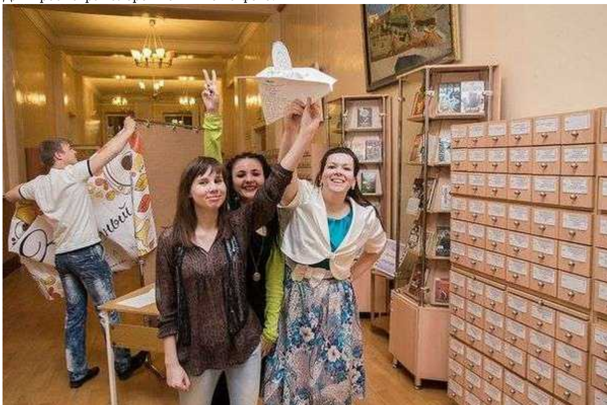
Фотография 8 из 9.