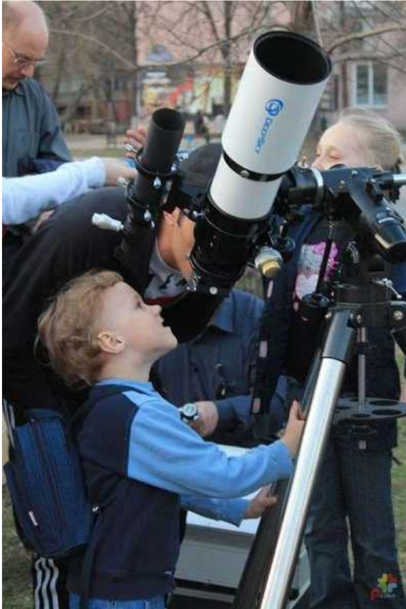
Фотография 3 из 6. Для просмотра галереи нажмите на фото.