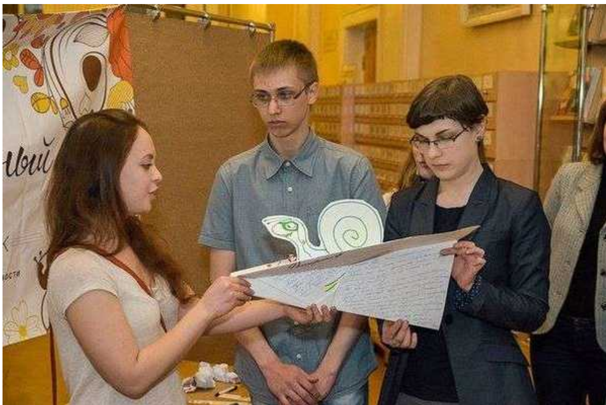
Фотография 7 из 9.