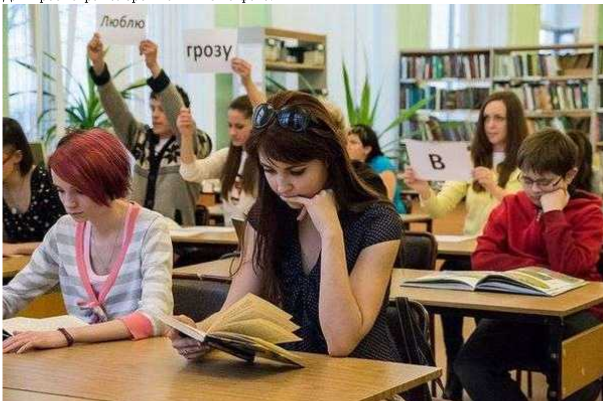
Фотография 2 из 9.