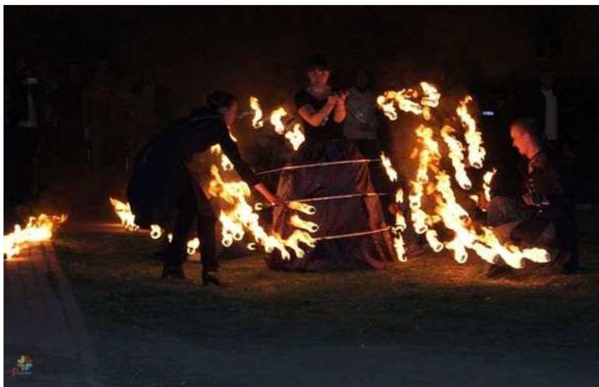
Фотография 1 из 6.

— Ночь удалась! — комментируют сотрудники Липецкой областной юношеской библиотеки, — Такого наплыва молодежи и такой заинтересованности к событию библиночи на улице Неделина мы, честно, не ожидали. А еще впервые мы увидели желание молодежи быть и участвовать здесь и сейчас, которого мы так долго ждали.