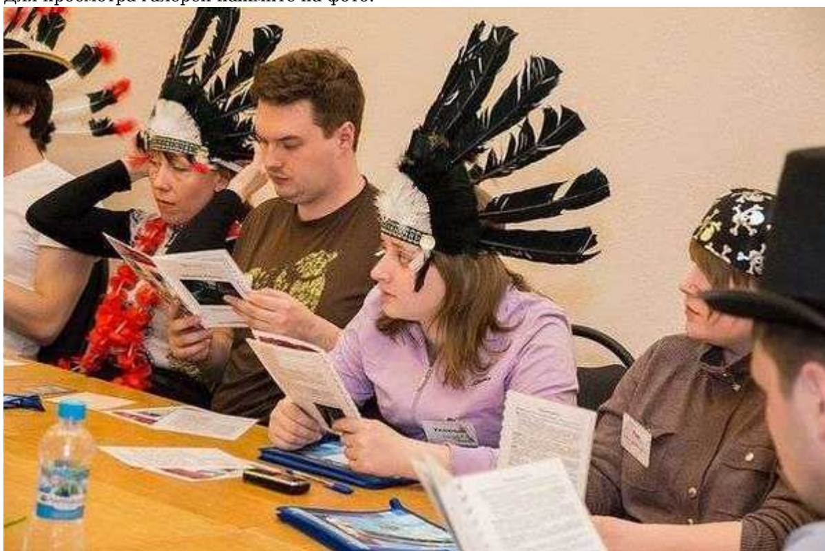
Фотография 4 из 9. Для просмотра галереи нажмите на фото.