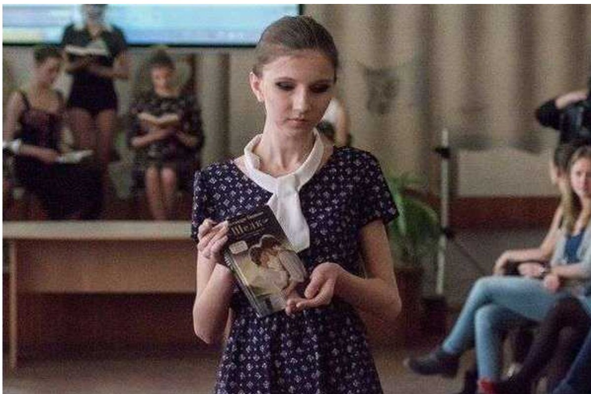
Фотография 1 из 9.