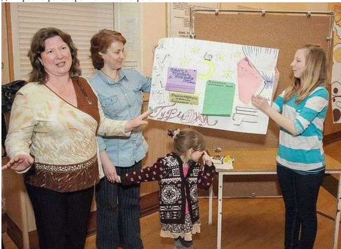
Фотография 6 из 9.