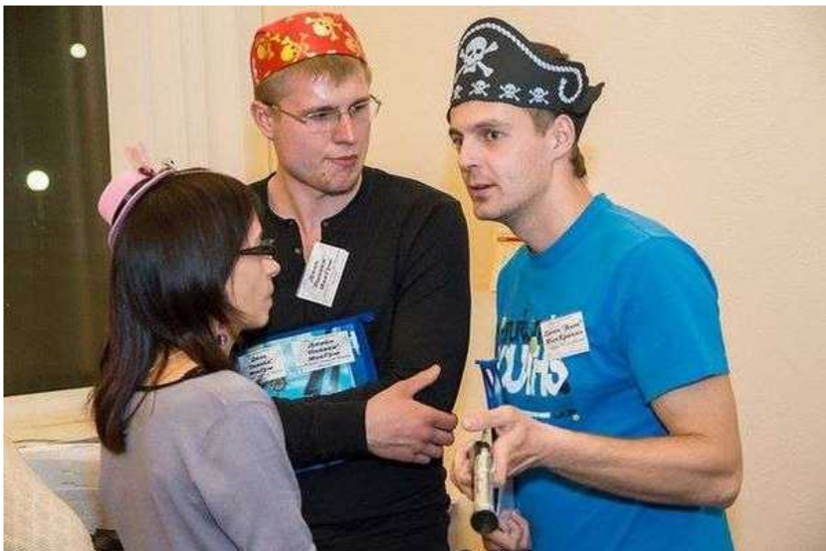
Фотография 5 из 9.