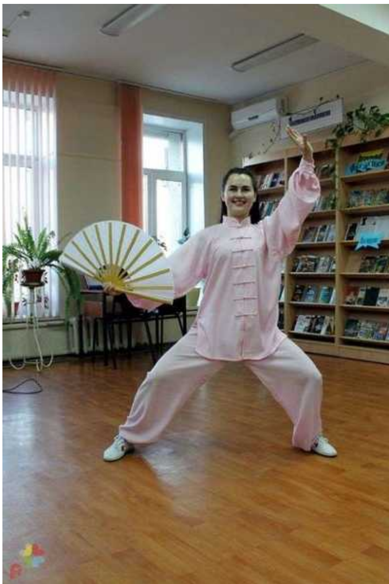
Фотография 5 из 6. Для просмотра галереи нажмите на фото.