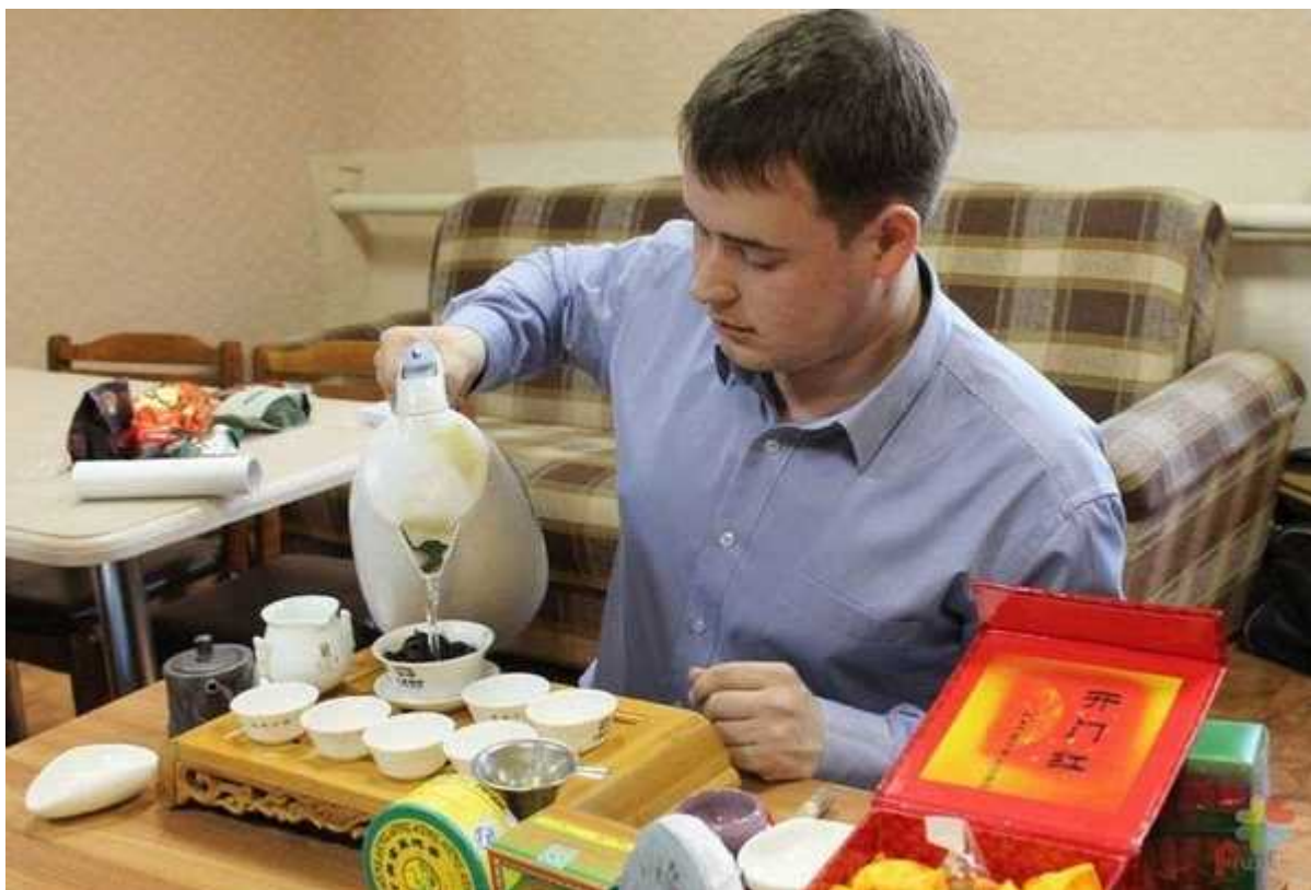
Фотография 6 из 6.