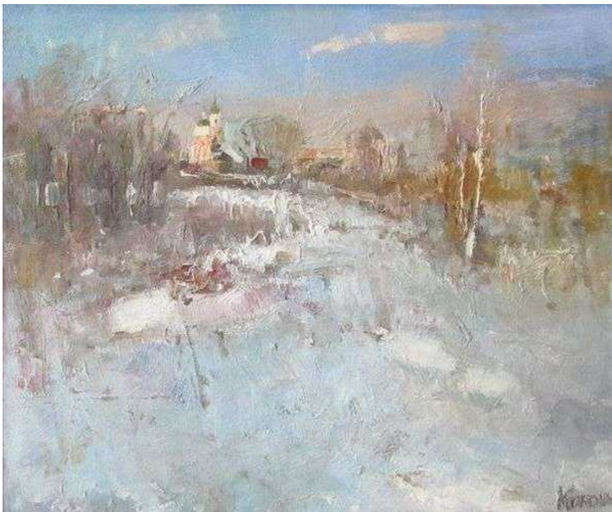
Художник: Кононыхин Михаил

— В экспозицию входит два стенда с фотографиями. Что это за работы?