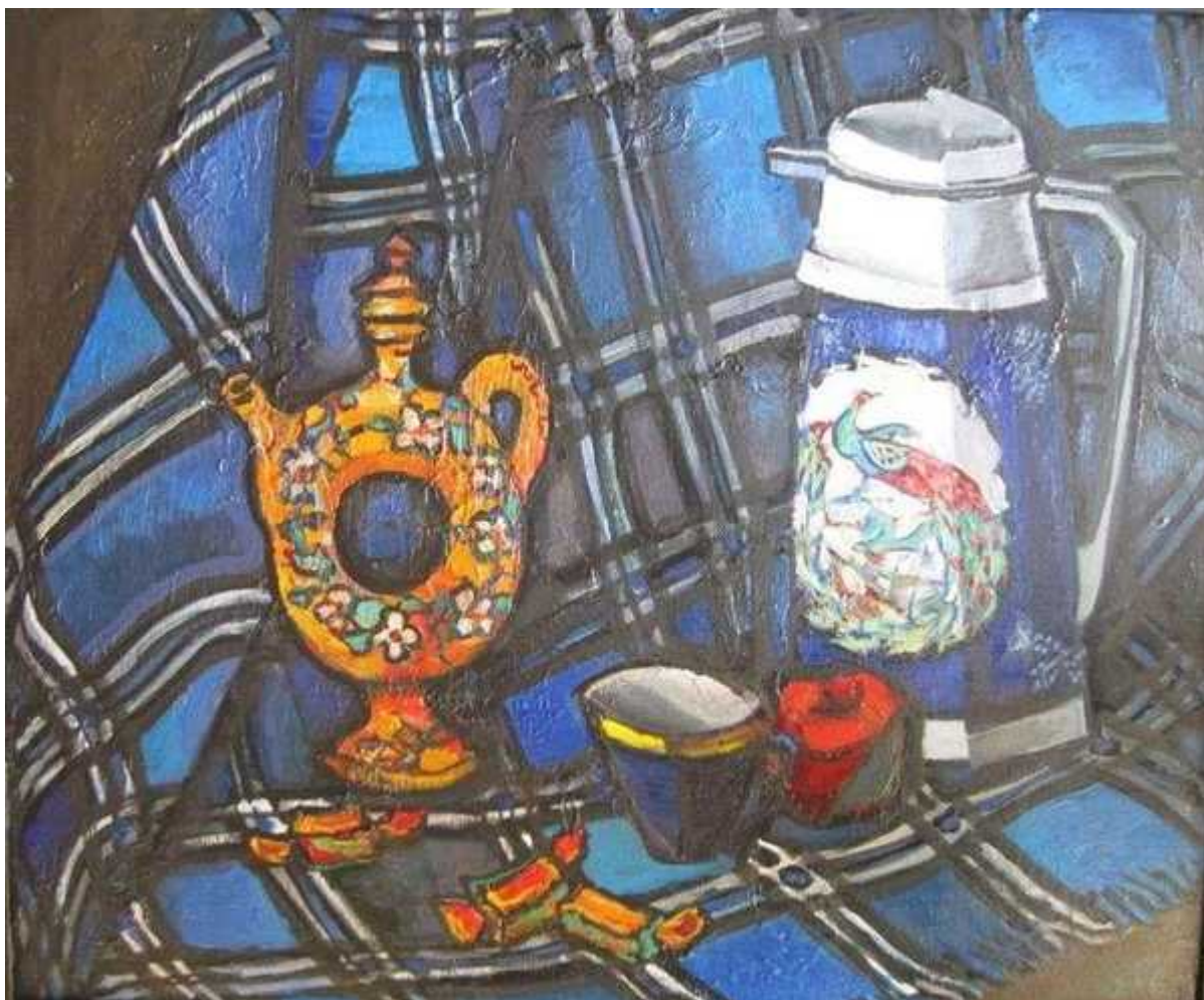
Художник: Александр Котов

— Помню Вашу прошлую выставку... Рост не только количественный, но и качественный, по моему мнению. Как люди приходят в «Холм»? Происходит ли какой-то отбор?