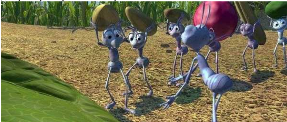
Фотография 4 из 4.