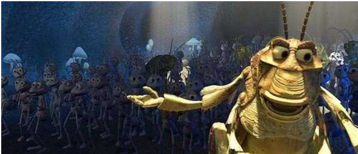
Фотография 2 из 4.