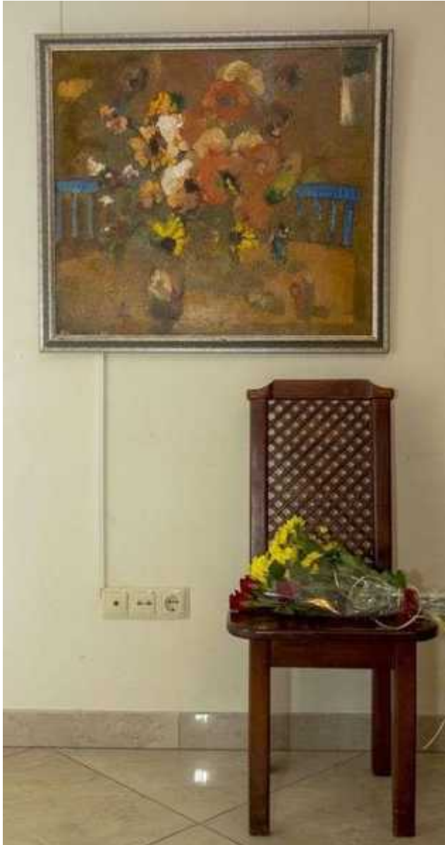
Фотография 13 из 13.