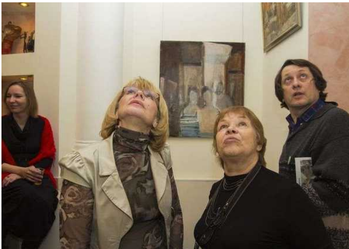
Фотография 7 из 13.