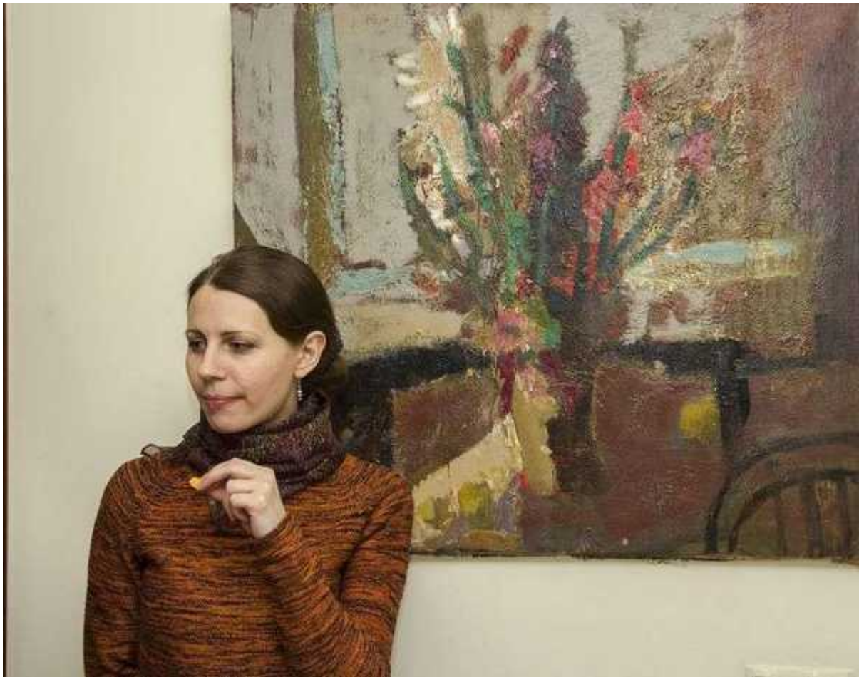
Фотография 6 из 13. Для просмотра галереи нажмите на фото.