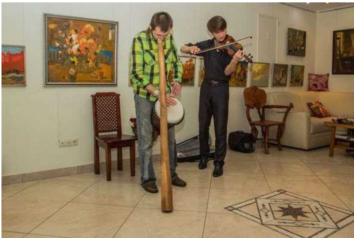
Фотография 9 из 13. Для просмотра галереи нажмите на фото.