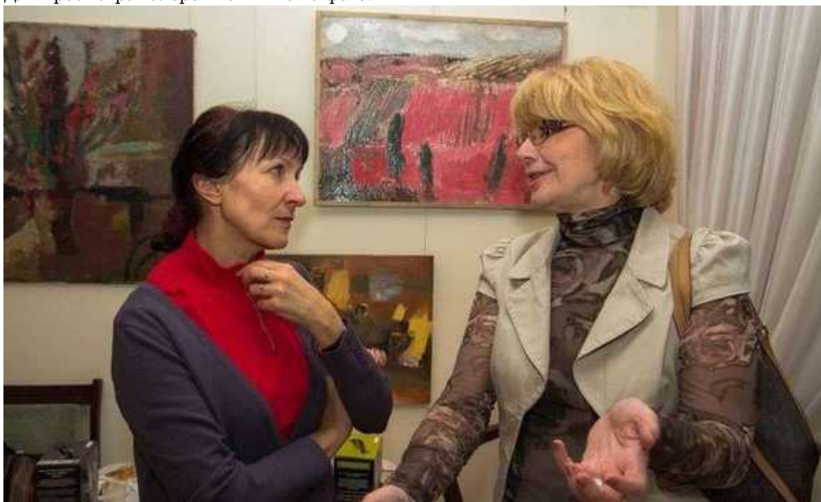
Фотография 8 из 13.