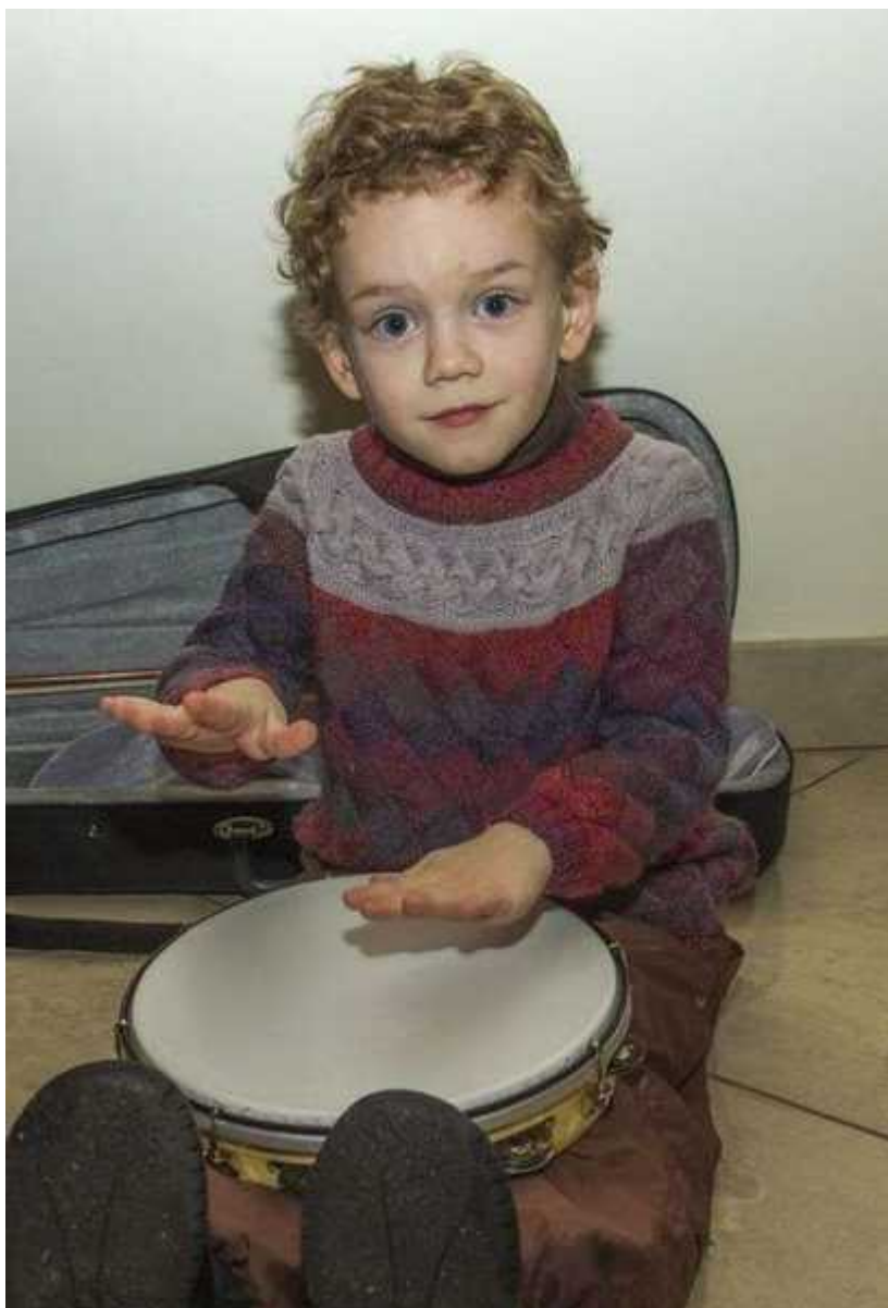
Фотография 12 из 13. Для просмотра галереи нажмите на фото.