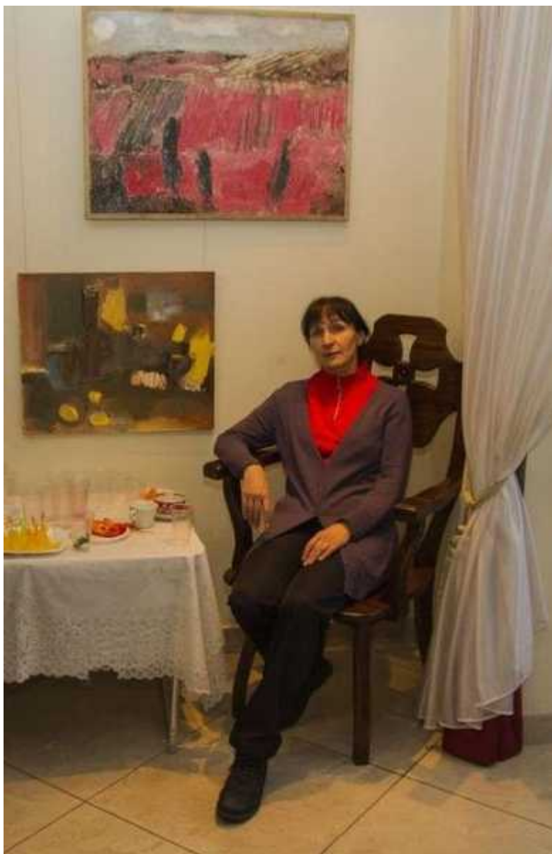
Фотография 5 из 13. Для просмотра галереи нажмите на фото.