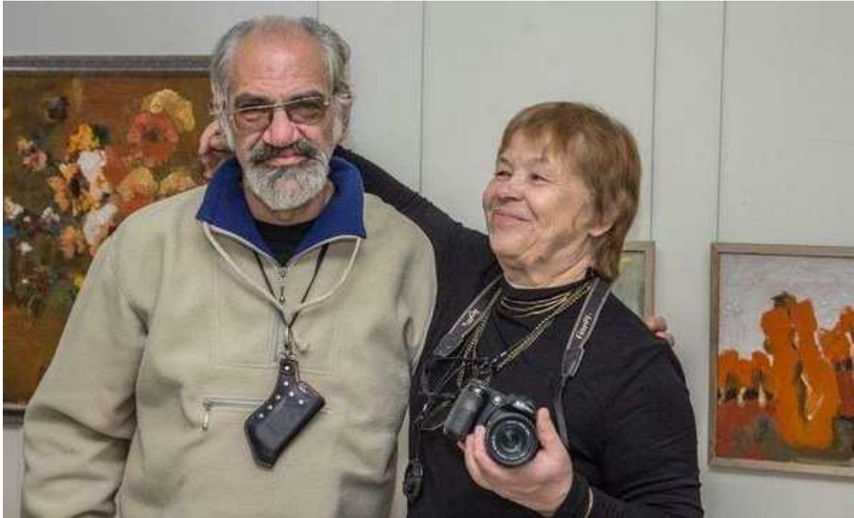
Фотография 2 из 13.