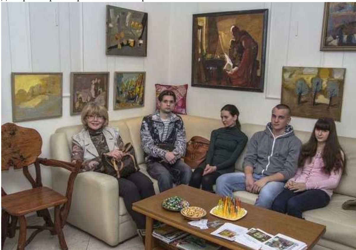
Фотография 3 из 13.