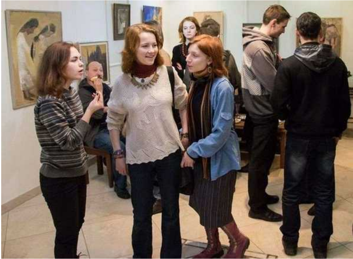
Фотография 8 из 10. Для просмотра галереи нажмите на фото.