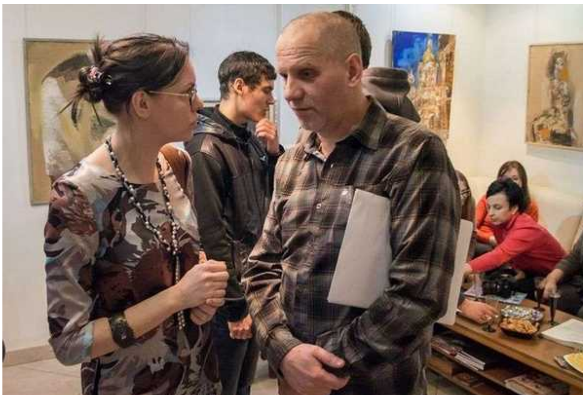
Фотография 6 из 10.