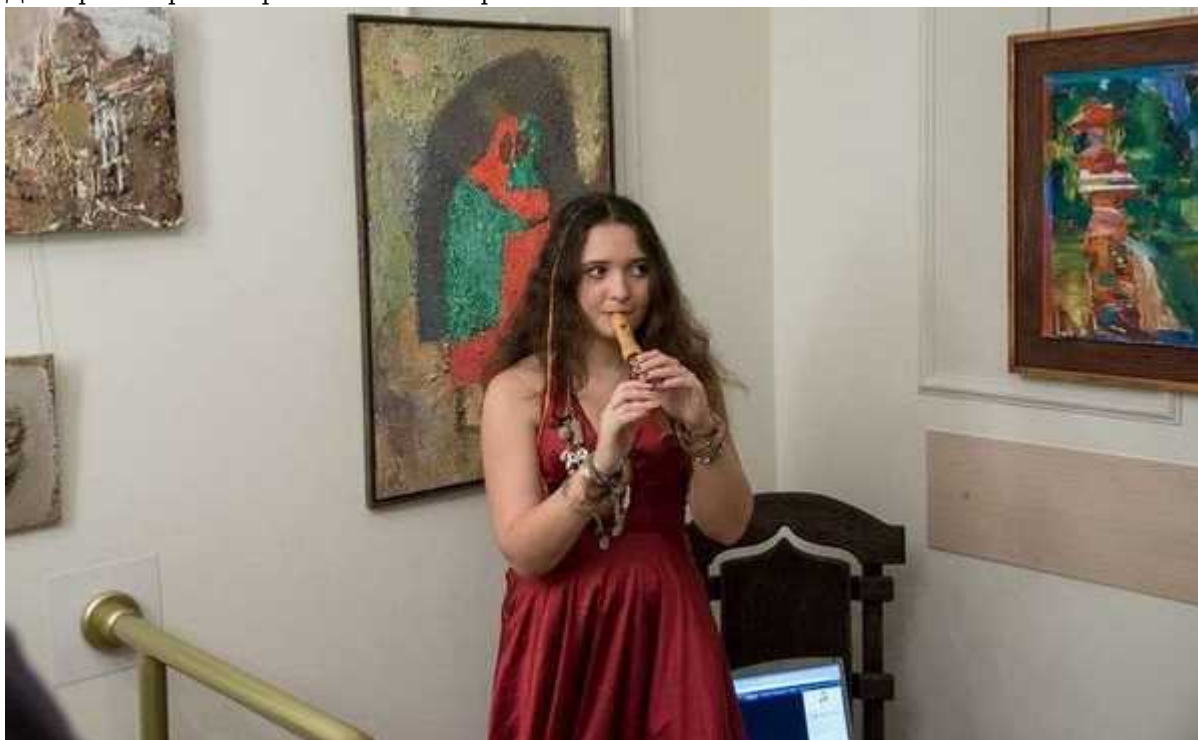
Фотография 7 из 10.