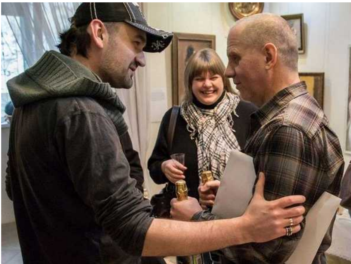
Фотография 2 из 10.