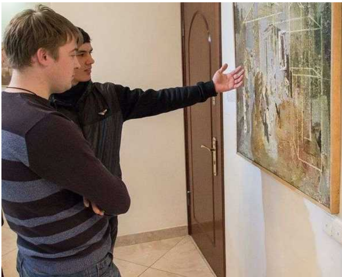
Фотография 9 из 10. Для просмотра галереи нажмите на фото.