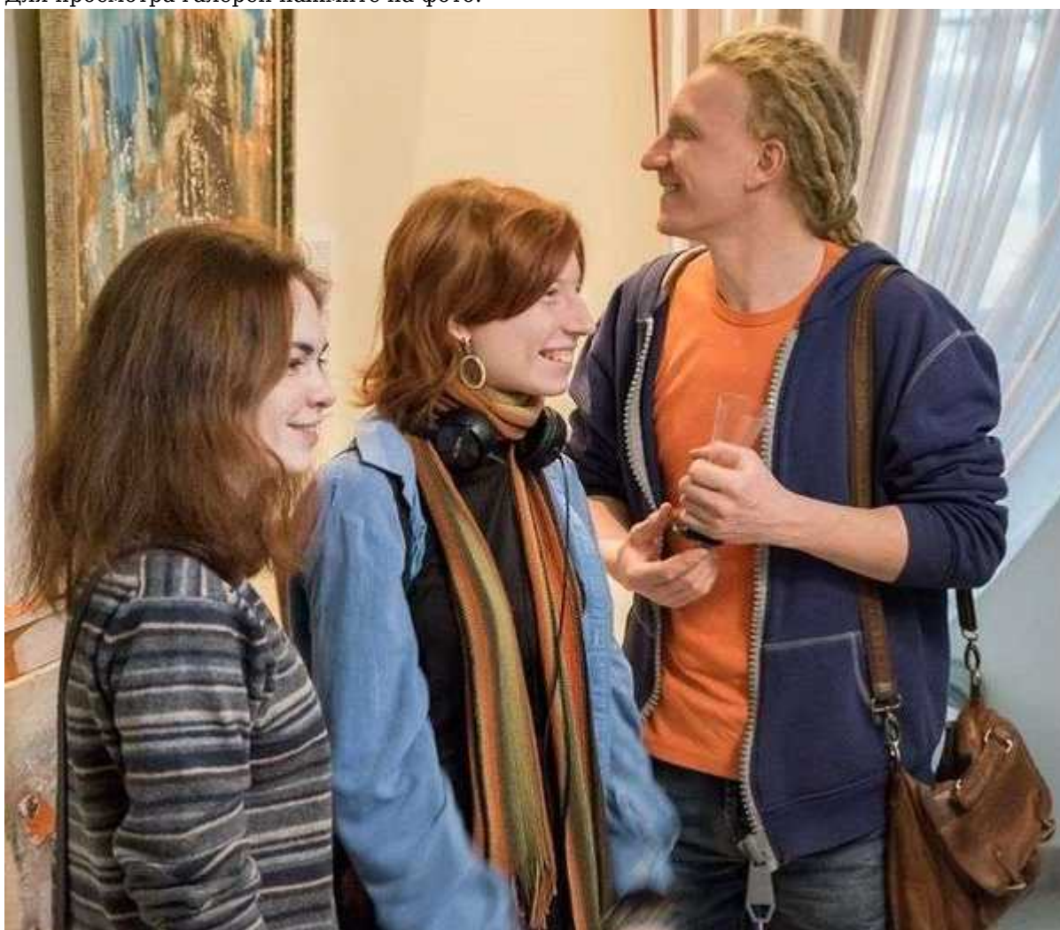
Фотография 5 из 10.