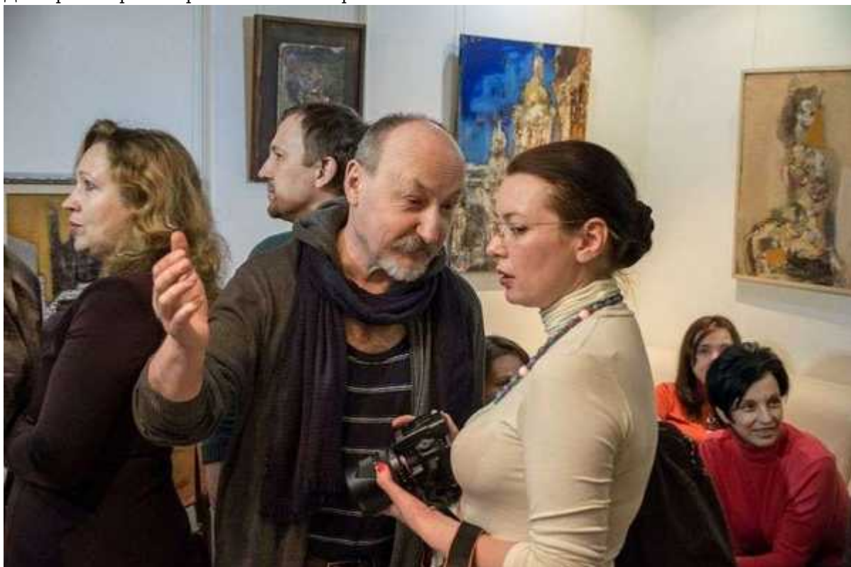
Фотография 10 из 10.