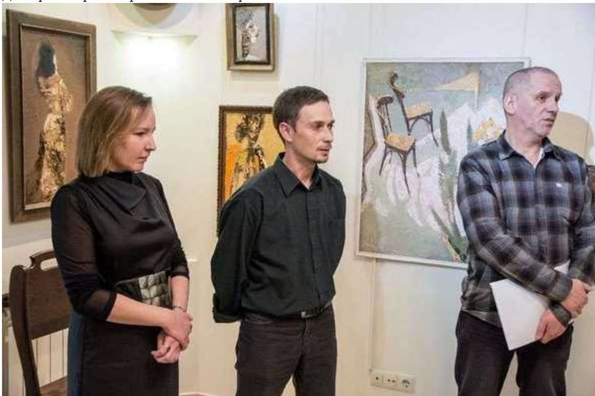
Фотография 3 из 10.