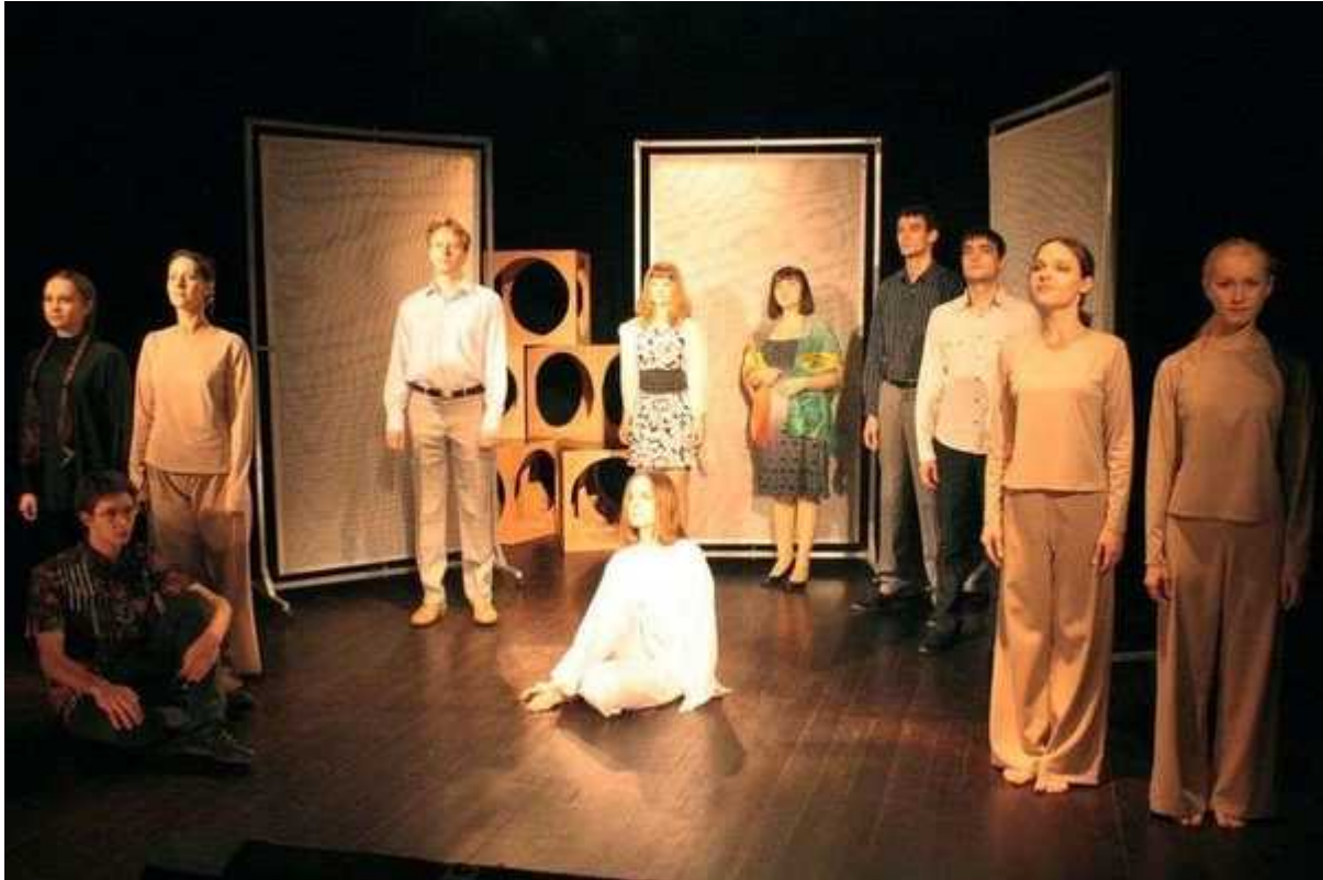
Фотография 4 из 7. Для просмотра галереи нажмите на фото.