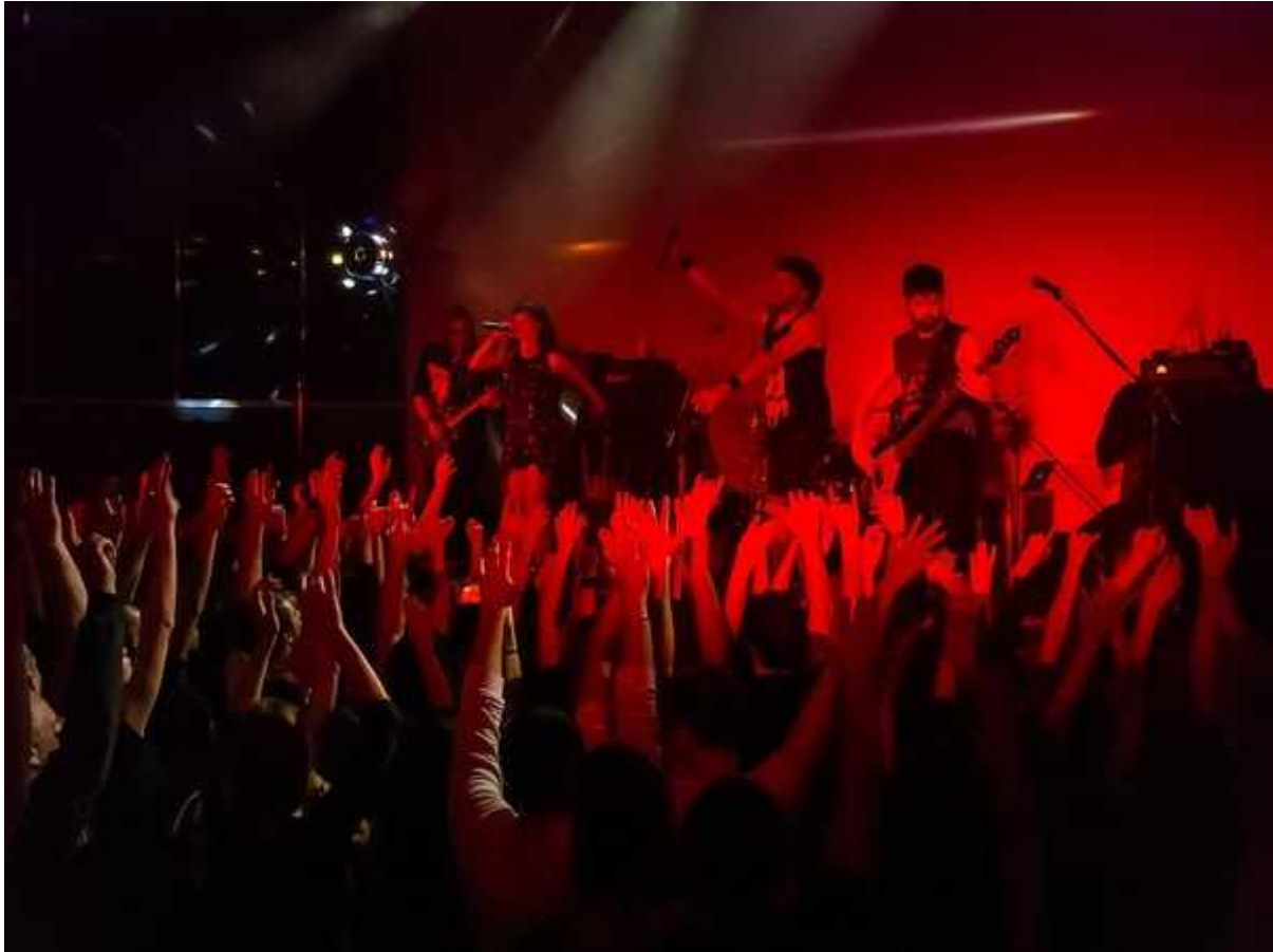
Фотография 32 из 39. Для просмотра галереи нажмите на фото.