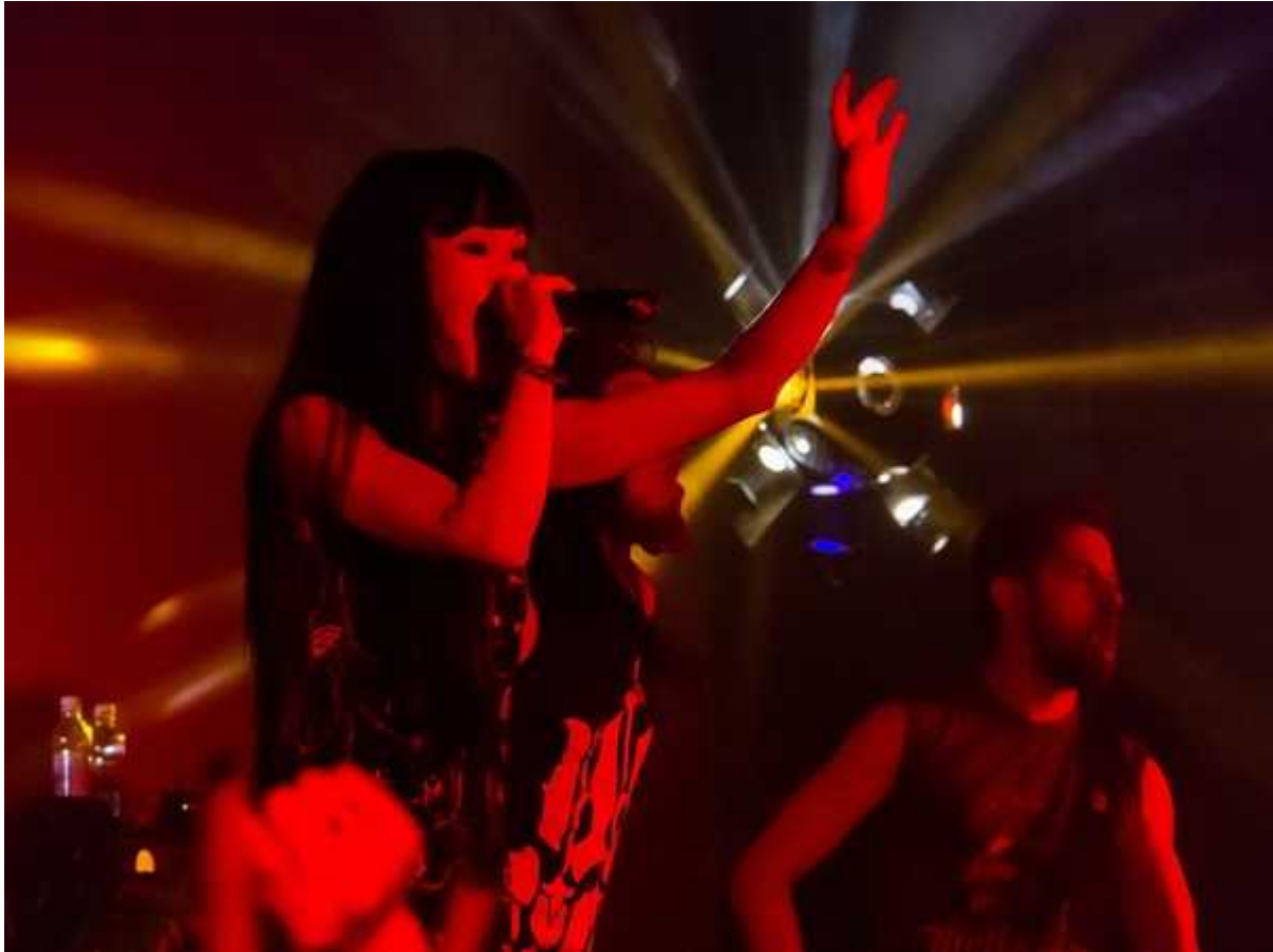
Фотография 6 из 39. Для просмотра галереи нажмите на фото.