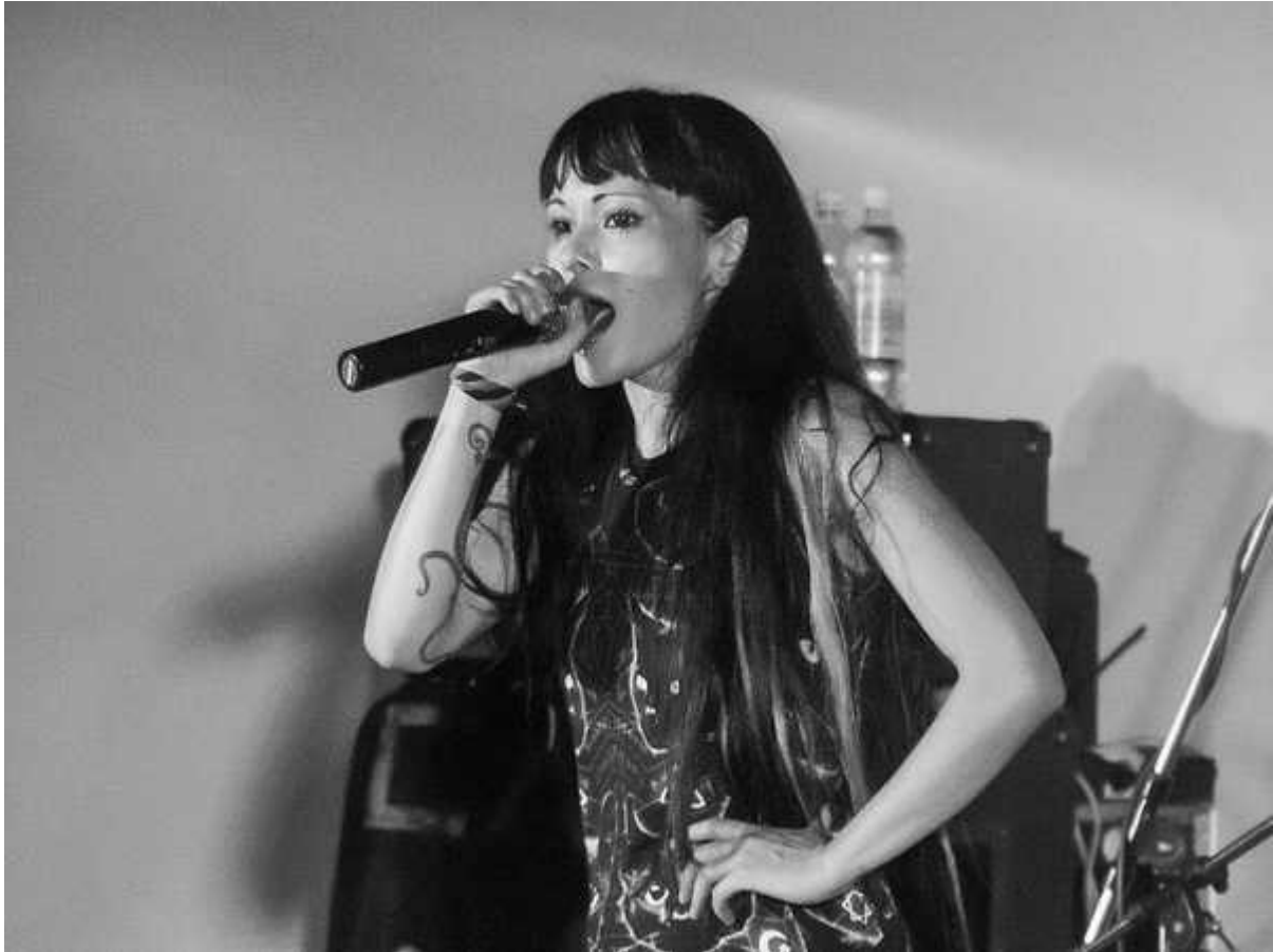
Фотография 8 из 39. Для просмотра галереи нажмите на фото.