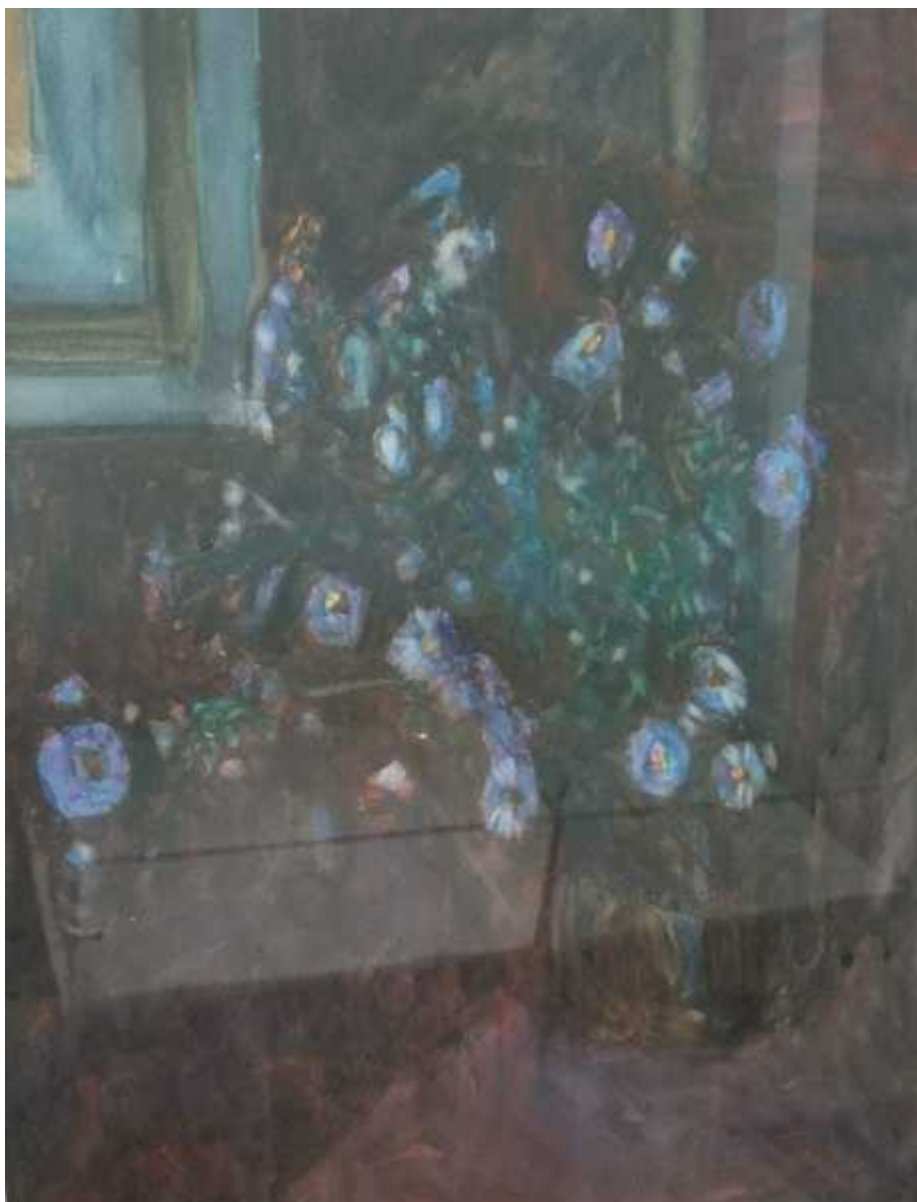
Натюрморт из серии "Цветы". 1984г. Бум,акв

Также примечательны его работы, связанные с трудом сталеваров в цеху. Сам мастер говорил: «Металлург — это очень мужская профессия. Она требует особого мужества. В работе раскрываются все качества человеческого существа — ярко, горячо». Изображая суровые мужские профили, освещённые только алым пламенем печи, и виды цеха, Дворянчиков будто желал поделиться своим восприятием службы металлургов: на полотнах это выглядит массивно, величественно и беспощадно.