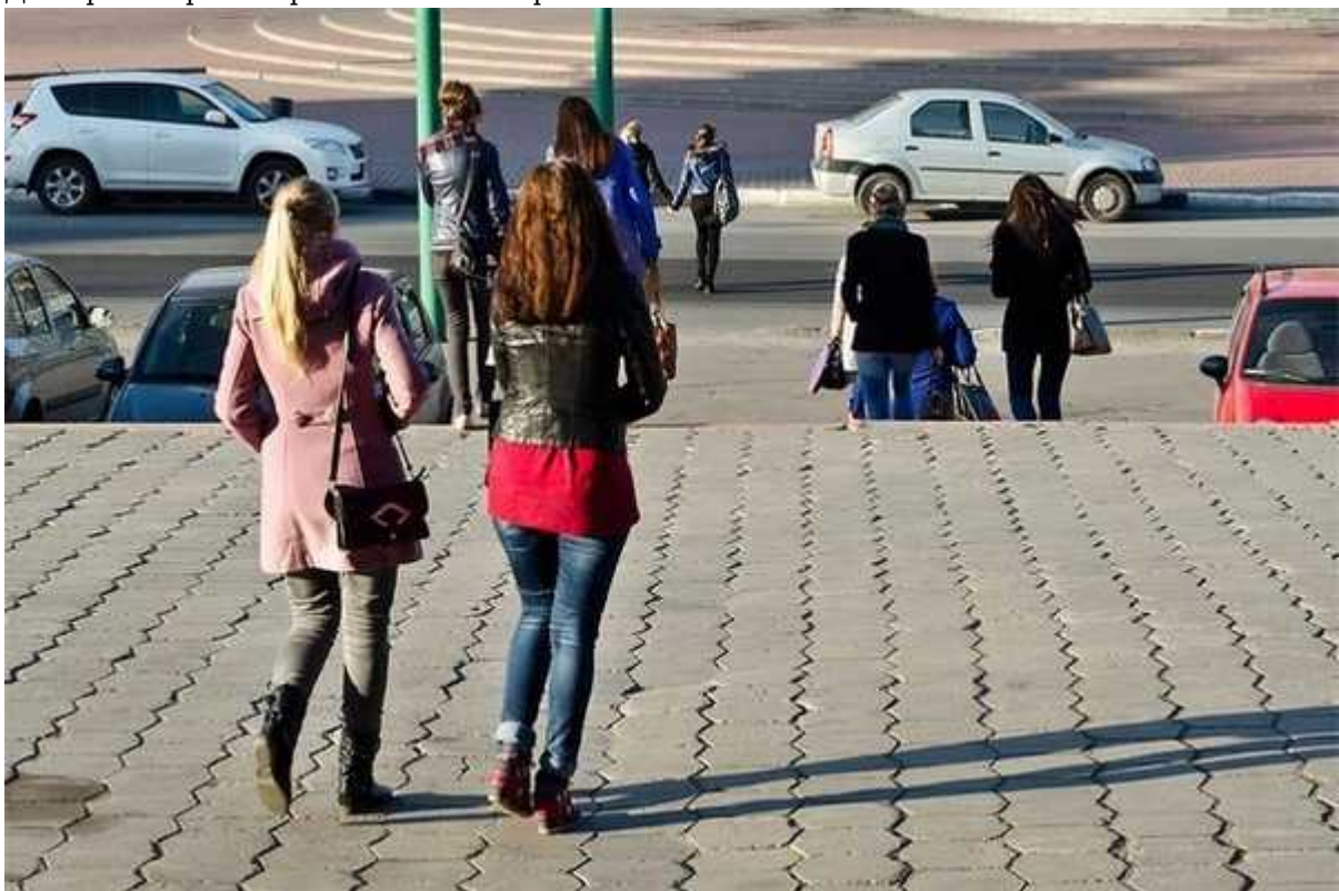
Фотография 7 из 8.