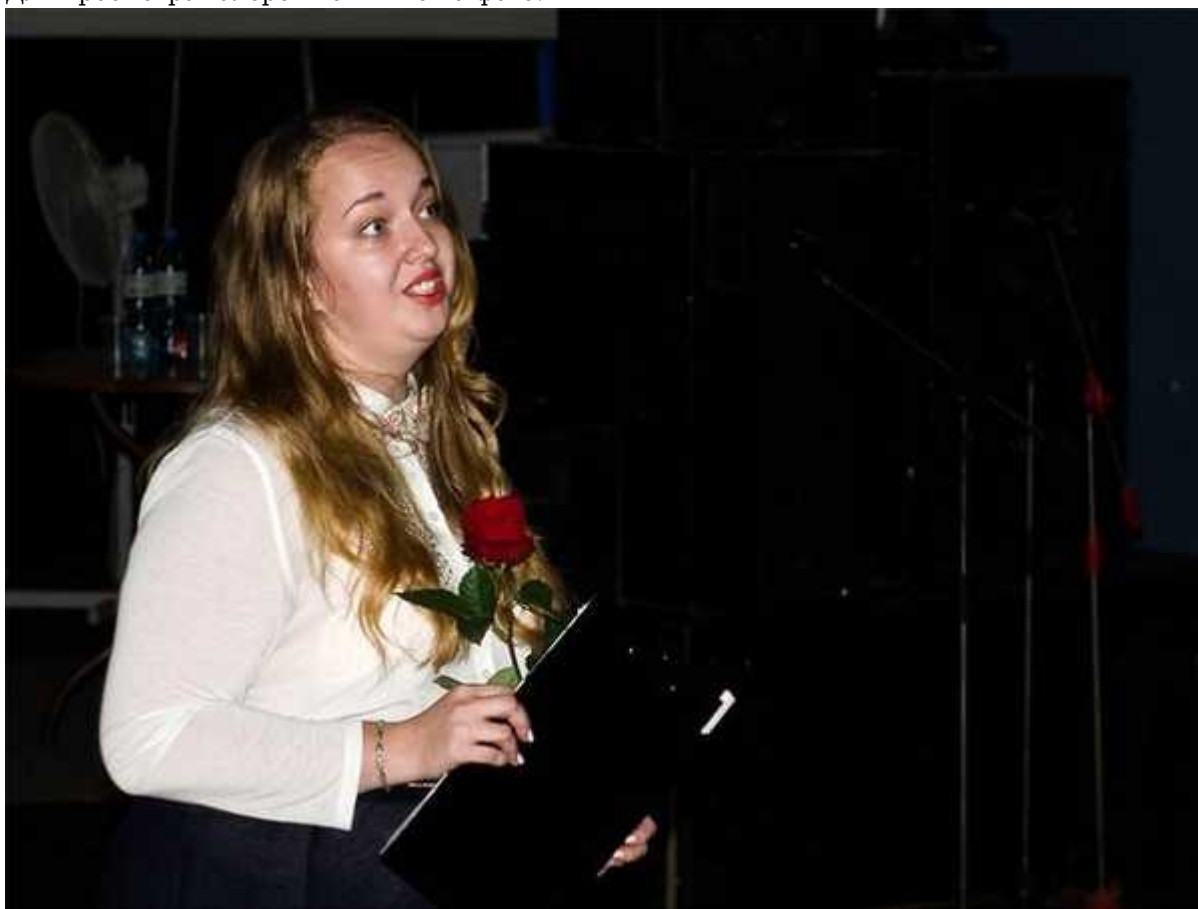
Фотография 3 из 8.