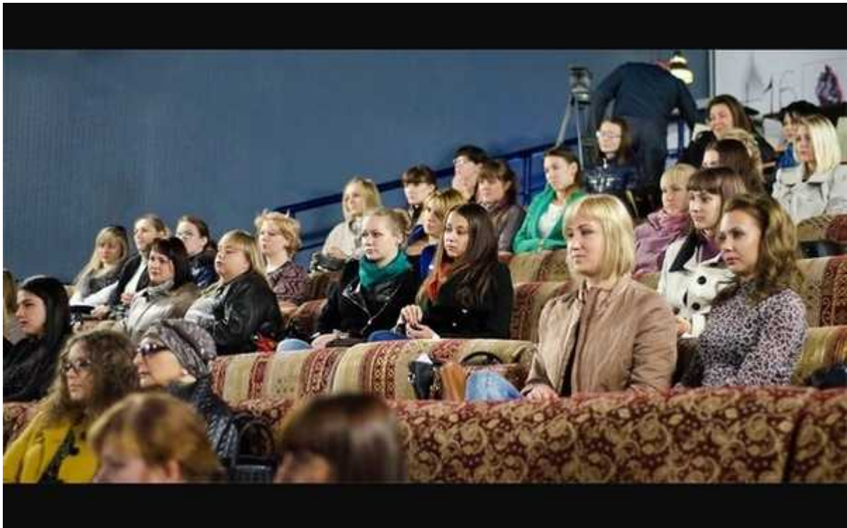
Фотография 6 из 8.