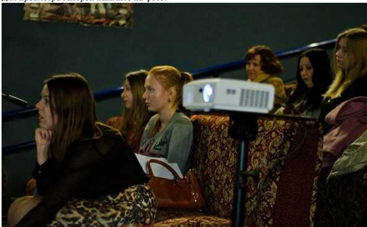
Фотография 5 из 8.