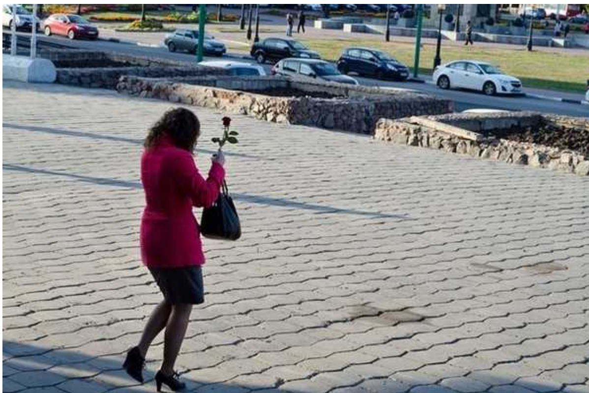
Фотография 8 из 8.