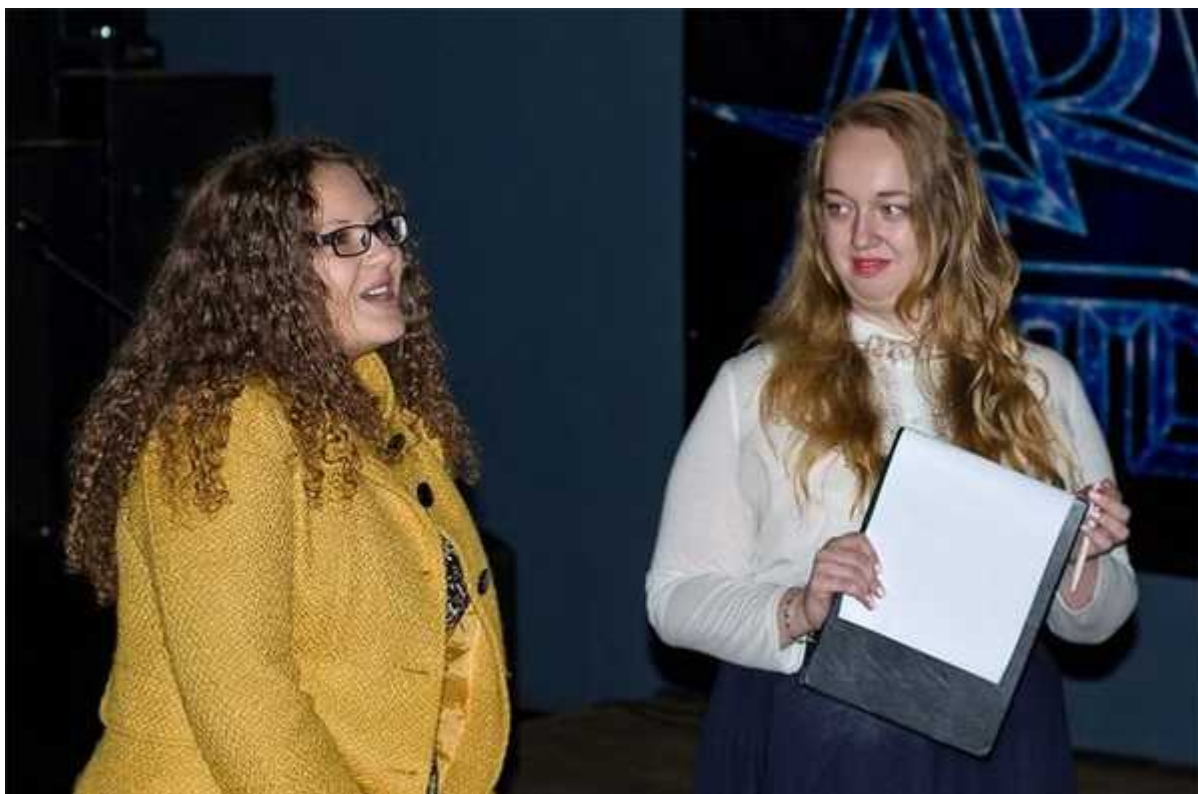
Фотография 4 из 8.