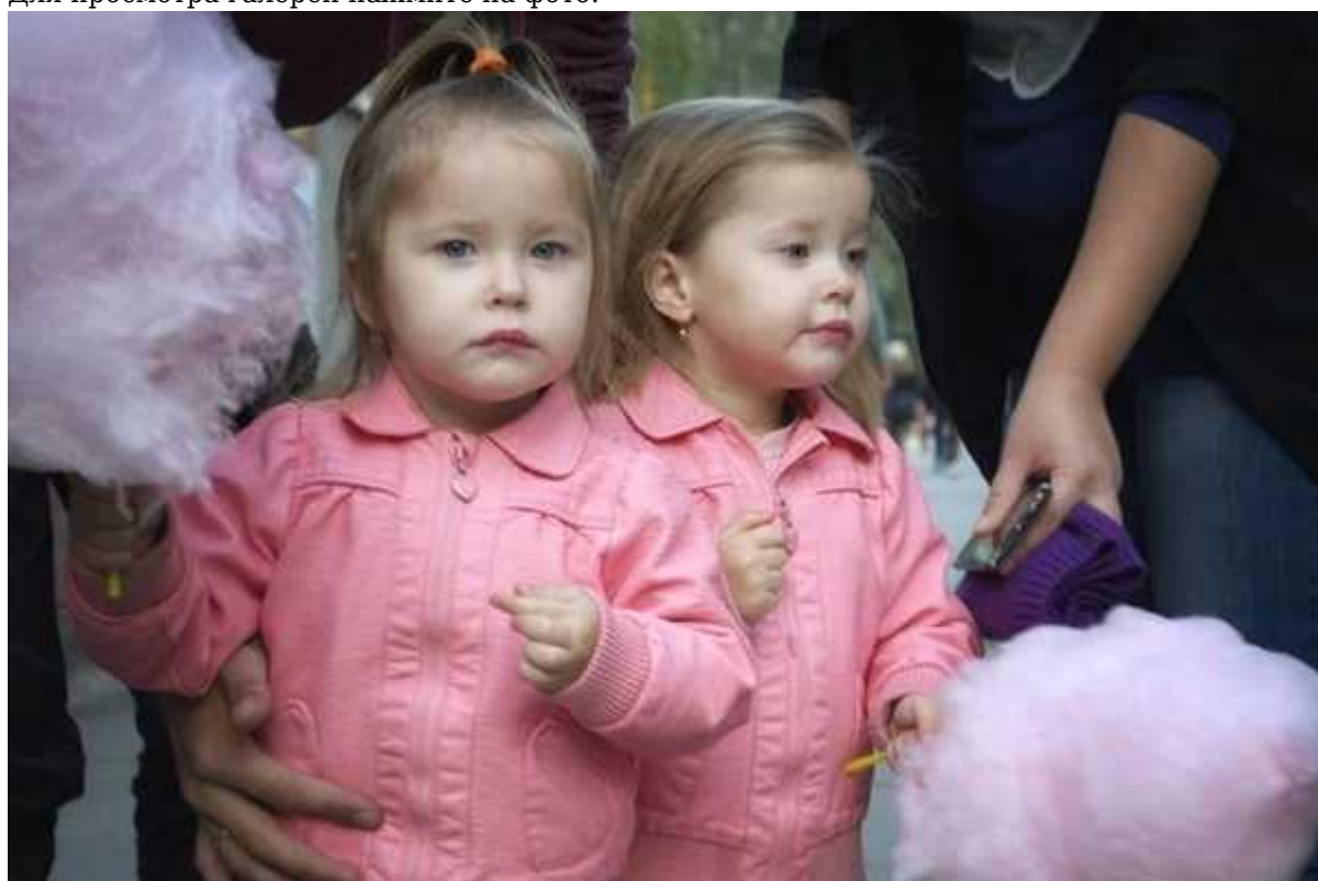
Фотография 5 из 6.