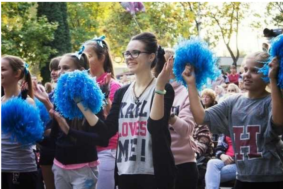
Фотография 4 из 5.