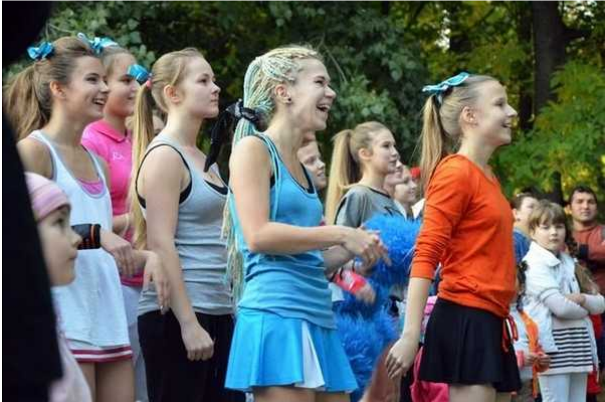
Фотография 2 из 6. Для просмотра галереи нажмите на фото.