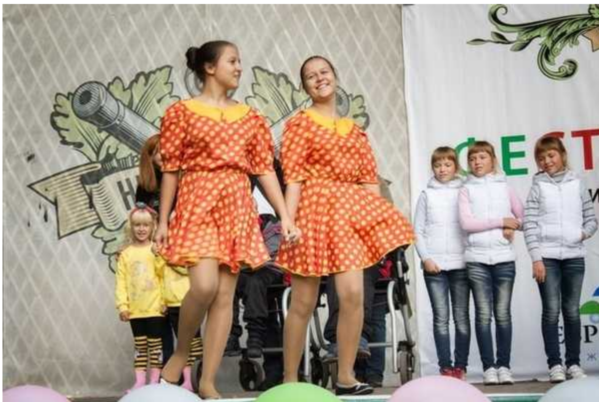
Фотография 2 из 5. Для просмотра галереи нажмите на фото.