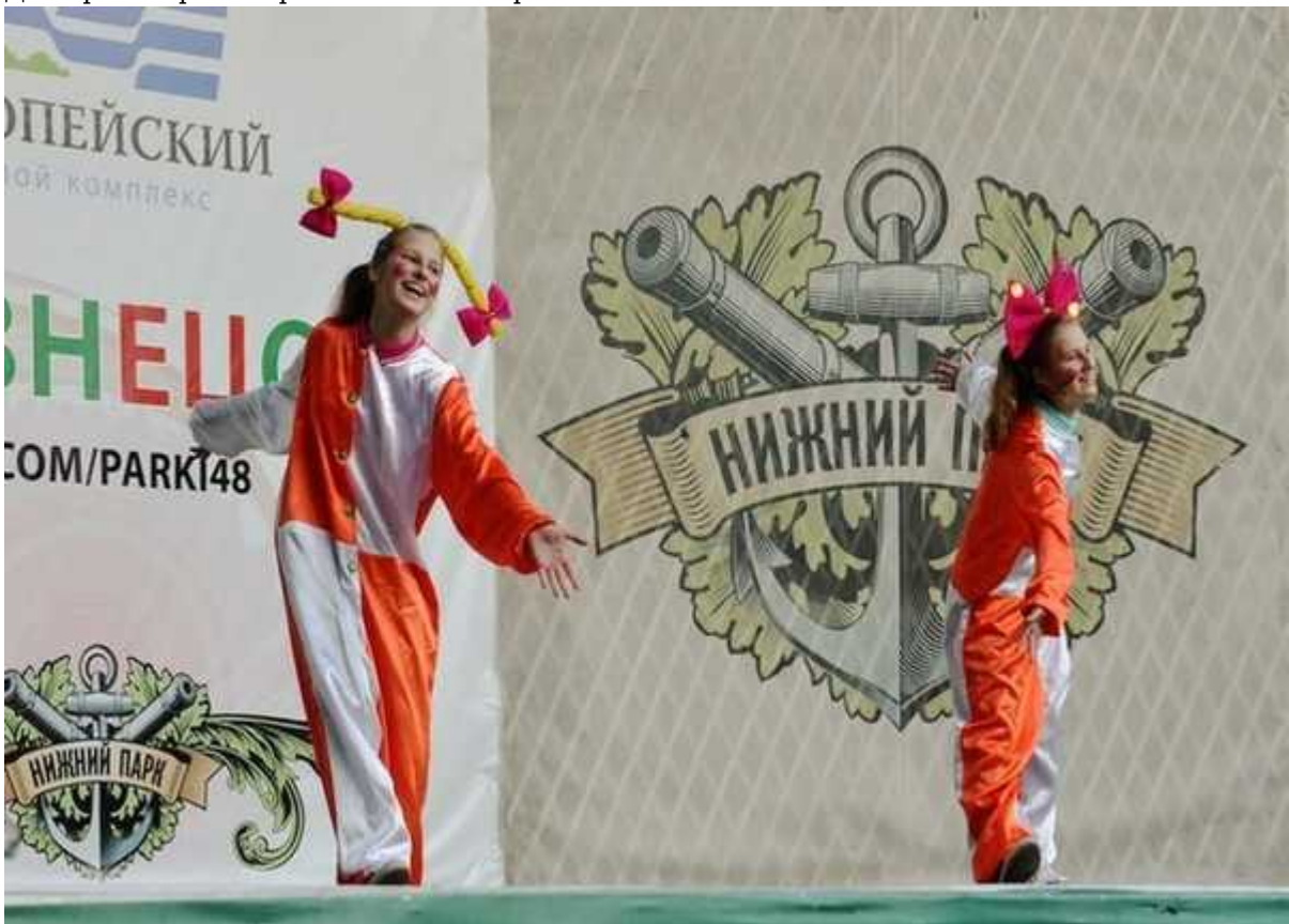
Фотография 3 из 6. Для просмотра галереи нажмите на фото.