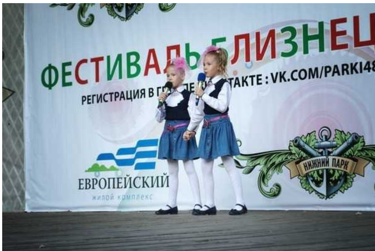
Фотография 4 из 6.