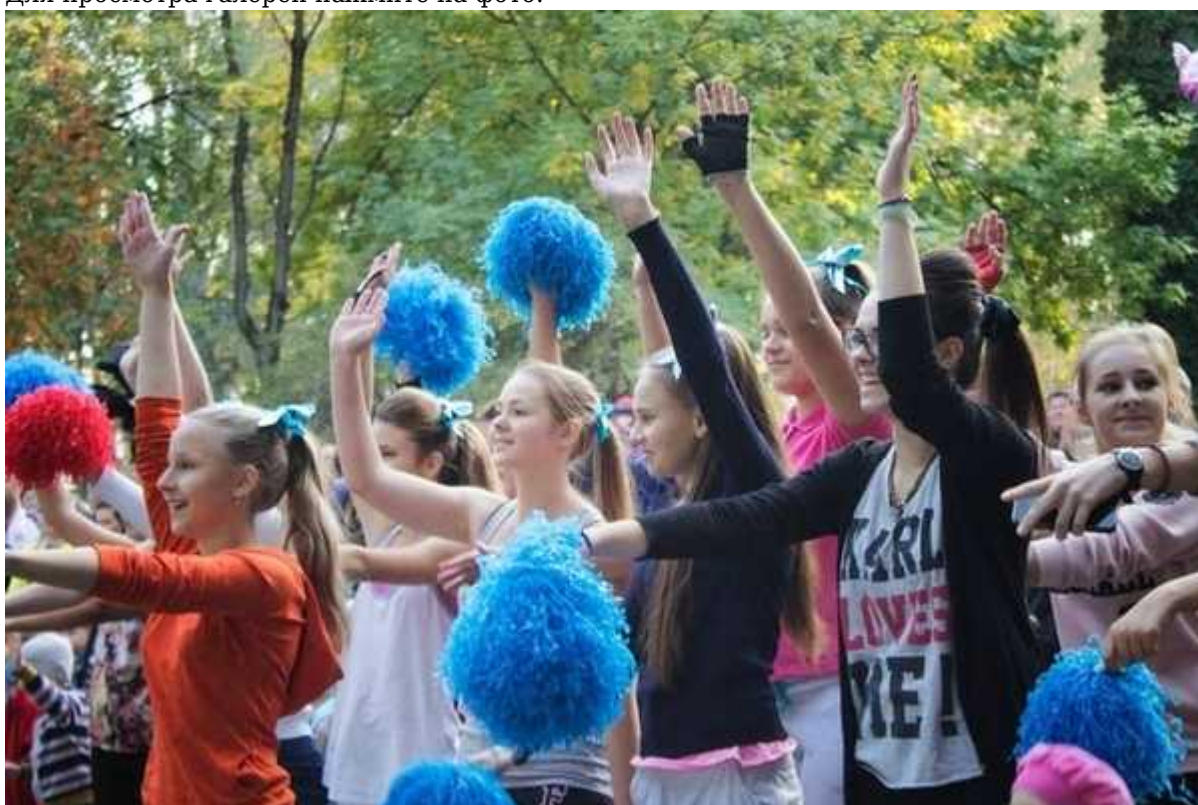
Фотография 3 из 5. Для просмотра галереи нажмите на фото.