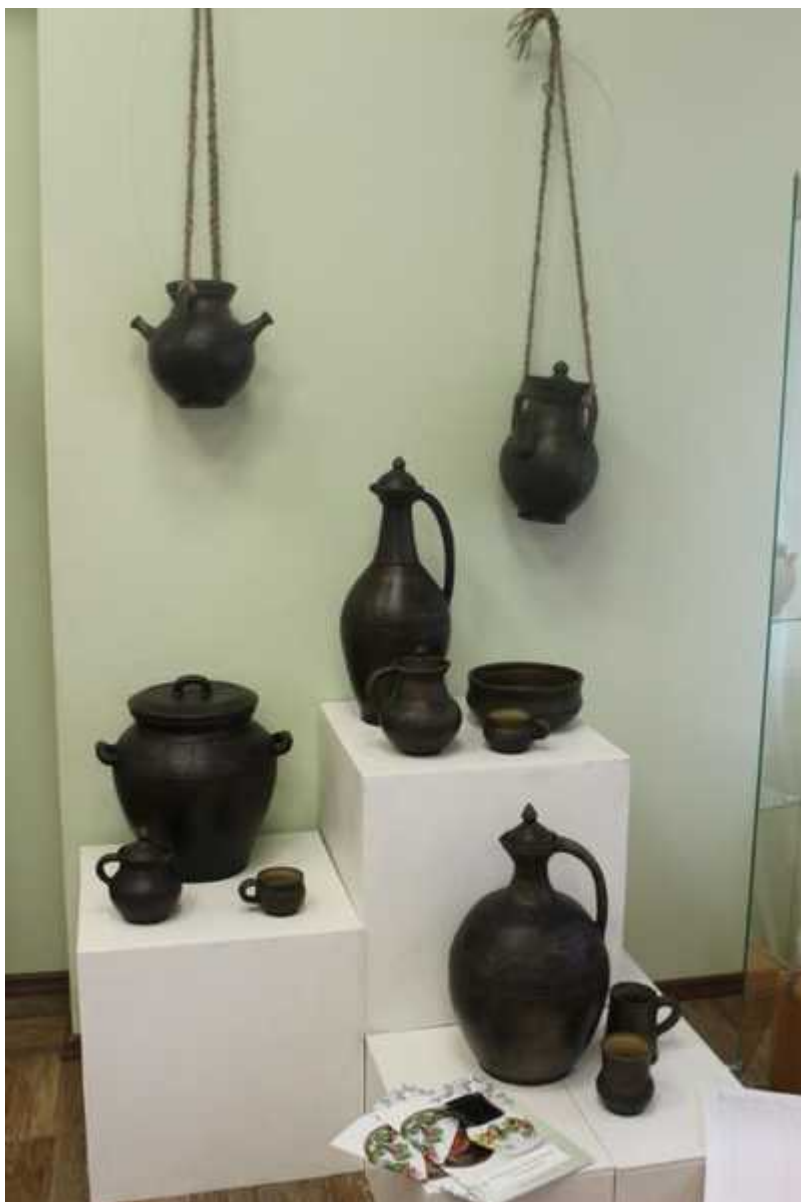
Фотография 2 из 4. Для просмотра галереи нажмите на фото.