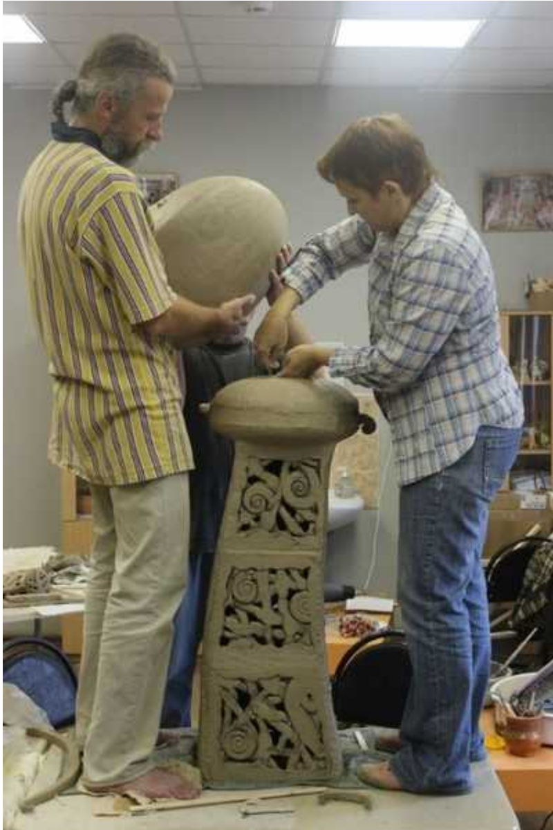
Фотография 4 из 10. Для просмотра галереи нажмите на фото.