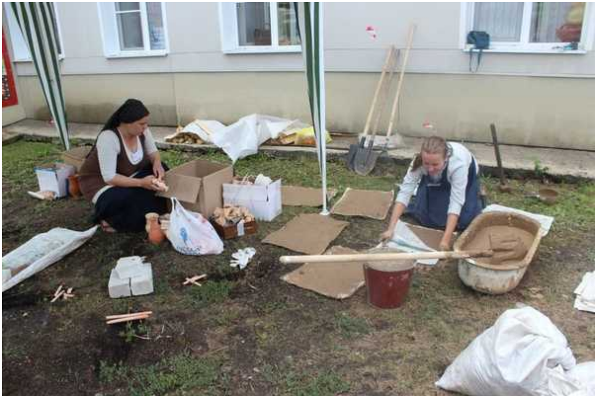
Фотография 1 из 9. Для просмотра галереи нажмите на фото.