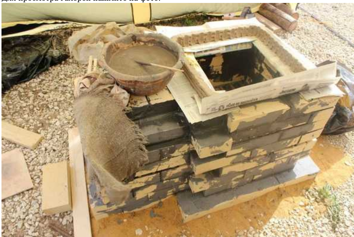
Фотография 2 из 10. Для просмотра галереи нажмите на фото.