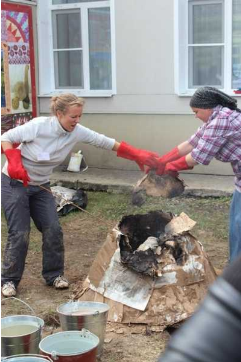
Фотография 7 из 9. Для просмотра галереи нажмите на фото.