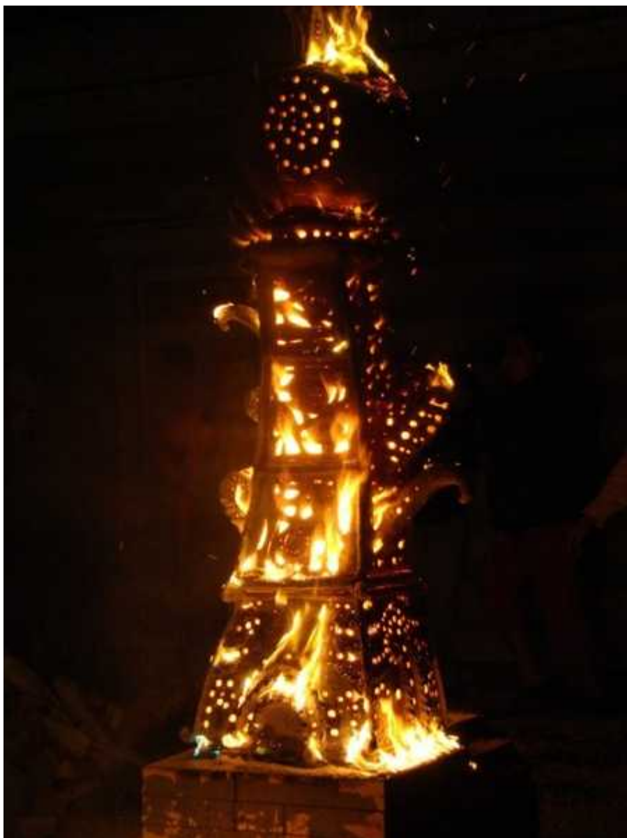
Фотография 9 из 10. Для просмотра галереи нажмите на фото.