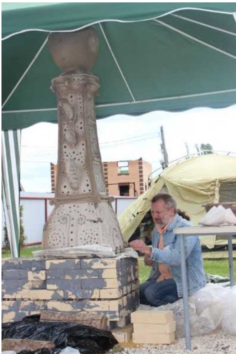
Фотография 3 из 10. Для просмотра галереи нажмите на фото.