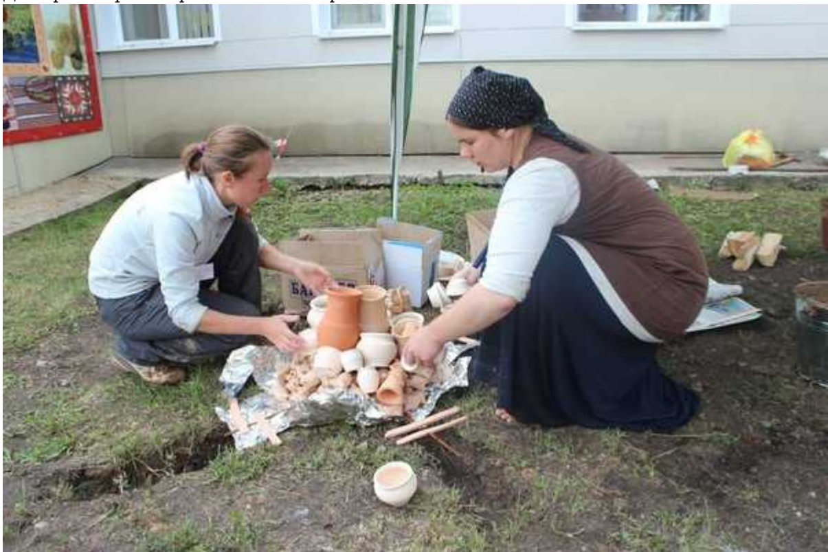
Фотография 2 из 9. Для просмотра галереи нажмите на фото.