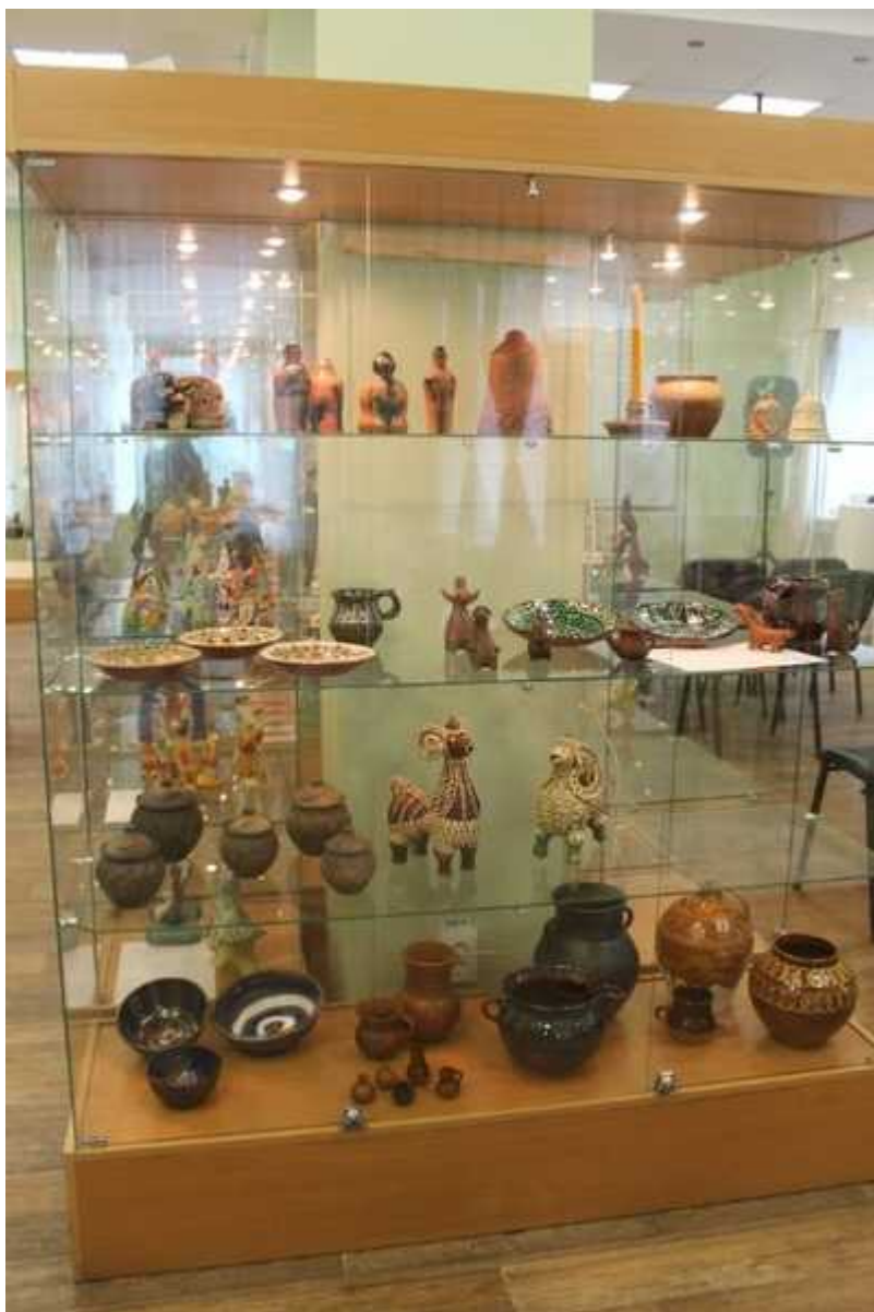
Фотография 3 из 4. Для просмотра галереи нажмите на фото.