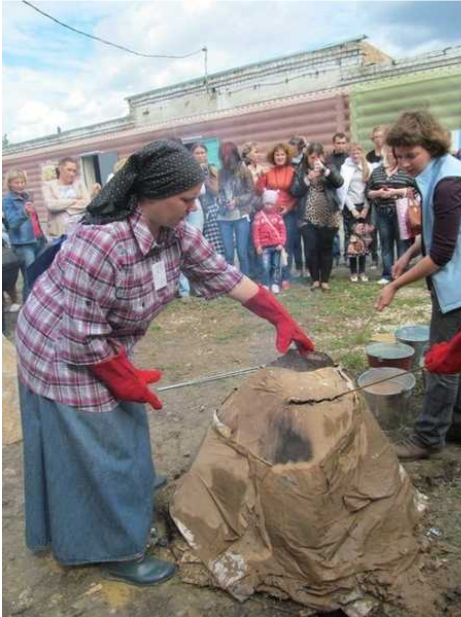
Фотография 8 из 9. Для просмотра галереи нажмите на фото.