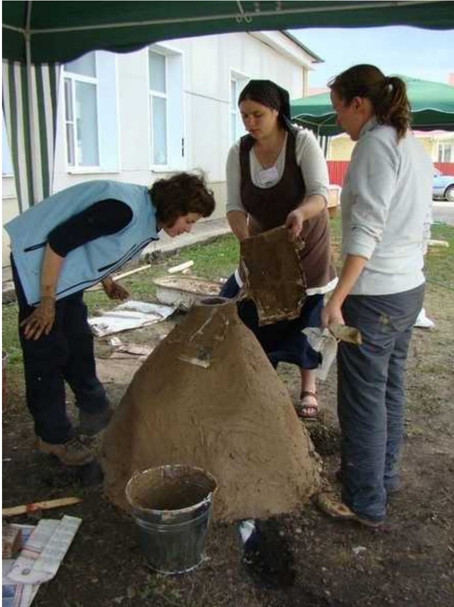
Фотография 5 из 9. Для просмотра галереи нажмите на фото.