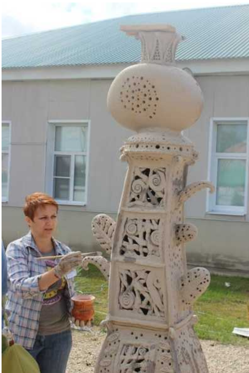
Фотография 5 из 10. Для просмотра галереи нажмите на фото.