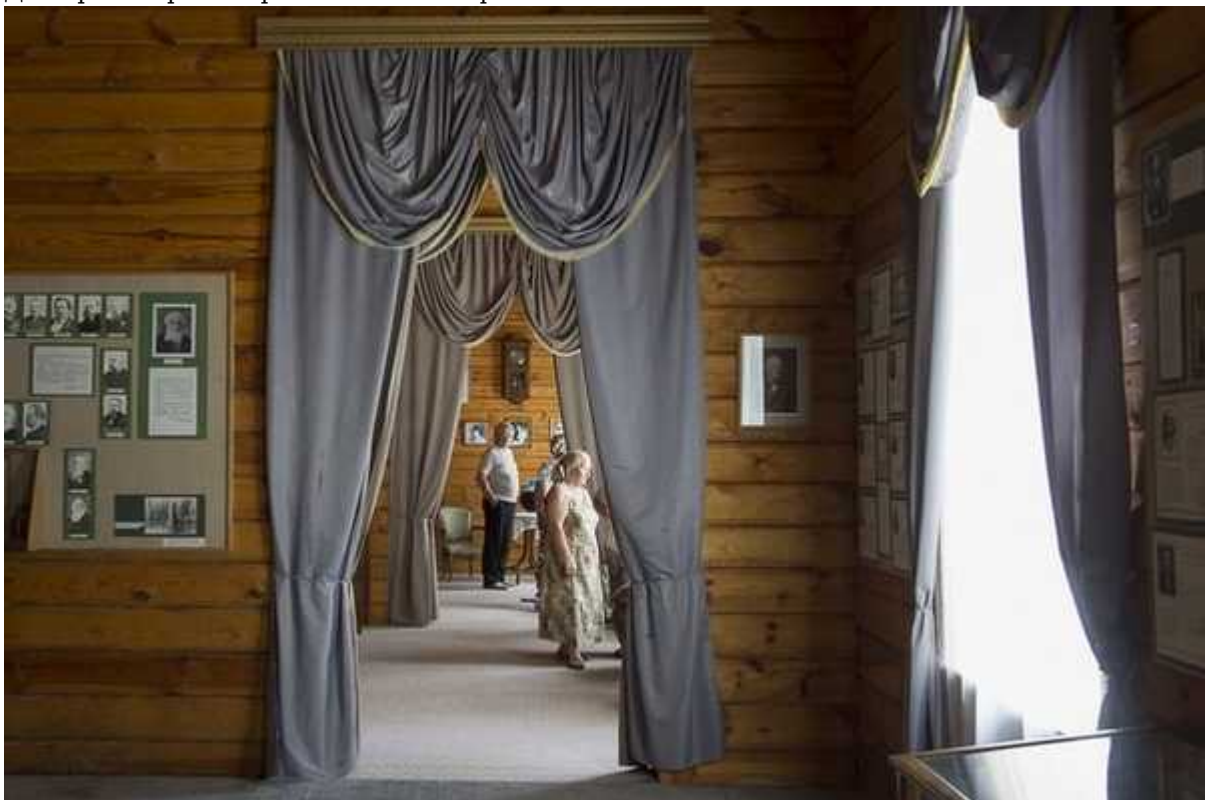
Фотография 6 из 8.