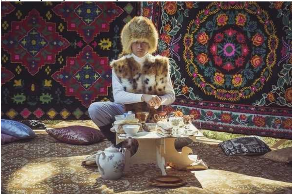
Фотография 3 из 6. Для просмотра галереи нажмите на фото.