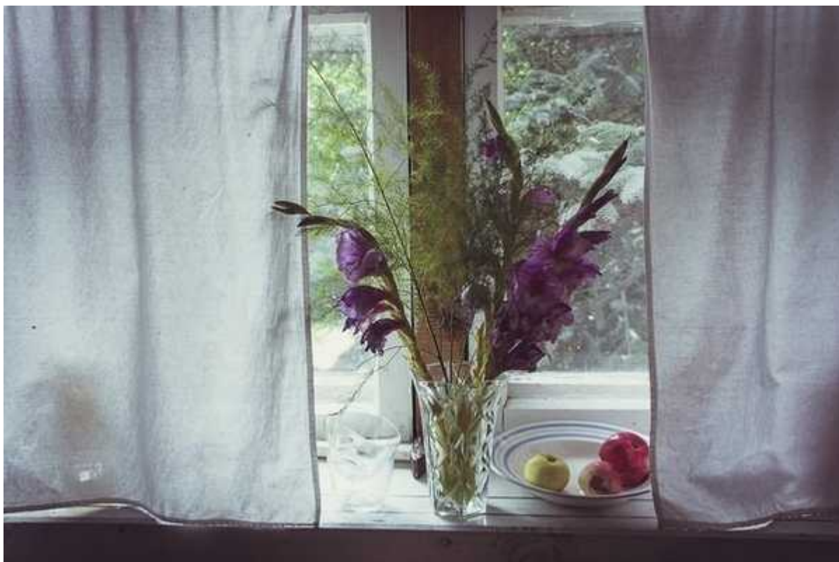
Фотография 7 из 8.