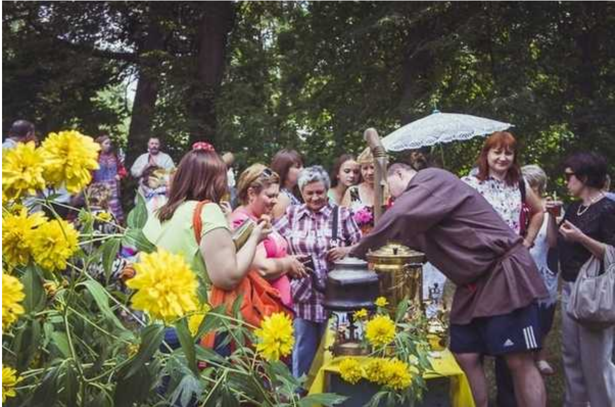
Фотография 4 из 6.