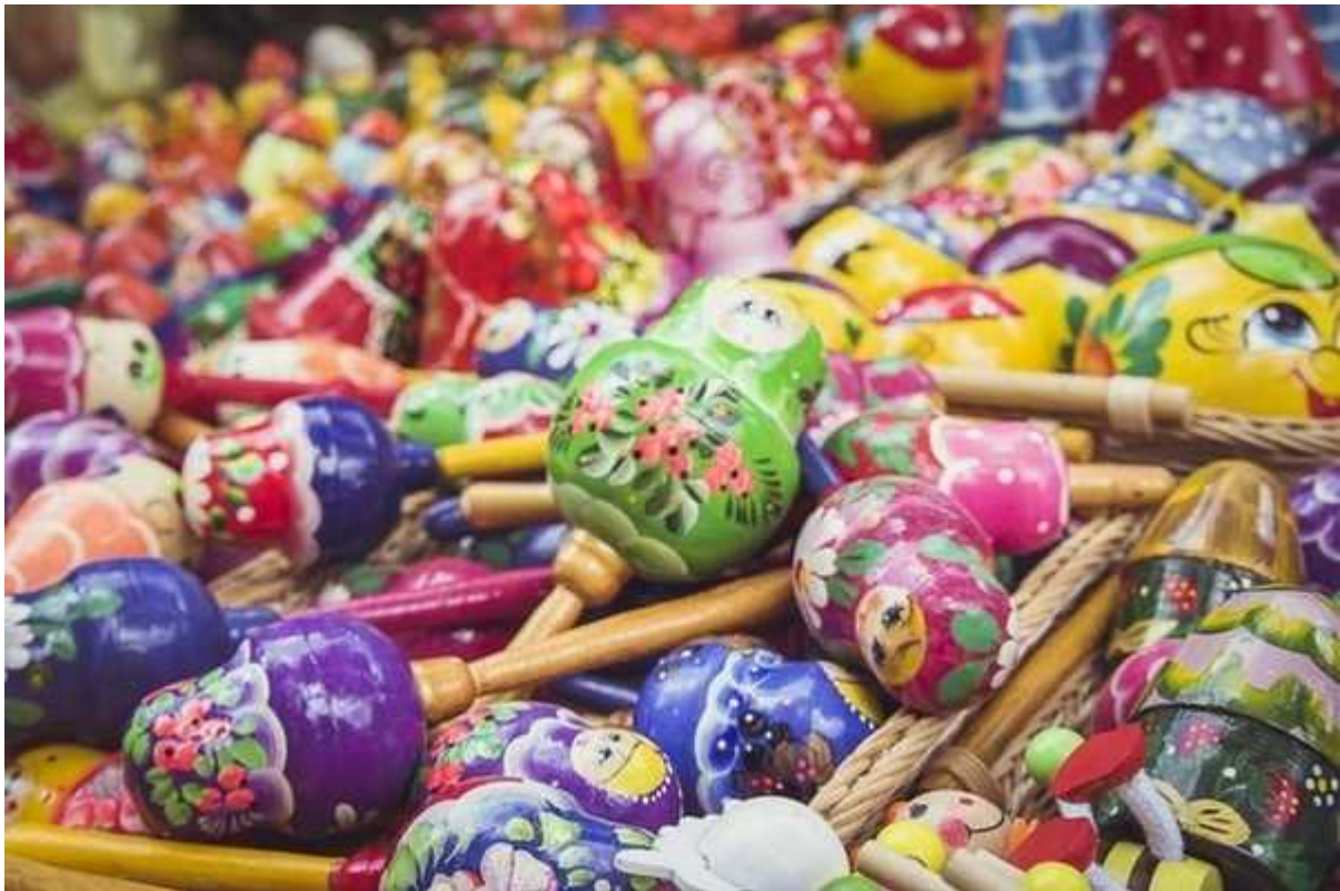
Фотография 2 из 5. Для просмотра галереи нажмите на фото.