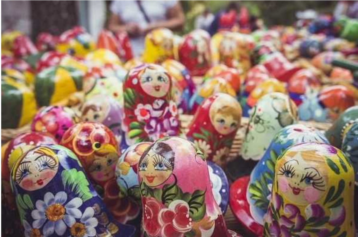
Фотография 4 из 5.