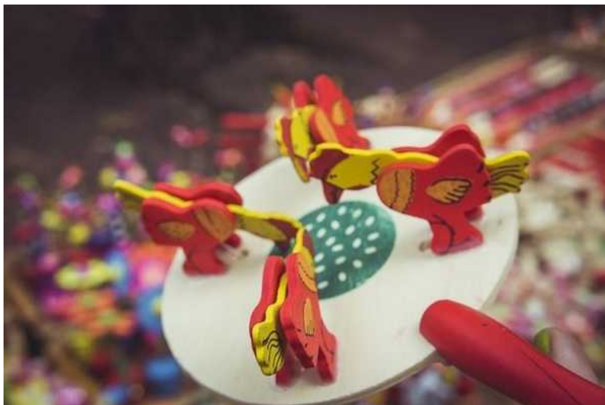
Фотография 1 из 5.

...Мы без труда нашли Урусово и, следуя указателям, по почти ровной дороге приехали к усадьбе. Уже на входе женщины и мужчины в разноцветных одеждах поют песни. Тут же продаётся бесчисленное множество безделушек из дерева, выкрашенных в яркие цвета, игрушки наших прапрабабушек и дедушек: трещётки, погремушки и верх совершенства — куры, клюющие зёрна.