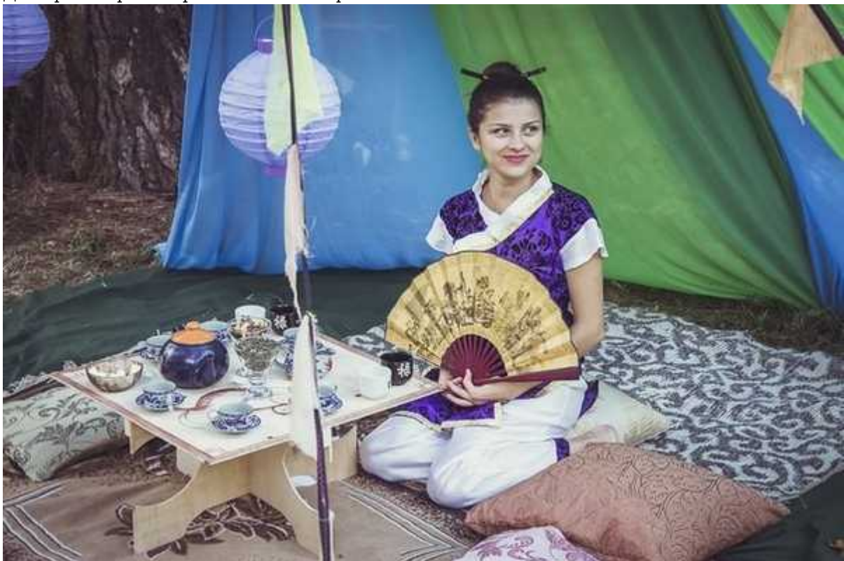
Фотография 5 из 6.