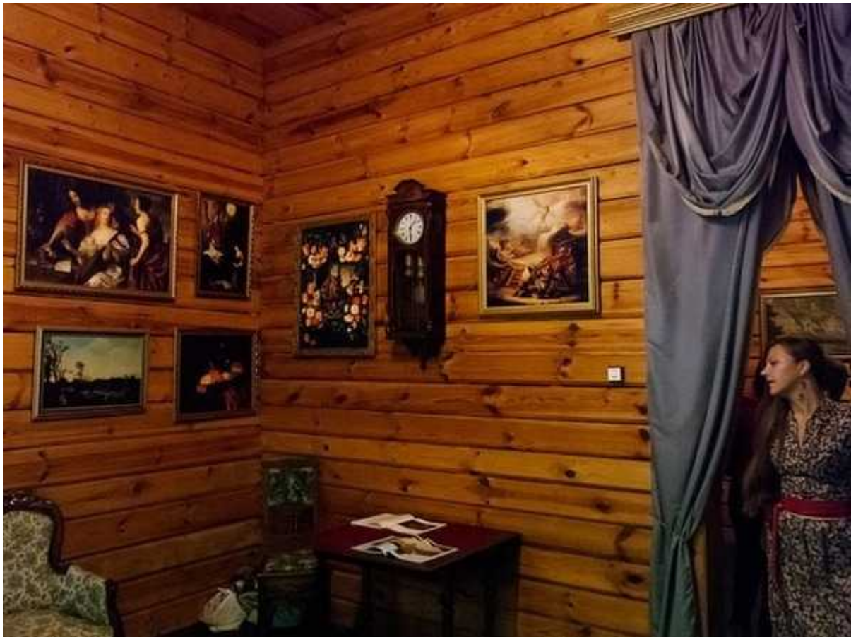
Фотография 5 из 8.