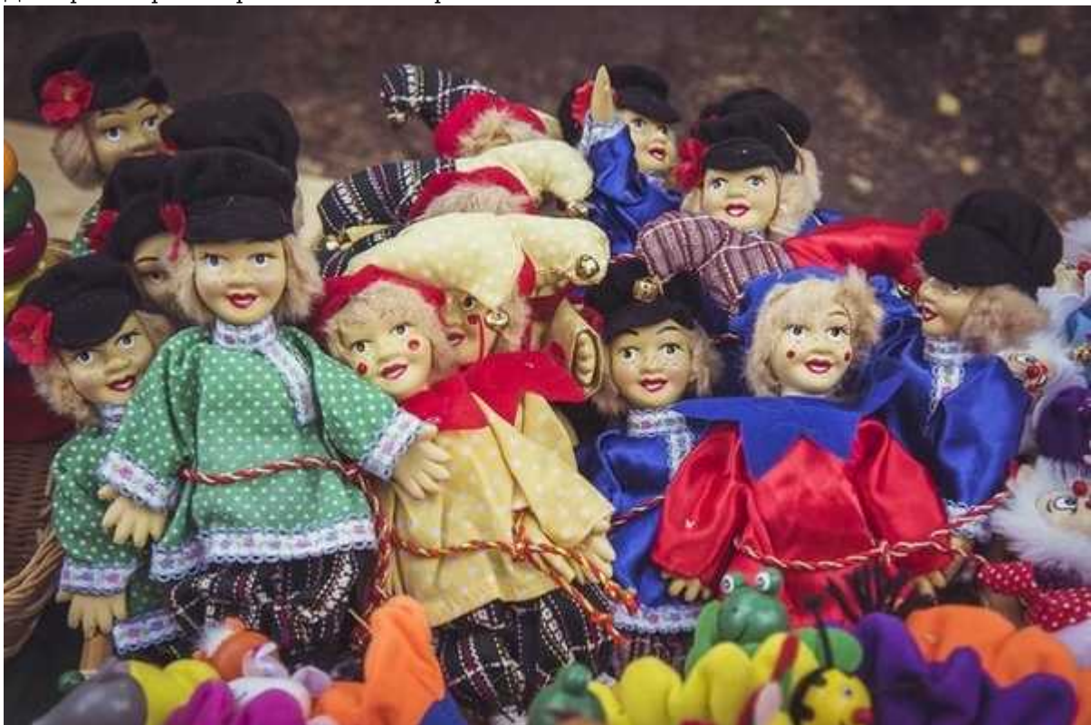
Фотография 3 из 5. Для просмотра галереи нажмите на фото.