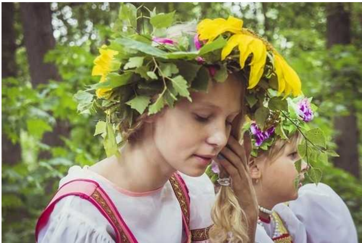
Фотография 1 из 6.

(а для студентов даже бесплатные блинчики и сладости, нестуденты же отдают за вкусности символическую плату в 10-20 рублей). Русский, китайский и киргизский чай разливается в нескольких точках — это чтобы мы прониклись личностью географа и путешественника Петра Петровича Семёнова-Тян-Шанского. По усадьбе разъезжает тарантас и катает восторженных детей.