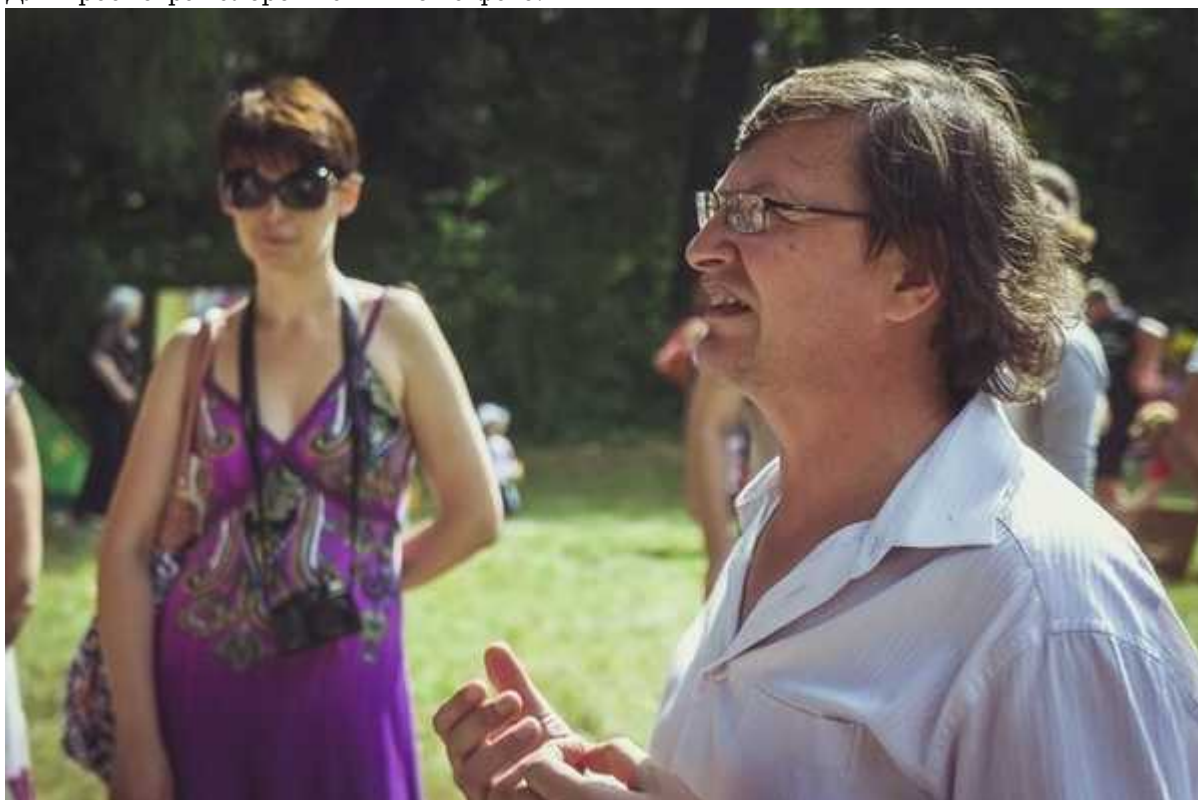
Фотография 8 из 8.