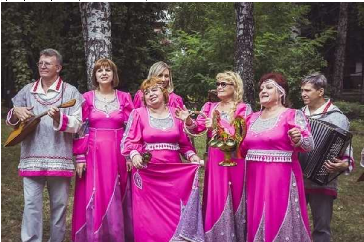
Фотография 5 из 5.