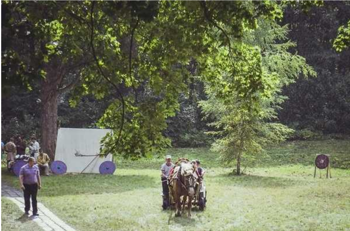
Фотография 2 из 6. Для просмотра галереи нажмите на фото.