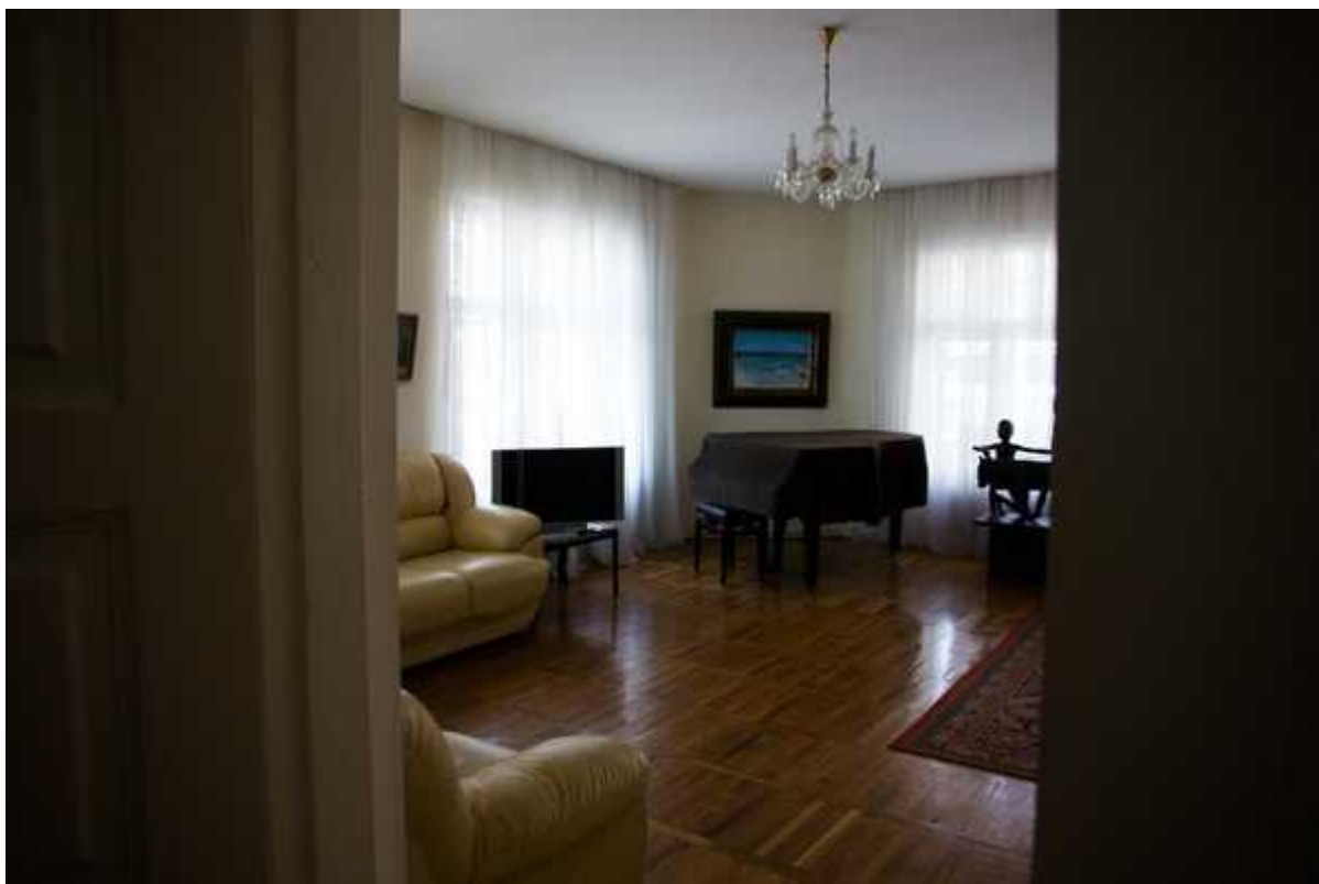
Фотография 4 из 11. Для просмотра галереи нажмите на фото.