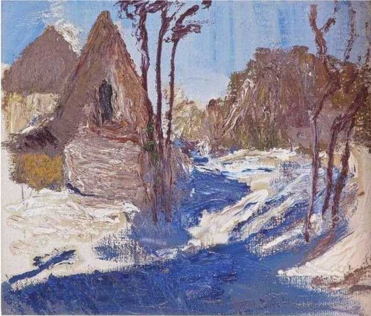
Весенний этюд. 2001

С 90-х годов его живопись изменилась. К нему пришли лёгкость и ясность. Появился усиленно-темпераментный мазок. Мощная, энергетически заряженная фактурная поверхность холста. Одним из достоинств Мастера было умение вовремя остановиться. Кое-где на работах проглядывает непрокрашенный холст, который художник оставлял для разнообразия фактур и использовал как ещё один оттенок, иногда — как демонстрацию рукотворности картины. Но главное в его искусстве — абсолютный живописный глаз, способный увидеть и сотворить сложнейшие цветовые сочетания, неожиданные и оригинальные.