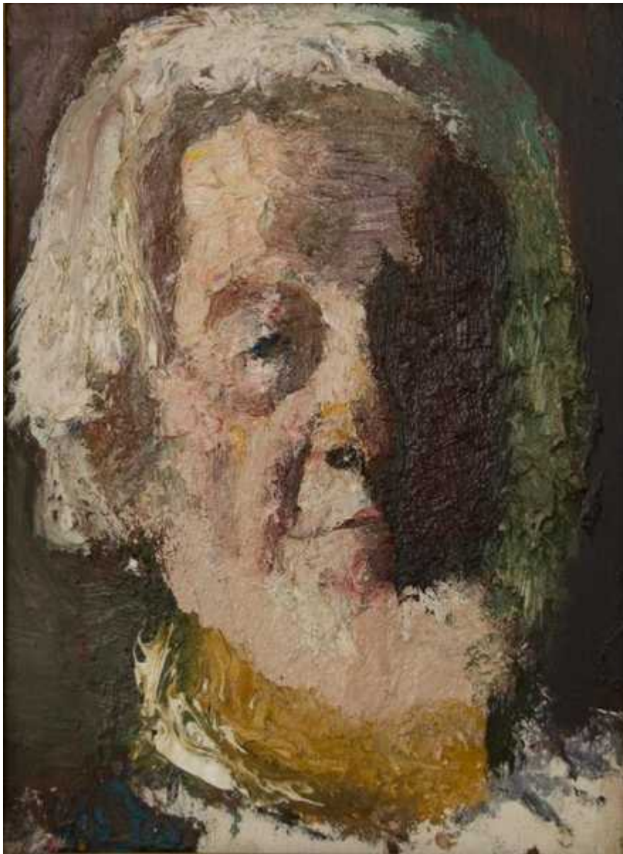
Автопортрет. 1993. Холст, масло. 40x29,5. Собрание Дома Мастера

не только кропотливым изучением средств живописной изобразительности — композиции цветowych пятен, красочной фактуры, отточенной в тысячах этюдов, но и любовью к природе, людям, словом, к Жизни.