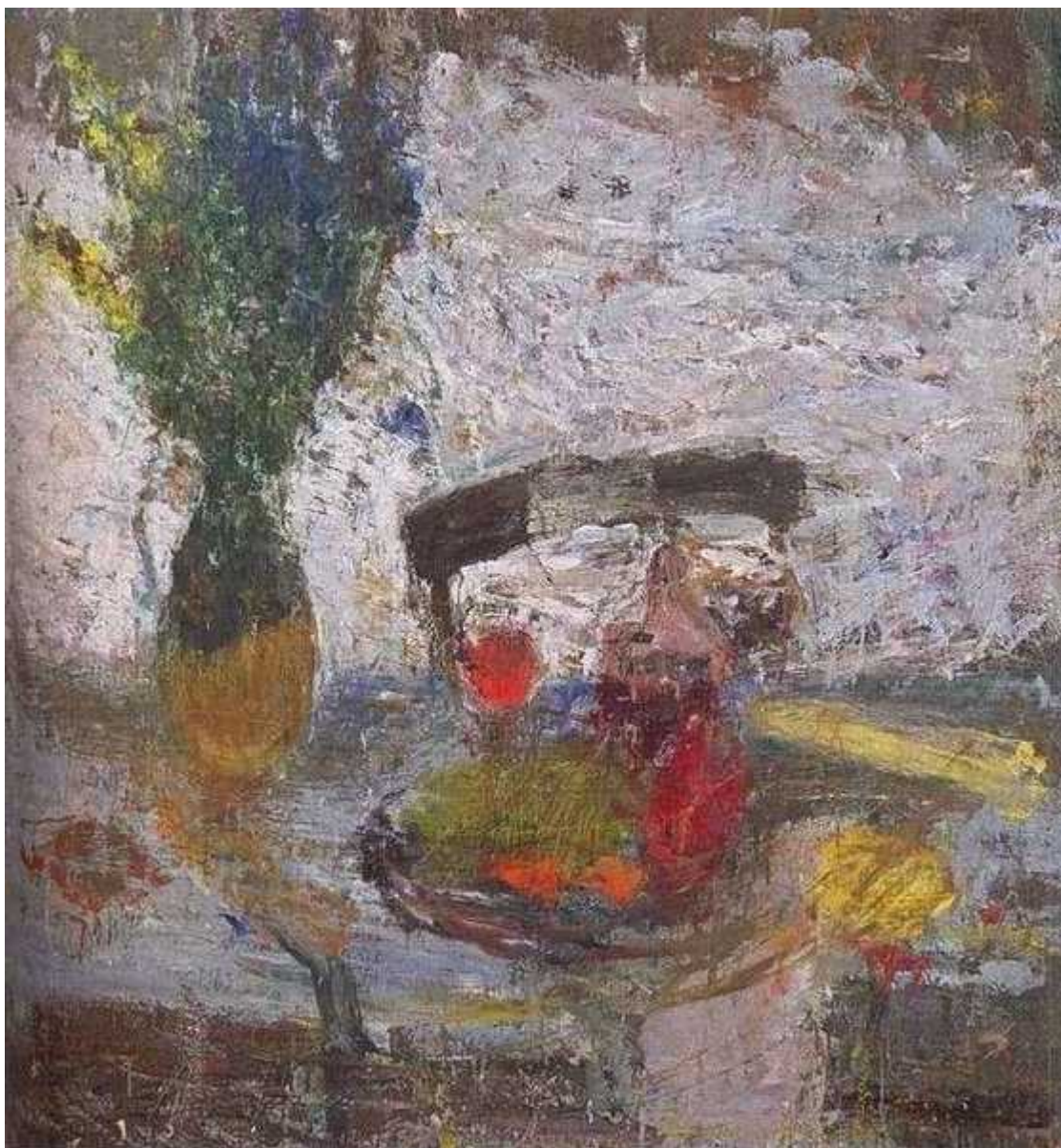
Натюрморт с букетом. 1995