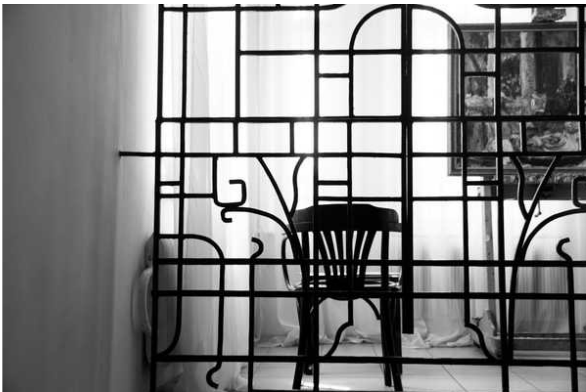
Фотография 10 из 11. Для просмотра галереи нажмите на фото.