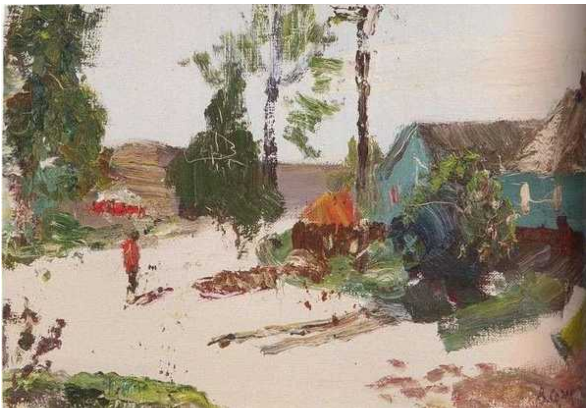
Елец. Засосна. 1995