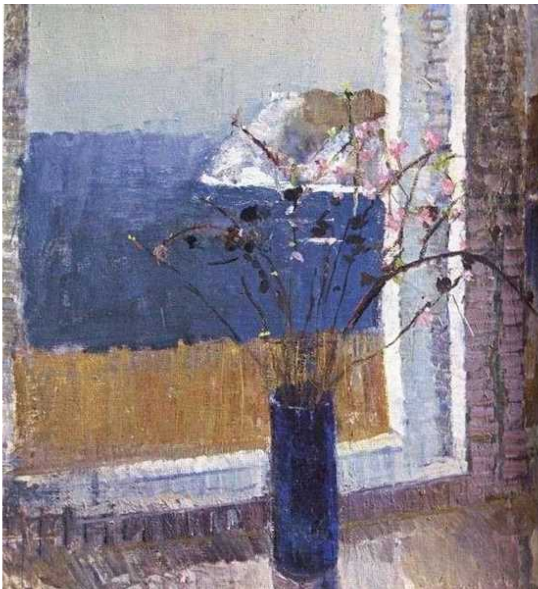
Вид на Байкал. 1985