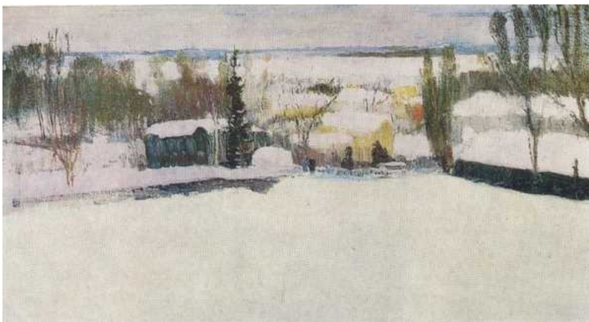
Зима в Липецке. 1971