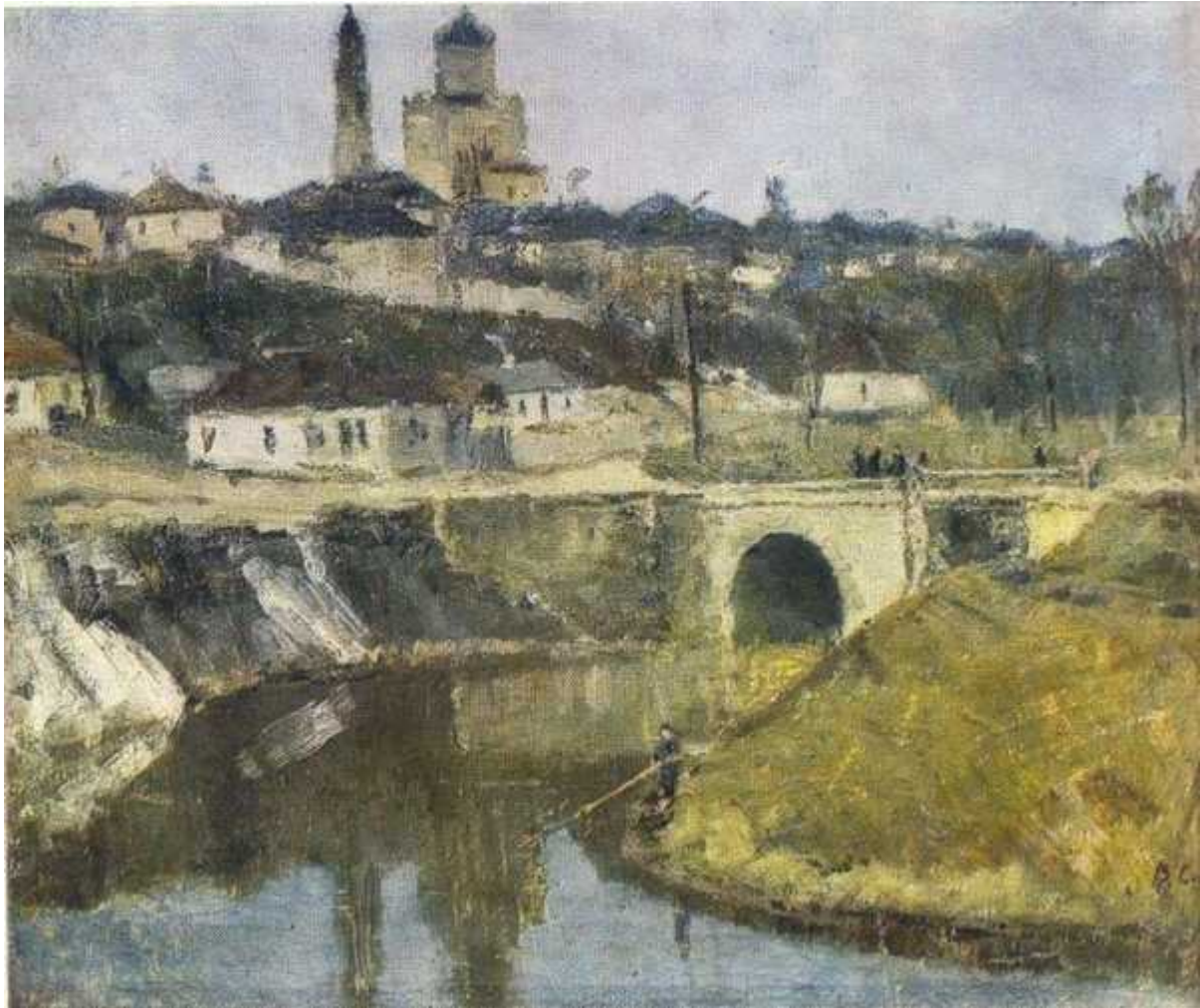
Старый Елец. 1953

После учёбы художники зарабатывали наглядной агитацией. Сорокин не мог её выполнять. Видимо, чувствовал ответственность за свой дар и знал, что не имеет права растрачивать его. Пришлось переезжать из столицы в маленький городок Елец: «Я думал, это где-то в Подмоскowie». Но он не пожалел. Елец — это прекрасная драгоценная шкатулка для художника, город-музей под открытым небом, законсервированный XIX век, почти не тронутый временем. В Ельце Сорокин работал, как считал нужным, с удовольствием писал подъёмы улиц, разноцветные домики с резными ставнями, храмы, елецкие зимки.