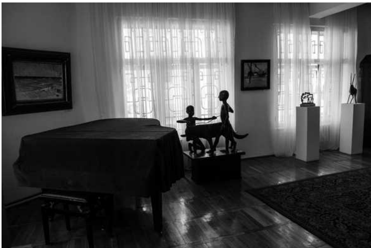
Фотография 8 из 11. Для просмотра галереи нажмите на фото.