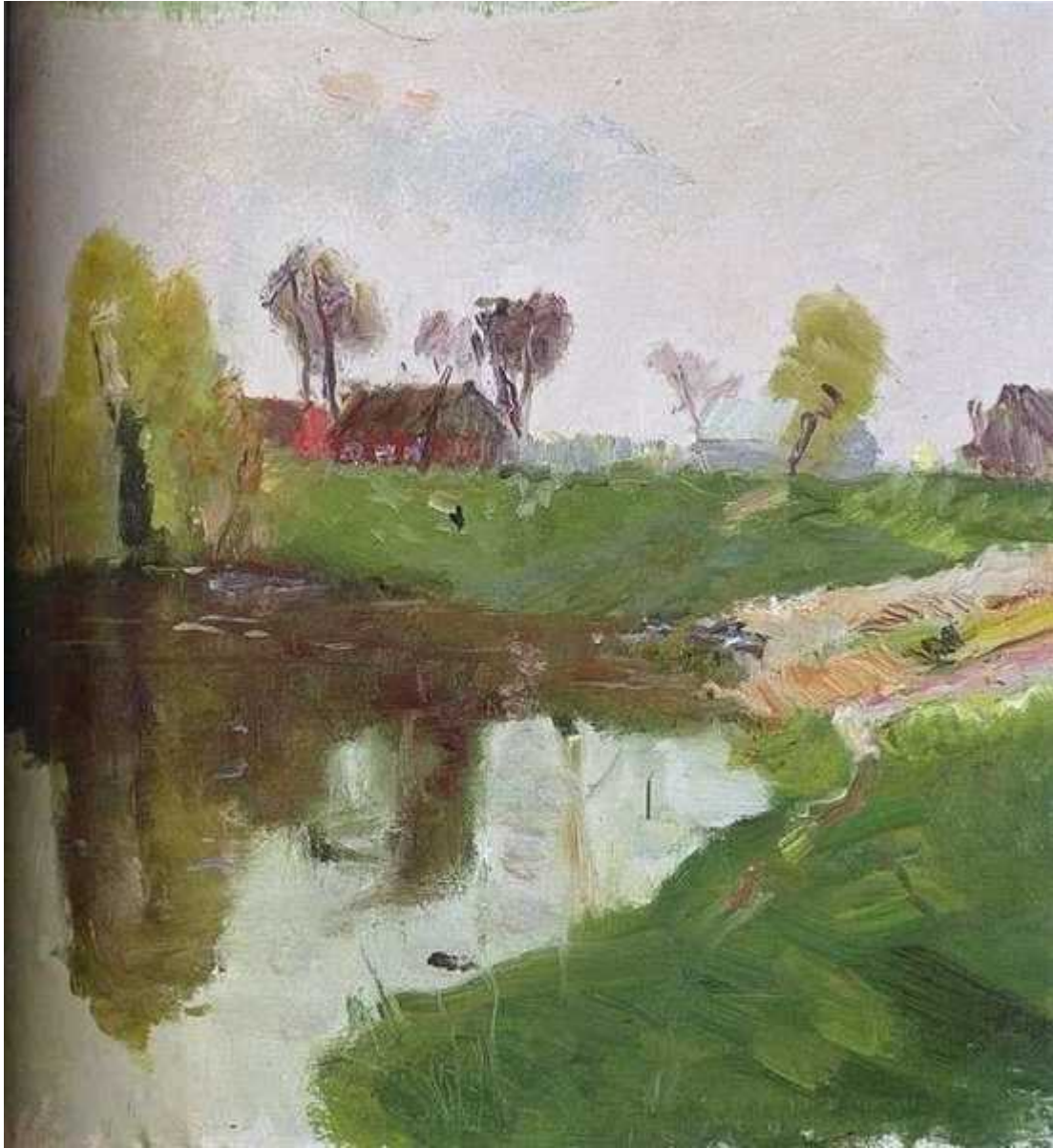
Пруд. Хрущёво. 1992