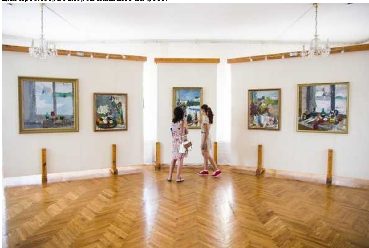
Фотография 11 из 11. Для просмотра галереи нажмите на фото.