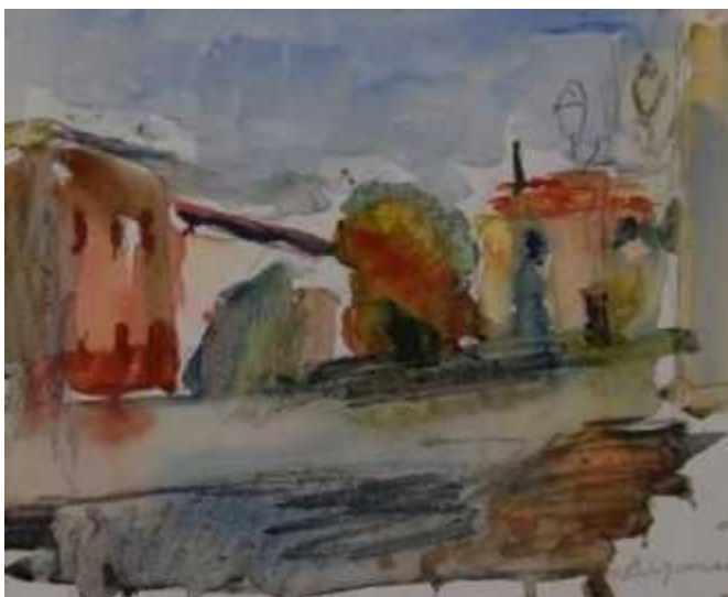
Виктор Сорокин. «Парижский пейзаж». 2001. Бумага, акварель.

Произведения Мастера хранятся в коллекциях многих отечественных музеев, а также в частных собраниях и галереях в России и за рубежом.