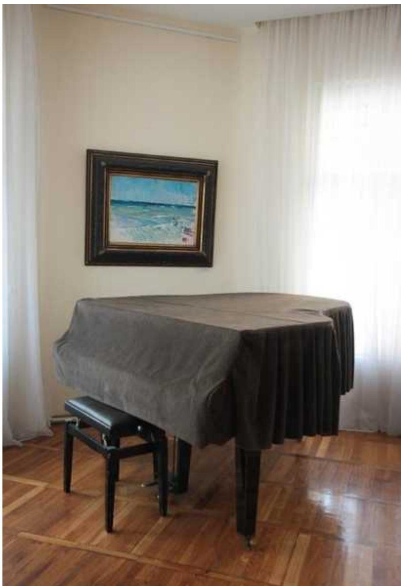
Фотография 9 из 11. Для просмотра галереи нажмите на фото.