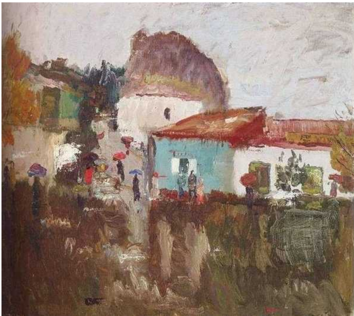
Гурфуз. Дождь. 1970