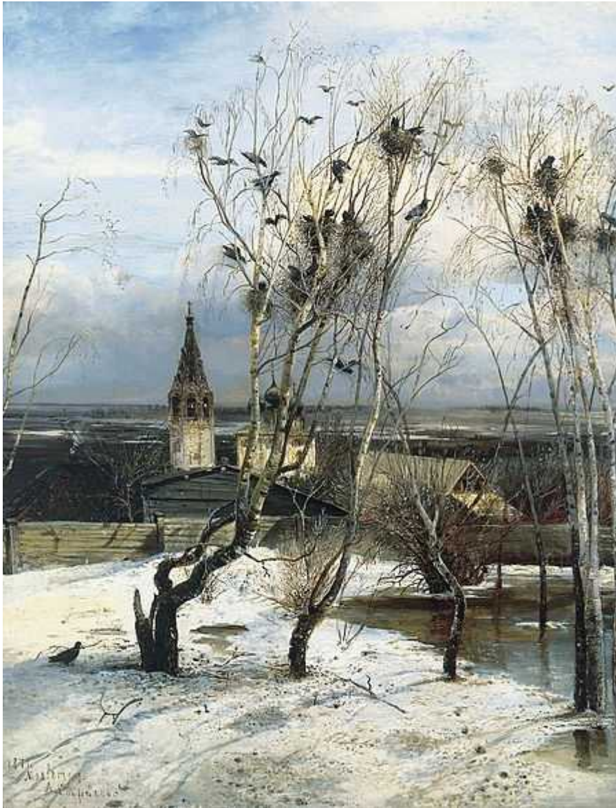
Алексей Саврасов. «Грачи прилетели». 1871 год