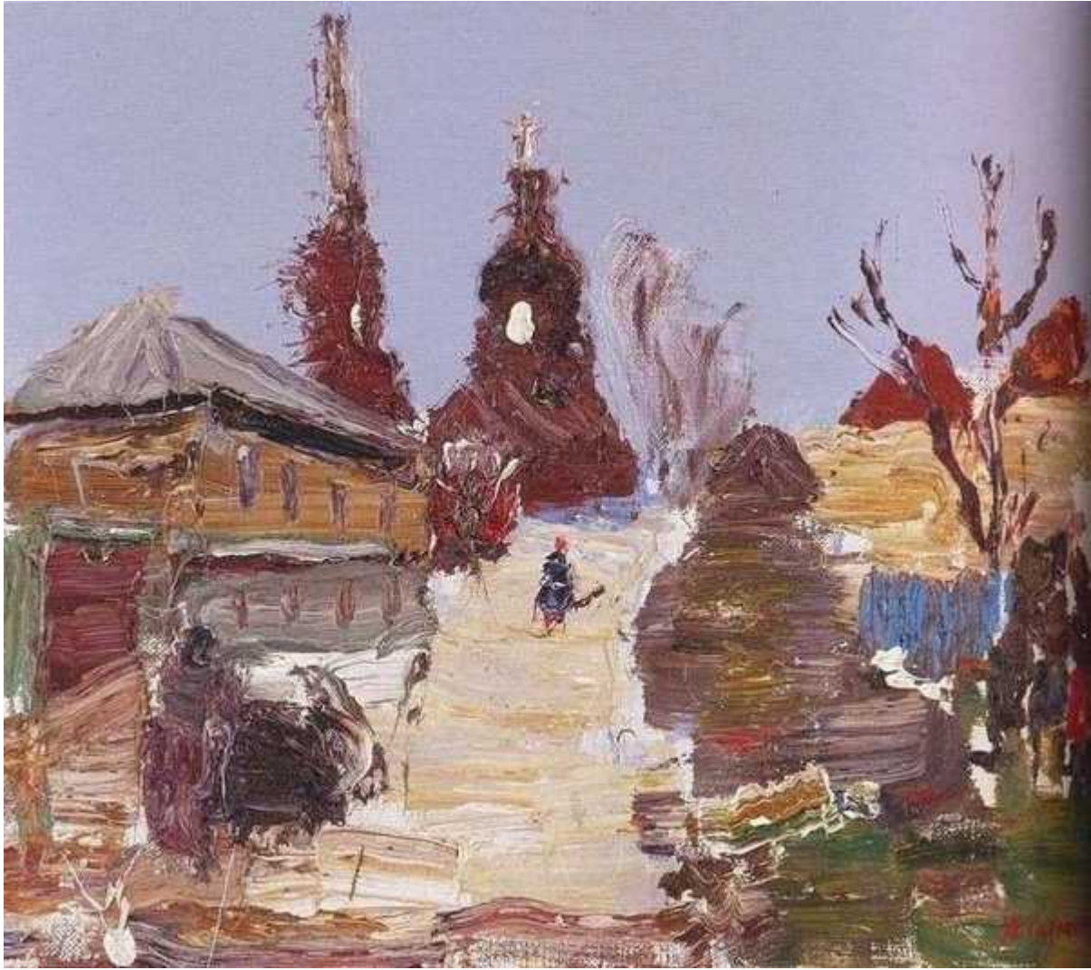
Елец. Осень. 1991