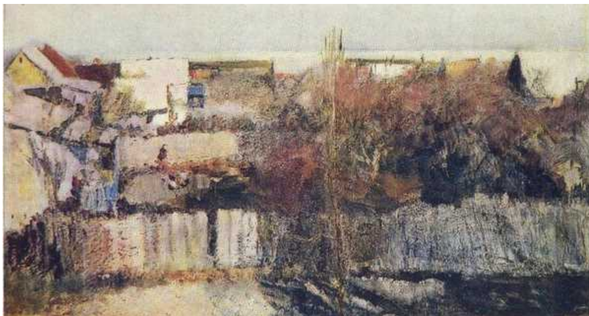
Ранняя весна. 1967