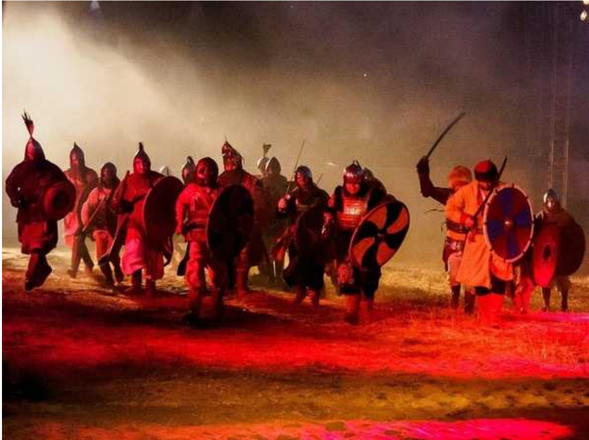
Фотография 14 из 26. Для просмотра галереи нажмите на фото.