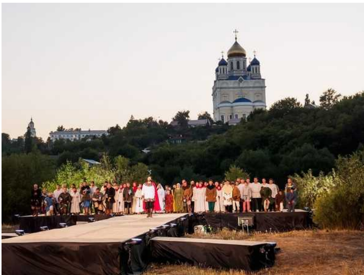
Фотография 1 из 26.

Премьера оперы прошла в 2011 году. В 2012 году постановку повторили, в 2013 в ряде городов России показали концертный вариант оперы.