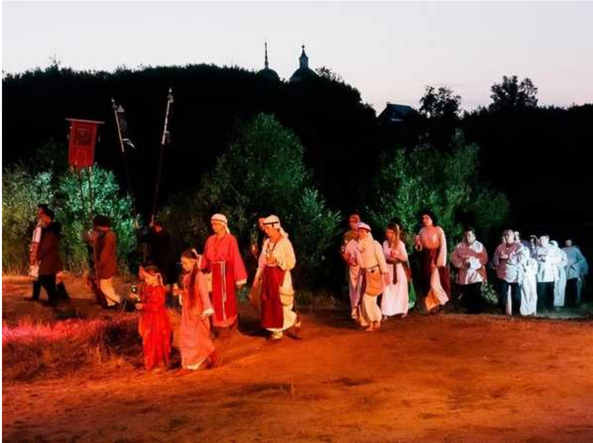
Фотография 12 из 26. Для просмотра галереи нажмите на фото.