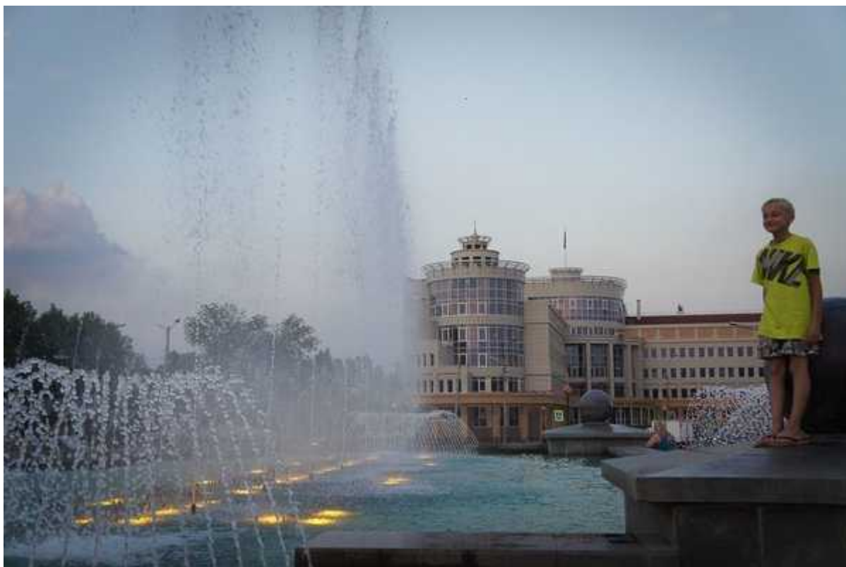
Фотография 1 из 2.