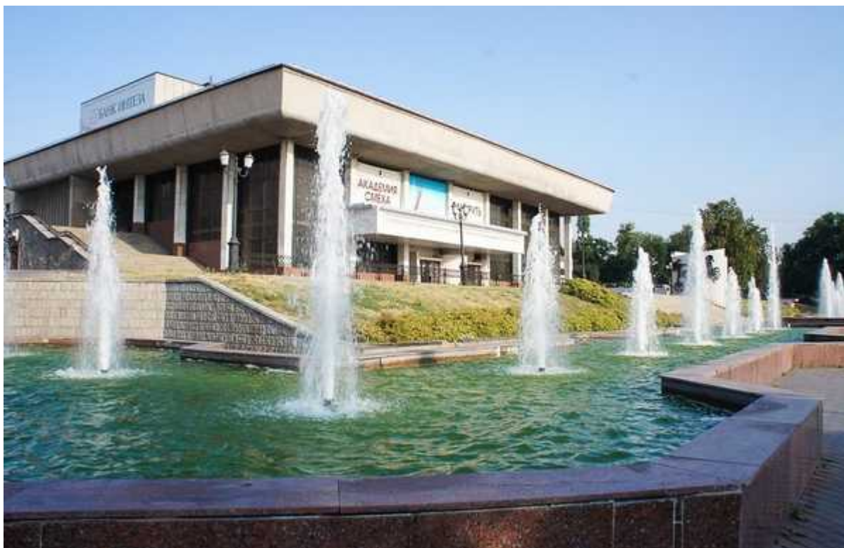
Фотография 1 из 2.