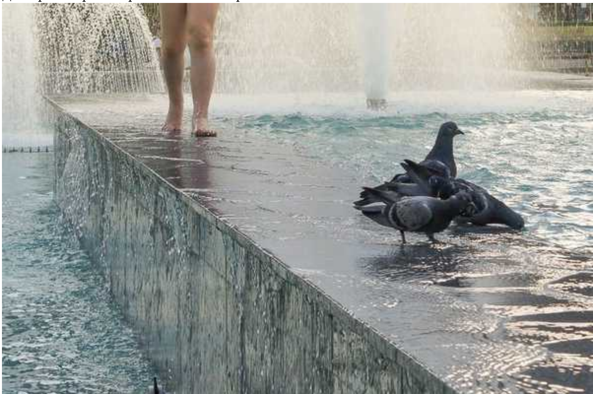
Фотография 3 из 3. Для просмотра галереи нажмите на фото.

Этот фонтан кажется вполне пригодным издалека. Но как только вы подойдёте поближе, наткнётесь на множество указательных знаков на парапете, на тротуаре и в воде,