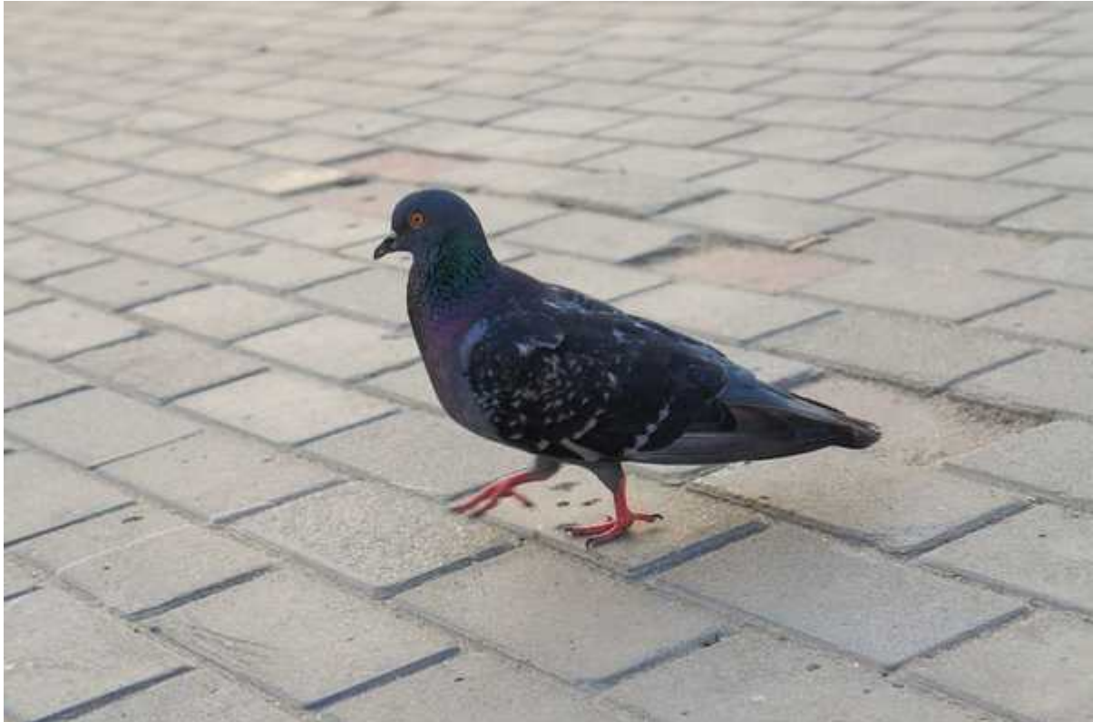
Фотография 2 из 3. Для просмотра галереи нажмите на фото.