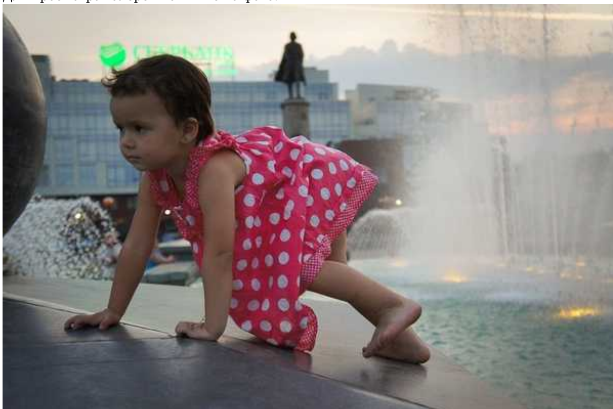
Фотография 2 из 2.