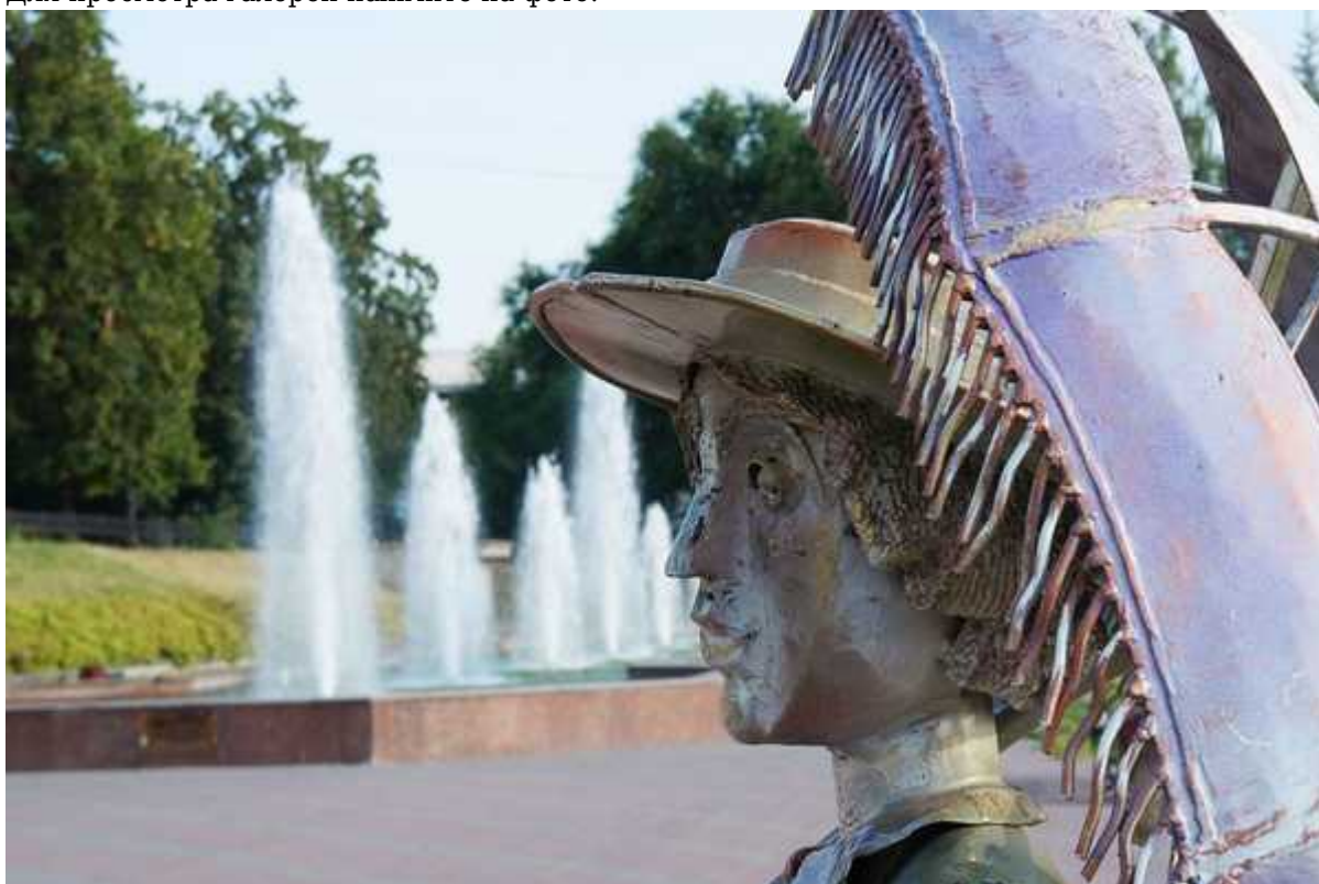
Фотография 2 из 2.