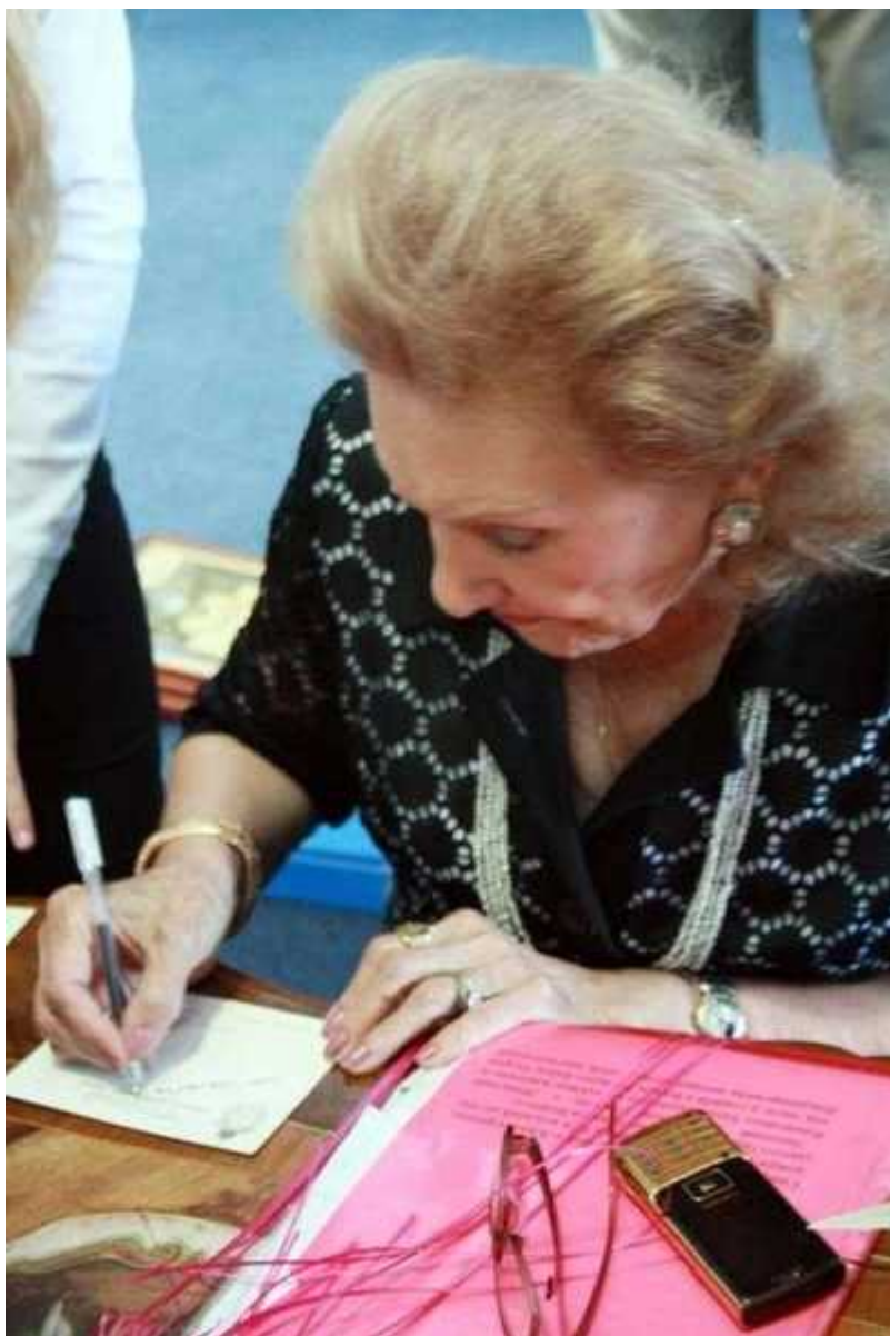
Фотография 8 из 9. Для просмотра галереи нажмите на фото.