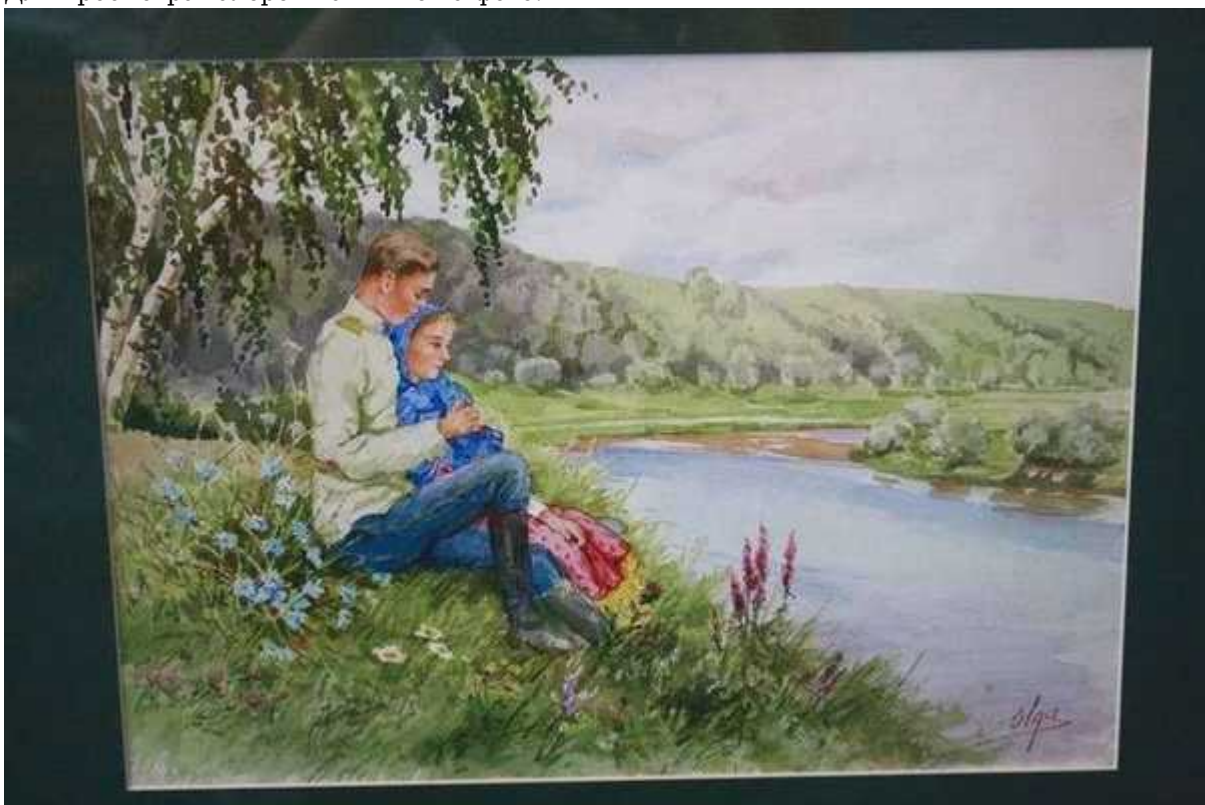
Фотография 3 из 9.