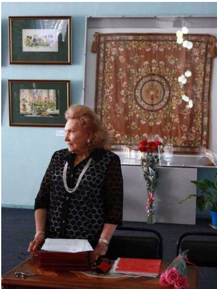
Фотография 1 из 9.

В Липецком краеведческом музее торжественно завершилась выставка Великой Княгини Ольги Александровны Романовой-Куликовской — младшей дочери Императора Александра III и Императрицы Марии Федоровны. Это одна из немногих экспозиций в наших краях, о которой стоит пожалеть, если вам не удалось её посетить. Выставка «Августейшая художница», приуроченная к наступающему 400-летию дома Романовых и 1150-летию российской государственности, была открыта два месяца назад.