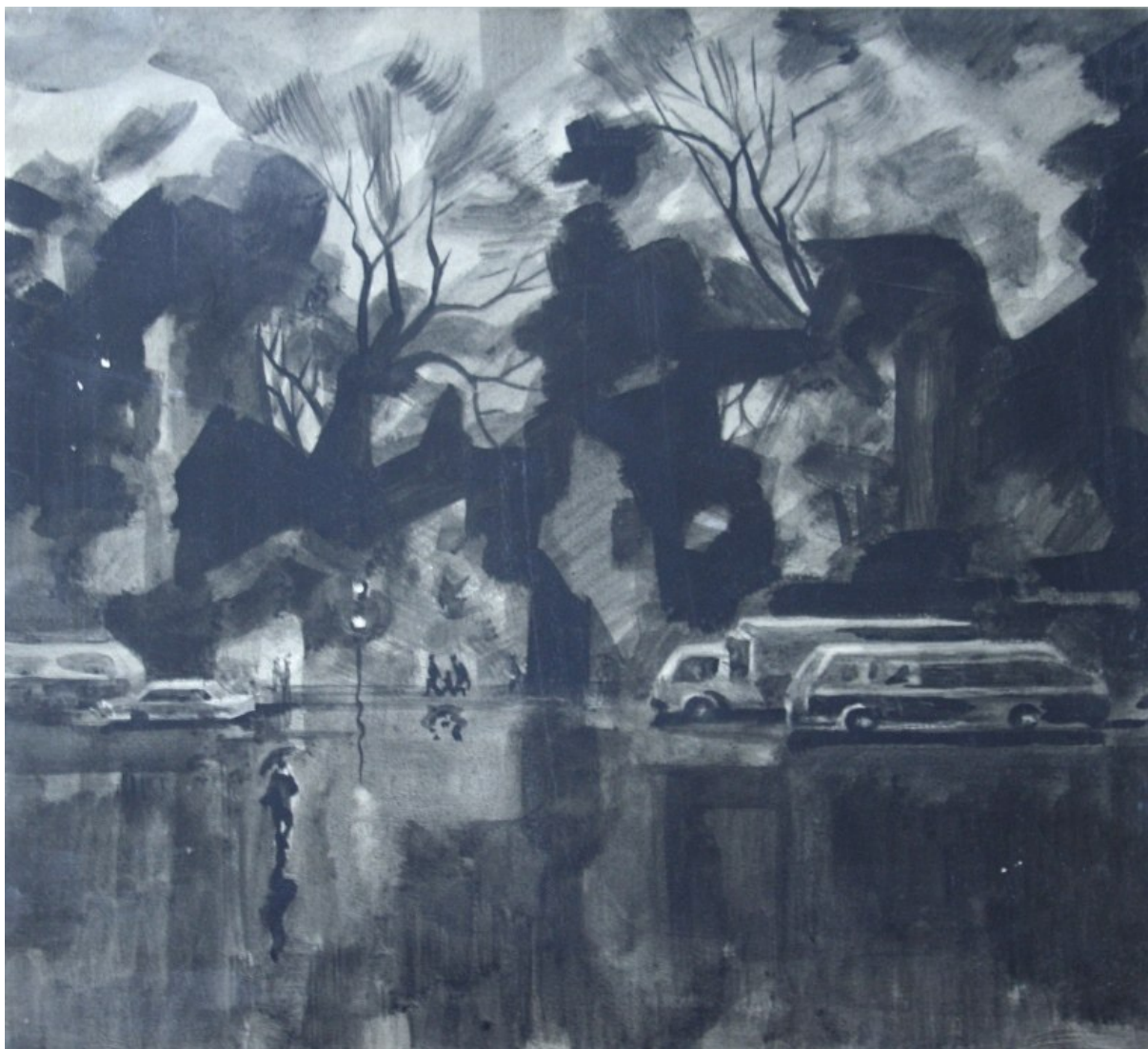
«Липецк. Вечер. Дождь» 1975 год, бумага, соус