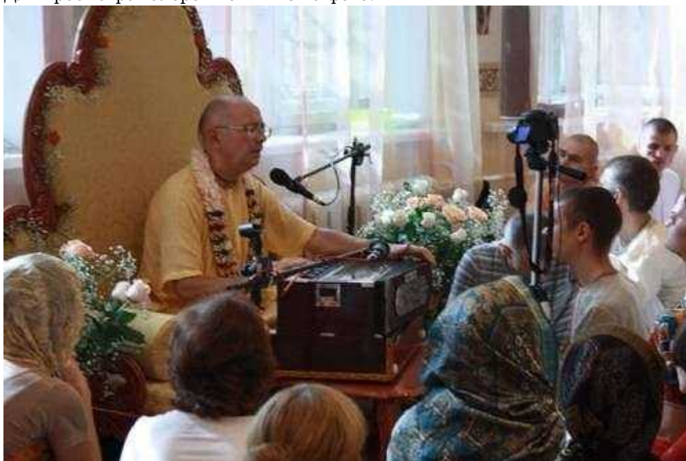
Фотография 2 из 8.