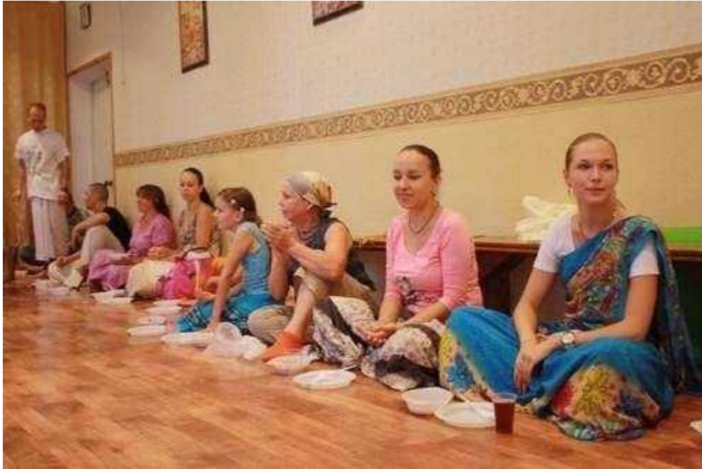
Фотография 7 из 8. Для просмотра галереи нажмите на фото.