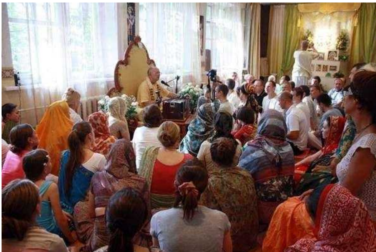
Фотография 3 из 8.