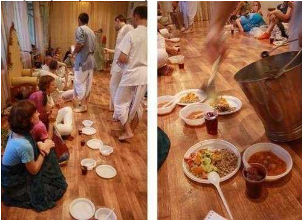
Фотография 6 из 8.