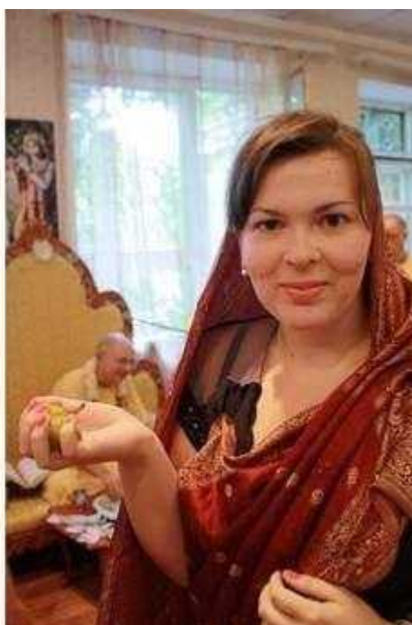
Фотография 4 из 8.