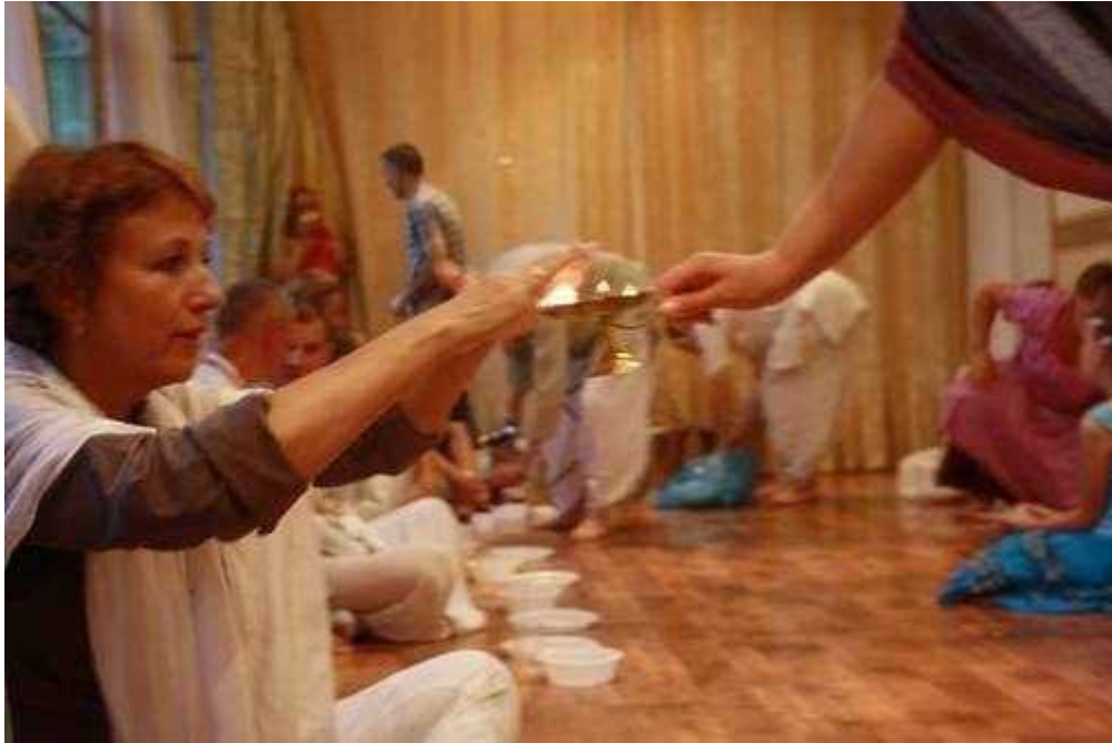
Фотография 5 из 8.