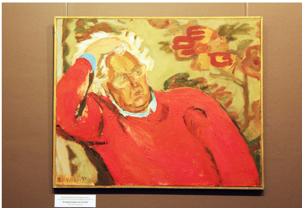
Портрет Иллариона Голицына

«Я благодарна судьбе, что в течение четырнадцати лет была рядом с ним — в работе, в атмосфере постоянного творческого накала. Его готовность к созиданию окрыляла многих. И меня».