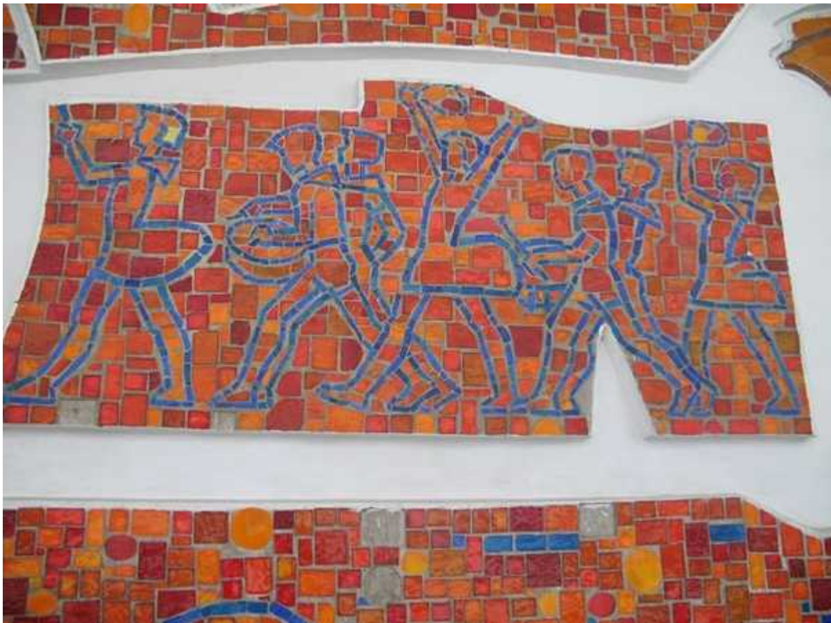
Фрагмент мозаики во Дворце пионеров на Ленинских горах

Его основные работы — росписи и мозаики во Дворце пионеров на Ленинских горах, роспись в посольстве СССР в Ливерпуле, фонтан у Рижского вокзала — значительно отличались от архитектуры того времени. В наше время основным полем его деятельности стало столярное творчество.